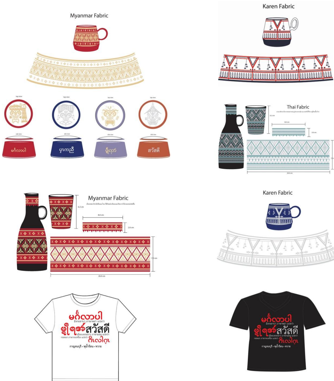
ภาพประกอบ 3 ตัวอย่างภาพร่างงานออกแบบ

ขั้นตอนนี้นำข้อมูลต่างๆที่สืบค้นและจากแบบสอบถามปลายเปิดมาออกแบบโดยใช้การร่างมือและใช้โปรแกรม Adobe Photoshop และโปรแกรม Adobe Illustrator ร่วมร่าง