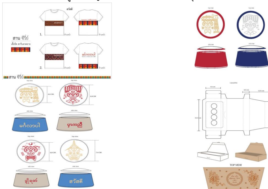
ภาพประกอบ 4 ตัวอย่างภาพแบบร่างฉบับปรับปรุงจากผู้เชี่ยวชาญ

จากผลการประเมินโดยผู้เชี่ยวชาญในแบบเบื้องต้น ได้นำมาปรับปรุงเป็นแบบฉบับที่นำไปใช้ในการผลิตดังนี้