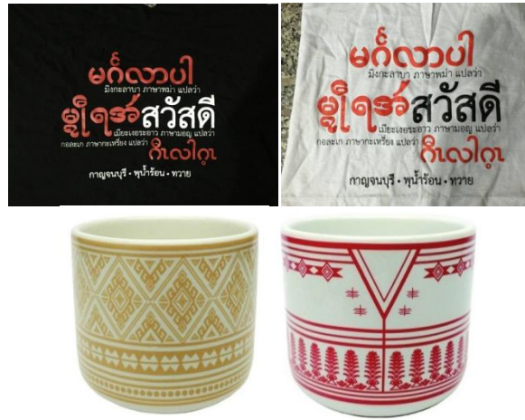
ภาพประกอบ 5 ตัวอย่างผลิตภัณฑ์ต้นแบบ

เมื่อได้แบบเบื้องต้นแล้ว ผู้วิจัยนำแบบมาผลิตเป็นผลิตภัณฑ์ของที่ระลึกต้นแบบได้ดังนี้