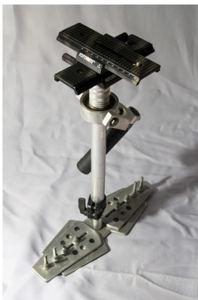
ภาพประกอบ 3 อุปกรณ์ลดการสั่นไหวของกล้องที่พัฒนาขึ้น

6. ดำเนินการพัฒนาอุปกรณ์ลดการสั่นไหวของกล้องตามแบบพิมพ์ รวมทั้งเขียนเป็นคู่มือประกอบการใช้งาน จากนั้นให้ผู้เชี่ยวชาญทางด้านเทคโนโลยีการศึกษา จำนวน 3 ท่าน ทดลองใช้งานและประเมินผลด้านต่างๆ ได้แก่ คู่มือประกอบการใช้งาน ลักษณะของอุปกรณ์ และการใช้งานอุปกรณ์ จากนั้นนำผลที่ได้มาปรับปรุงแก้ไขให้สมบูรณ์