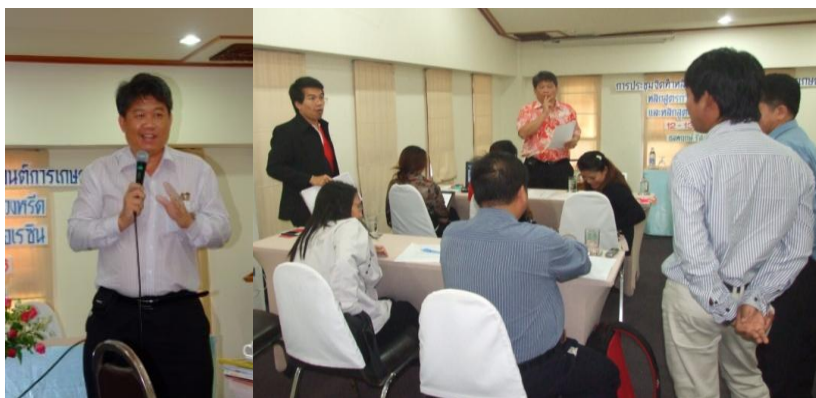
ภาพประกอบที่ 4 การประชุมจัดทำหลักสูตร เรื่องการออกแบบและหล่อเรซิน