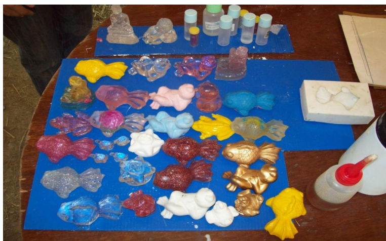
ภาพประกอบที่ 7 ชิ้นงานเรซินที่เสร็จสมบูรณ์ของผู้เข้าอบรม