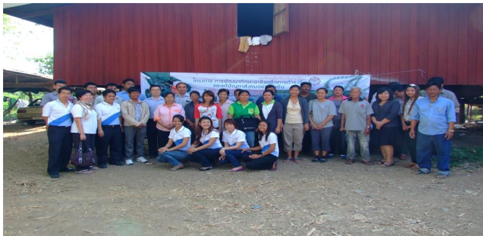
ภาพประกอบที่ 5 พิธีเปิดโครงการ การพัฒนาทักษะอาชีพ เรื่องการออกแบบและหล่อเรซินเพื่อการดำรงชีพ และลดปัญหาสังคม