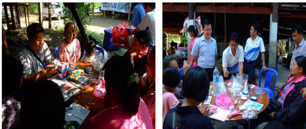
ภาพประกอบที่ 6 อบรมการฝึกทักษะอาชีพ เรื่องการออกแบบและหล่อเรซิน