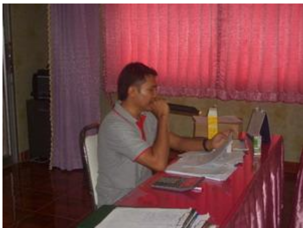
ภาพประกอบ 4 กิจกรรมให้คำปรึกษาด้านการอนุรักษ์พลังงานในครัวเรือน

1.4 กิจกรรมให้คำปรึกษาด้านการอนุรักษ์พลังงานในครัวเรือน คือ กิจกรรมที่ผู้วิจัยเป็นผู้ให้คำปรึกษาเกี่ยวกับแนวทางการลดใช้ปริมาณพลังงานไฟฟ้าสำหรับครัวเรือนที่ประสบปัญหาในการอนุรักษ์พลังงานไม่ปฏิบัติตามเป้าหมาย พร้อมทั้งติดตาม ประเมินผล และให้ข้อเสนอแนะด้านการอนุรักษ์พลังงานในครัวเรือน กิจกรรมให้คำปรึกษาด้านการอนุรักษ์พลังงานในครัวเรือน แสดงดังภาพประกอบ 4