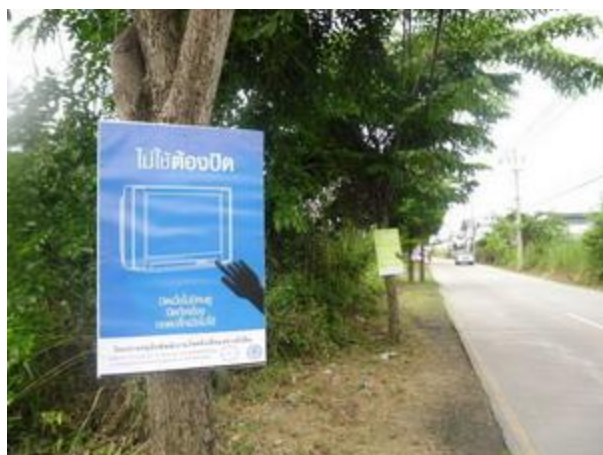
ภาพประกอบ 1 กิจกรรมรณรงค์ประชาสัมพันธ์โครงการ

1.1 กิจกรรมรณรงค์ประชาสัมพันธ์โครงการอนุรักษ์พลังงานในครัวเรือนอย่างยั่งยืน ได้แก่ การใช้ป้ายประชาสัมพันธ์ การเชิญชวนให้เข้าร่วมกิจกรรมการแข่งขันการอนุรักษ์พลังงาน กิจกรรมรณรงค์ประชาสัมพันธ์โครงการแสดงดั่งภาพประกอบ 1