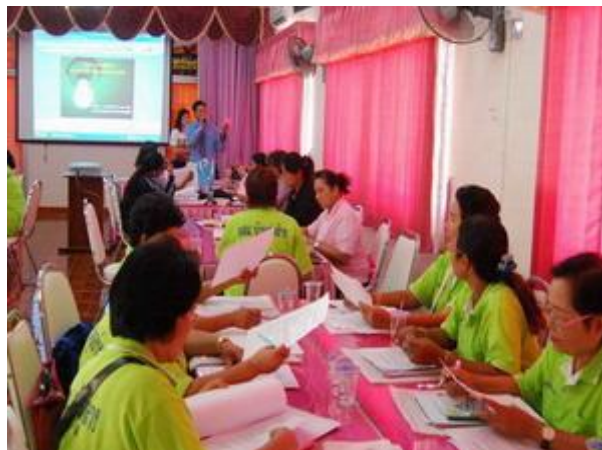
ภาพประกอบ 2 กิจกรรมการส่งเสริมการเรียนรู้ในการมีส่วนร่วมของชุมชนเพื่อการอนุรักษ์พลังงาน

การอบรมเชิงปฏิบัติการเรื่อง การอนุรักษ์พลังงานในครัวเรือนอย่างยั่งยืน กิจกรรมการส่งเสริมการเรียนรู้ในการมีส่วนร่วมของชุมชนเพื่อการอนุรักษ์พลังงานแสดงดั่งภาพประกอบ 2