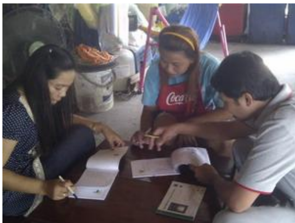
ภาพประกอบ 3 กิจกรรมการบันทึกการใช้ปริมาณพลังงานไฟฟ้าในครัวเรือน

1.4 กิจกรรมให้คำปรึกษาด้านการอนุรักษ์พลังงานในครัวเรือน คือ กิจกรรมที่ผู้วิจัยเป็นผู้ให้คำปรึกษาเกี่ยวกับแนวทางการลดใช้ปริมาณพลังงานไฟฟ้าสำหรับครัวเรือนที่ประสบปัญหาในการอนุรักษ์พลังงานไม่ปฏิบัติตามเป้าหมาย พร้อมทั้งติดตาม ประเมินผล และให้ข้อเสนอแนะด้านการอนุรักษ์พลังงานในครัวเรือน กิจกรรมให้คำปรึกษาด้านการอนุรักษ์พลังงานในครัวเรือน แสดงดังภาพประกอบ 4