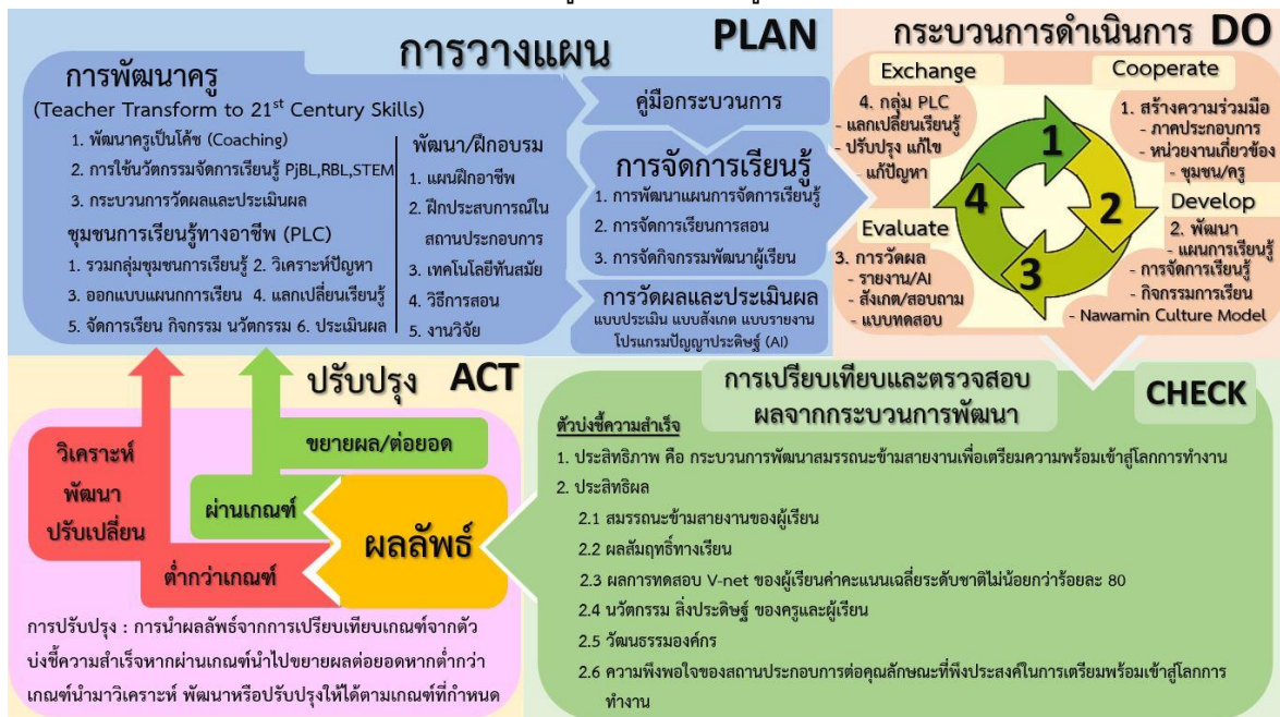
ภาพที่ 1 การพัฒนาสมรรถนะข้ามสายงาน ของผู้เรียนเพื่อเตรียมความพร้อมเข้าสู่โลกการทำงาน