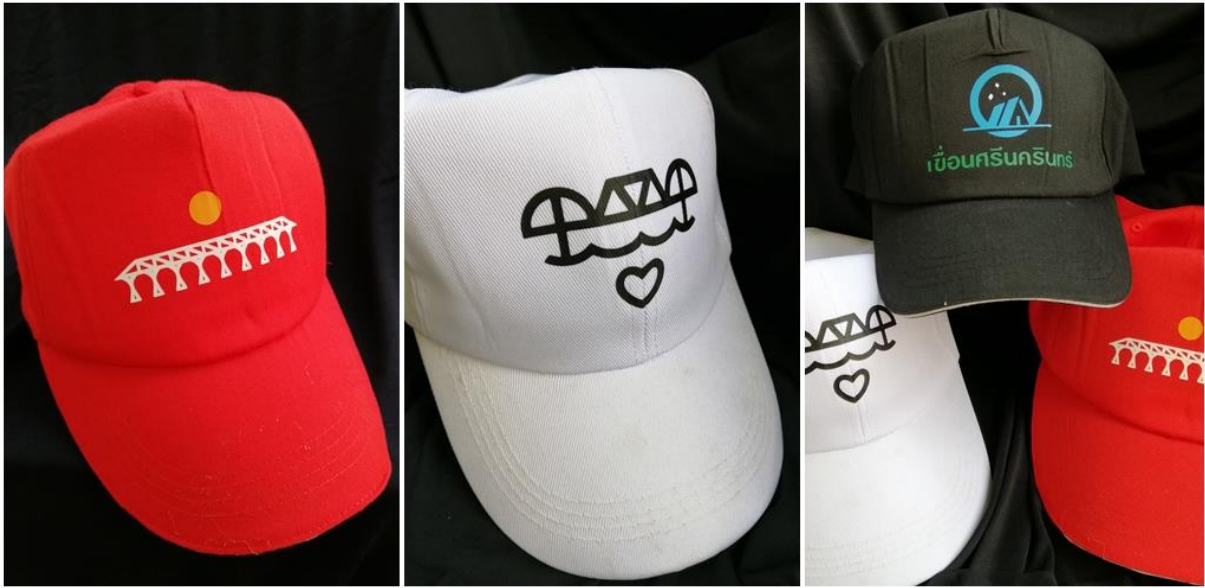
ภาพประกอบ 9 ต้นแบบผลิตภัณฑ์(mockup model)