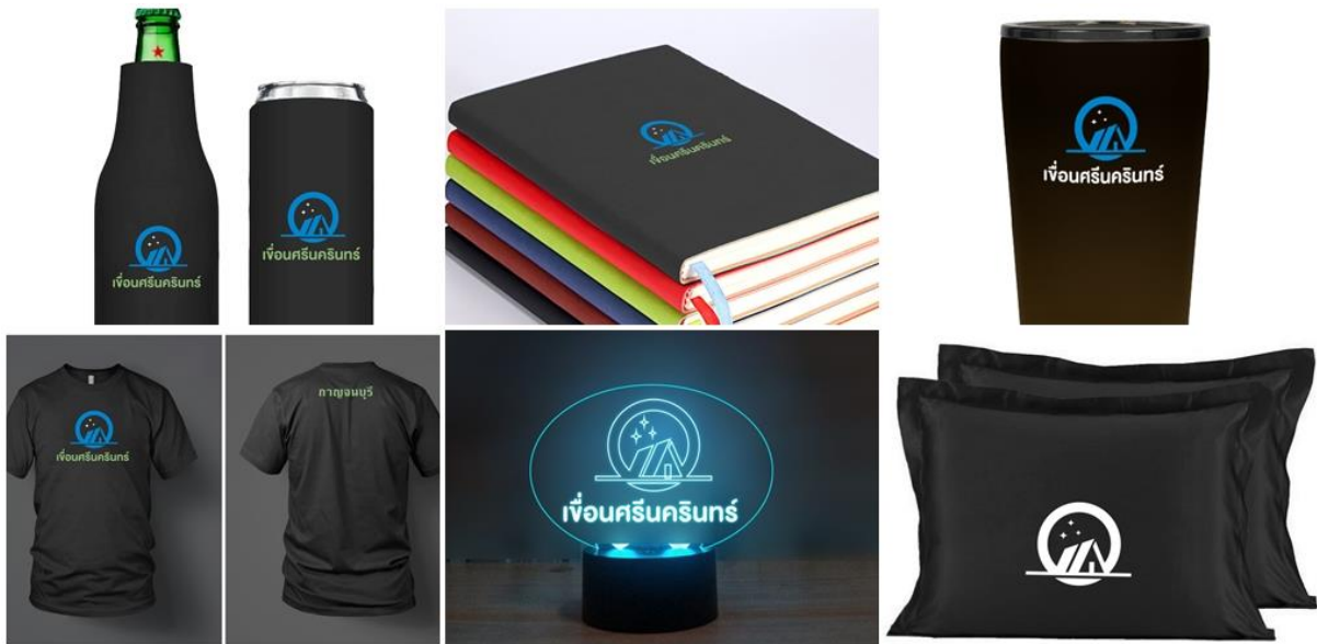
ภาพประกอบ 4 ร้างแบบและจัดทำแบบสามมิติด้วยโปรแกรมออกแบบคอมพิวเตอร์