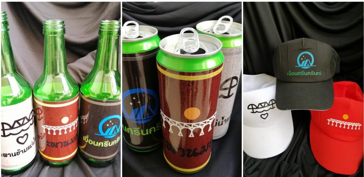
ภาพประกอบ 14 ต้นแบบผลิตภัณฑ์ (mockup model)