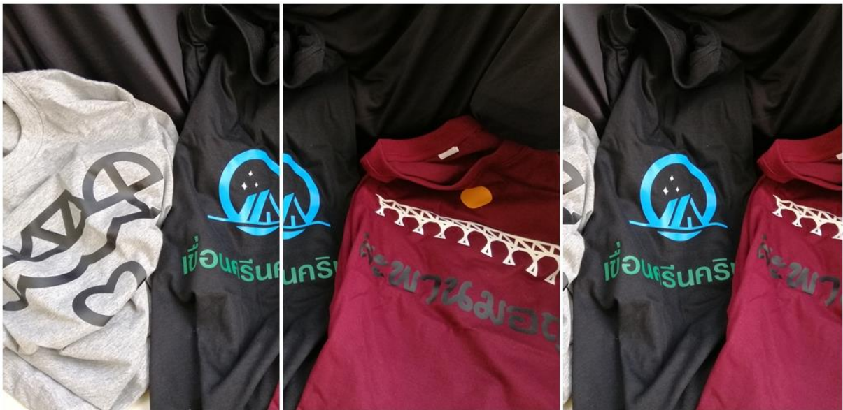
ภาพประกอบ 10 ต้นแบบผลิตภัณฑ์(mockup model)