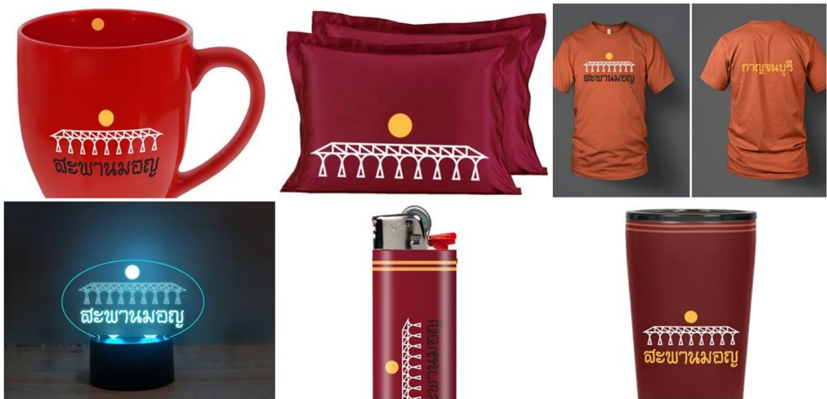
ภาพประกอบ 6 ร้างแบบและจัดทำแบบสามมิติด้วยโปรแกรมออกแบบคอมพิวเตอร์