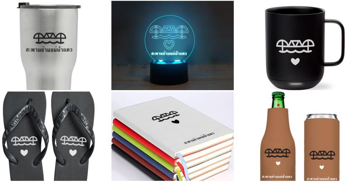
ภาพประกอบ 5 ร้างแบบและจัดทำแบบสามมิติด้วยโปรแกรมออกแบบคอมพิวเตอร์