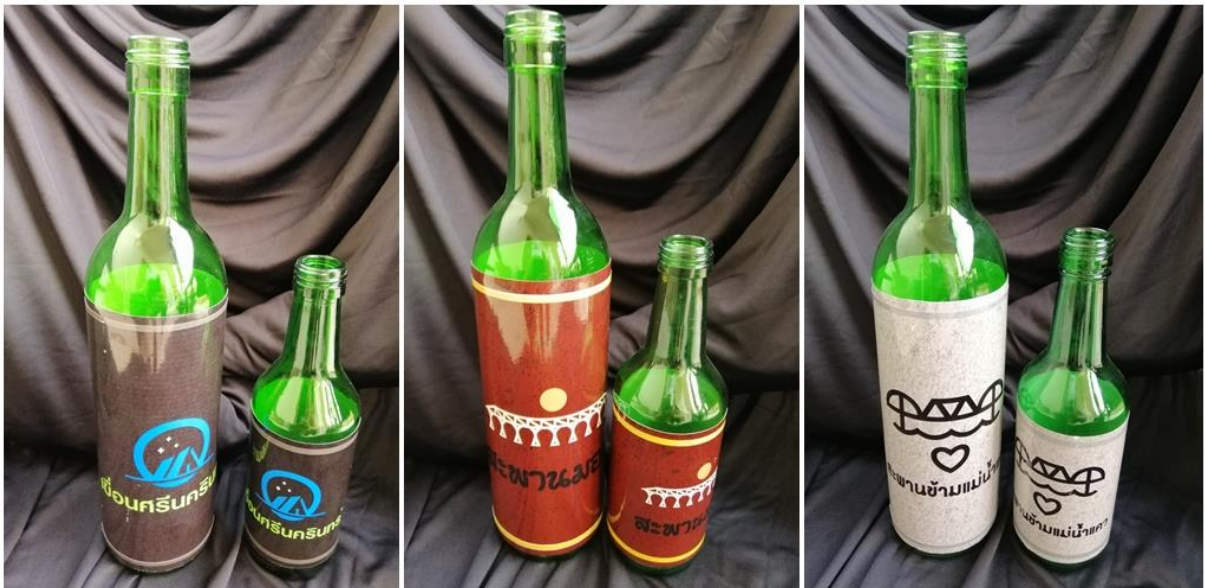
ภาพประกอบ 12 ต้นแบบผลิตภัณฑ์ (mockup model)