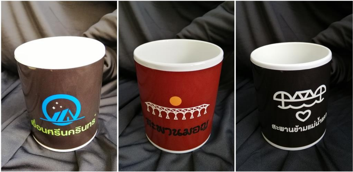
ภาพประกอบ 13 ต้นแบบผลิตภัณฑ์ (mockup model)