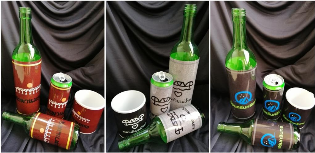
ภาพประกอบ 11 ต้นแบบผลิตภัณฑ์ (mockup model)