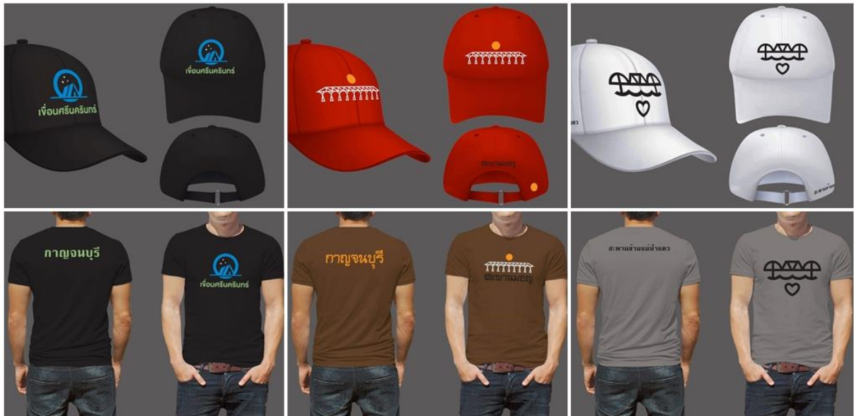
ภาพประกอบ 7 ร้างแบบและจัดทำแบบสามมิติด้วยโปรแกรมออกแบบคอมพิวเตอร์