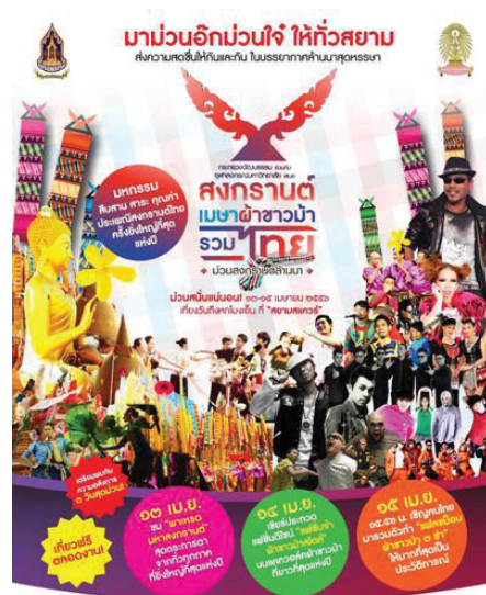
ภาพที่ 3 กิจกรรมสงกรานต์เมษาผ้าขาวม้า ซึ่งนำแนวคิดเรื่องผ้าขาวม้ามาใช้เพื่อสะท้อนให้เห็นถึงอัตลักษณ์ความเป็นไทย