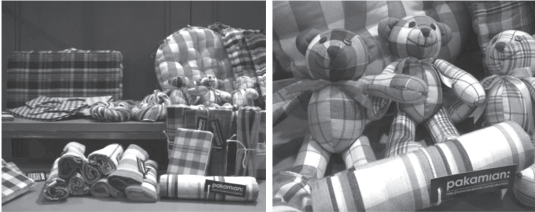
ภาพที่ 7 ผลิตภัณฑ์ต่าง ๆ จากผ้าขาวม้า