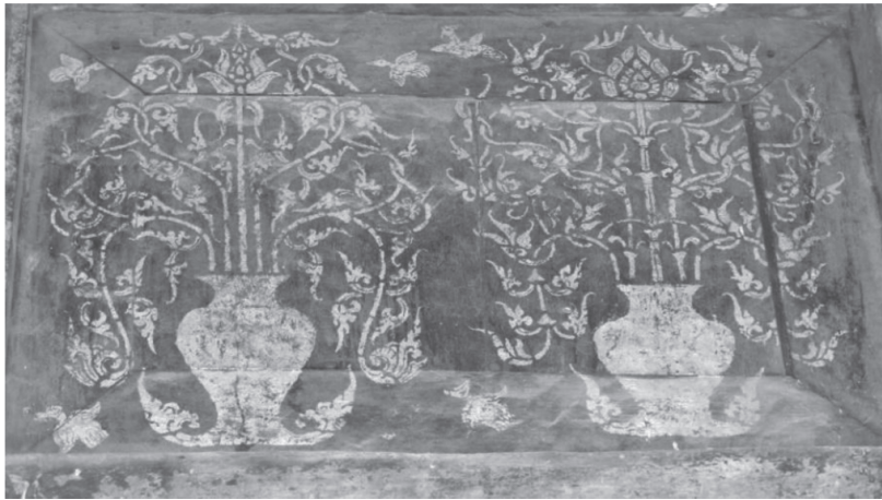
ภาพที่ 2 จิตรกรรมลายหม้อปู้รณชฎะภายในวิหารวัดพระธาตุลำปางหลวง

ทุนทางวัฒนธรรมที่จับต้องได้คือ ตัวยตราประทับซึ่งเป็นโบราณวัตถุที่สามารถจับต้องได้ ส่วนทุนทางวัฒนธรรมที่จับต้องไม่ได้คือ ความเชื่อของลายหม้อปู้รณชฎะที่ชาวอินเดียเชื่อว่าเป็นสัญลักษณ์แห่งความอุดมสมบูรณ์และยังสอดคล้องกับความเชื่อของชาวล้านนาที่อาศัยอยู่ในประเทศไทยซึ่งสะท้อนให้เห็นได้จากงานจิตรกรรมภายในวิหารของวัดพระธาตุลำปางหลวงหรือวัดปงยางคก จังหวัดลำปาง