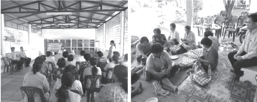
ภาพที่ 4 โครงการฝึกทักษะอาชีพหลักสูตรระยะสั้นวิชาการทอผ้าขาวม้า

คุณค่าเชิงวิชาการนี้เกิดขึ้นจากการศึกษา การค้นคว้า การวิจัย อย่างเป็นระบบและมีความน่าเชื่อถือ อีกทั้งยังเป็นหลักฐานในการยืนยันความสำคัญของทรัพยากรวัฒนธรรมนั้น ๆ ได้เป็นอย่างดี จากการศึกษพบว่าองค์ความรู้ในเชิงวิชาการต่าง ๆ เหล่านี้ถูกทำไปเผยแพร่ในรูปแบบต่าง ๆ อาทิ การนำเอาความรู้ที่เกี่ยวข้องกับผ้าขาวม้าไปบรรจุอยู่ในหลักสูตรท้องถิ่นตามสถานศึกษา การฝึกอบรม/สัมมนา ตลอดจนสิ่งพิมพ์และสื่อออนไลน์ต่าง ๆ