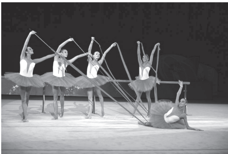
ภาพที่ 5 การผสมผสานการเต้นในรูปแบบบัลเลต์กับกีฬายิมนาสติกลีลา

ยิมนาสติกลีลามีรูปแบบโครงสร้างของชุดที่ตายตัว ไม่สามารถใช้ผ้าที่โปร่งบาง ต้องเป็นผ้ายืดหยุ่นแนบเนื้อ ชุดที่มีความยาวถึงข้อเท้าหรือแขนยาวต้องเป็นชิ้นเดียวกัน ชุดกระโปรงต้องเป็นชุดติดกันไม่แยกคนละชุดและมีความยาวตามที่สหพันธ์กีฬายิมนาสติกนานาชาติกำหนด