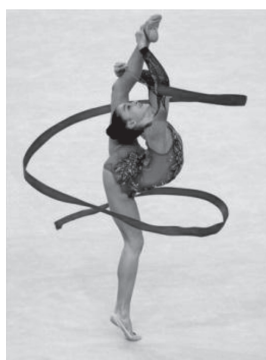
ภาพที่ 2 ทักษะการหมุน