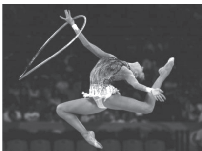
ภาพที่ 3 ทักษะการกระโดด