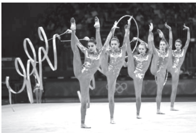
ภาพที่ 7 กีฬายิมนาสติกลีลาประเภททีม กลุ่มท่าการทรงตัว

จากภาพที่ 6 นักกีฬาต้องการจะสื่อสารอารมณ์ออกมาให้ผู้ชมหรือคณะกรรมการ ให้คล้อยตามไปกับการแสดงของนักกีฬา