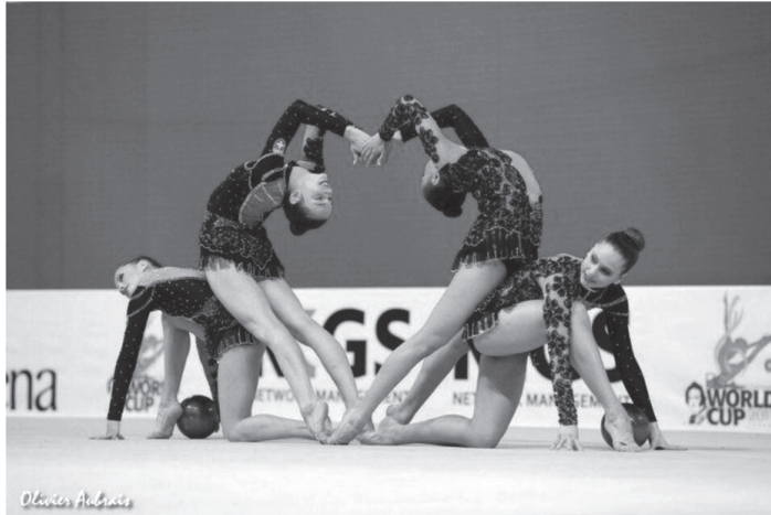
ภาพที่ 8 การออกแบบลีลาในการแข่งขันยิมนาสติกลีลาประเภททีม ที่มา https://www.pinterest.com/pin/5๔๓๗๓๙๓๕๔๙๘๓๖๑๑๒๐๒/

จากภาพที่ 8 การออกแบบลีลาที่มีการจัดวางองค์ประกอบเชิงสัญลักษณ์ รูปหัวใจ ได้อย่างสมบูรณ์ 2. ปัจจัยเสริมจากภายนอก สามารถพิจารณาได้จากอุปกรณ์ในการแสดง เครื่องแต่งกาย และการออกแบบเสียงที่สร้างความหลากหลายทำให้เกิดความโดดเด่นแตกต่างกันในแต่ละทีม