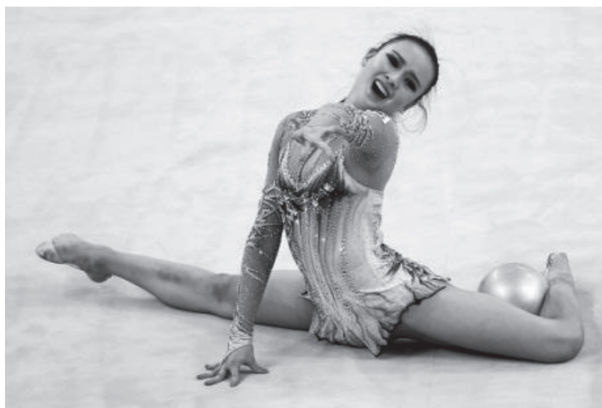
ภาพที่ 6 กีฬายิมนาสติกประเภทบุคคลอุปกรณ์บอล