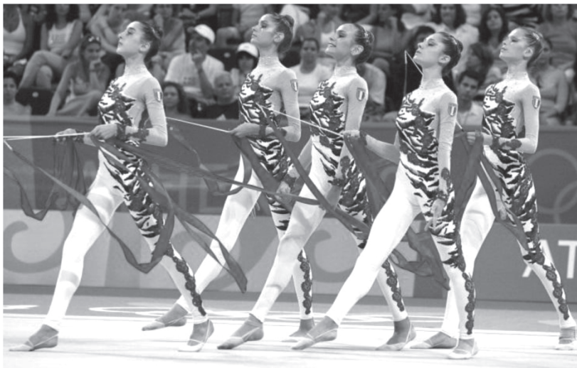
ภาพที่ 9 เครื่องแต่งกายในการแข่งขันยิมนาสติกลีลา

จากภาพที่ 8 การออกแบบลีลาที่มีการจัดวางองค์ประกอบเชิงสัญลักษณ์ รูปหัวใจ ได้อย่างสมบูรณ์ 2. ปัจจัยเสริมจากภายนอก สามารถพิจารณาได้จากอุปกรณ์ในการแสดง เครื่องแต่งกาย และการออกแบบเสียงที่สร้างความหลากหลายทำให้เกิดความโดดเด่นแตกต่างกันในแต่ละทีม