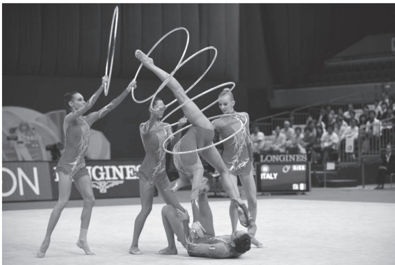
ภาพที่ 10 กีฬายิมนาสติกลีลาประเภททีม อุปกรณ์ห่วง

จากภาพที่ 10 แสดงให้เห็นถึงการออกแบบการใช้อุปกรณ์ที่มีการไล่ระดับจากบนไปล่างในขณะที่นักกีฬาหยุดนิ่งโดยที่ร่างกายมีลักษณะแยกขา แอนหลัง ซึ่งเพื่อนร่วมทีมที่นอนอยู่บนพื้นได้ใช้ขาข้างหนึ่งดันหลังนักกีฬาที่แอนตัวอยู่นั้น ทำให้เกิดลักษณะการจัดวางที่สวยงามไม่วุ่นวาย แสดงให้เห็นถึงการใช้อุปกรณ์กับลีลาได้อย่างลงตัว