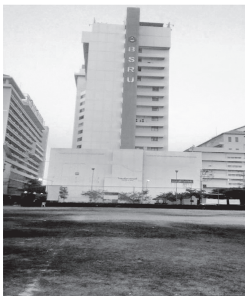
อาคารสีหราชเดโชชัยที่ใช้เรียนดนตรี

ในยุคมหาวิทยาลัยราชภัฏบ้านสมเด็จเจ้าพระยา (พ.ศ. ๒๕๔๗ - ๒๕๕๔)