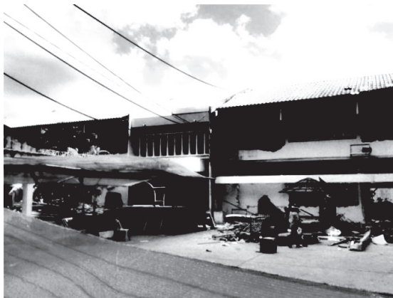
อาคารดนตรีอนุสรณ์ถ่ายจากมุมสูง