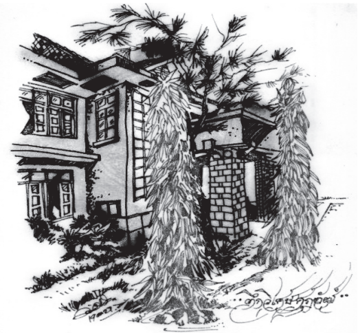
อาคารดนตรีอนุสรณ์ที่ใช้เรียนดนตรี ในยุคสถาบันราชภัฏบ้านสมเด็จพระเจ้าพระยา (พ.ศ. ๒๕๓๕- ๒๕๔๖)