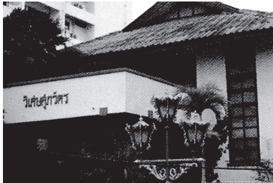
อาคารวิเศษสุวรรณที่ใช้เรียนดนตรี ในยุควิทยาลัยครู (พ.ศ. ๒๕๑๓ - ๒๕๓๔)

บ้านสมเด็จพระเจ้าพระยา ได้รับงบประมาณในการจัดสร้างอาคารเรียน โดยสาขาวิชาดนตรีได้รับการจัดสรรพื้นที่ใช้งานเพียงบางส่วน ซึ่งไม่สามารถรองรับกับความต้องการในการจัดการเรียนการสอนได้เพียงพอ สำหรับเครื่องดนตรี วัสดุดนตรี และอุปกรณ์สนับสนุนการสอนดนตรีนั้น ถือเป็นสิ่งที่ขาดแคลนมาตั้งแต่เริ่มเปิดสอนวิชาดนตรี แม้จะมีการดำเนินการจัดซื้ออยู่บ้างตามงบประมาณที่ได้รับการจัดสรรมาในแต่ละปี ก็ยังไม่เพียงพอต่อความต้องการ เนื่องจากเป็นวัสดุที่มีราคาสูง ประกอบกับมีการรับนักศึกษาที่เพิ่มมากขึ้น