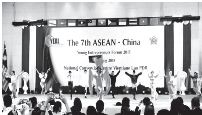
ภาพที่ 6 การแสดงชุดรวมกันเป็นหนึ่ง ในงาน The 7 th ASEAN-China Young Entrepreneurs Forum พ.ศ. 2558

จากประสบการณ์จริงที่ผู้วิจัยได้เข้าไปร่วมทำงานเกี่ยวกับด้านการแสดงนาฏยศิลป์ ในงานกิจกรรมส่งเสริมการขายที่มีการแสดงนาฏยศิลป์ ทางผู้วิจัยได้เข้าไปมีส่วนร่วมกับธุรกิจการจัดกิจกรรมส่งเสริมการขาย (Event Organizer) ณ นครหลวงเวียงจันทน์ สาธารณรัฐประชาธิปไตยประชาชนลาว ตั้งแต่ปี พ.ศ. 2555 ถึง พ.ศ. 2559 รวมกว่า 4 ปี ด้วยมูลเหตุที่น่าสนใจเกี่ยวกับงานธุรกิจประเภทการจัดการแสดง จึงเป็นเหตุให้ผู้