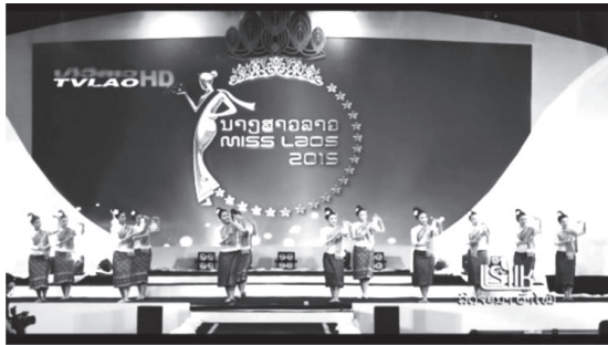
ภาพที่ 1 ฟ้อนพื้นเมือง ชูบตฟ้อนจำปาเมืองลาว งานประกวดนางสาวลาว พ.ศ. 2558

สาธารณรัฐประชาธิปไตยประชาชนลาว การจัดงานดอง(งานแต่งงาน) ตลอดจนการจัดงานรื่นเริงงานบันเทิง เพื่อให้เกิดการซื้อขายผลิตภัณฑ์นั้น ซึ่งส่วนหนึ่งของการจัดงานในบางครั้ง ได้มีการแสดงนาฏยศิลป์เข้าไปเป็นส่วนประกอบอยู่ภายในงานด้วย จึงทำให้เกิดธุรกิจมาอีกประเภทหนึ่งขึ้นมาคือ ธุรกิจการแสดงนาฏยศิลป์ สาธารณรัฐประชาธิปไตยประชาชนลาว ทำให้เกิดความหลากหลายของการแสดงในนครหลวงเวียงจันทน์ ซึ่งเป็นเมืองหลวงของประเทศ การรับวัฒนธรรมการเต้นแบบตะวันตกเข้ามาผสมผสานกับการแสดง เพื่อให้เกิดความทันสมัย ความร่วมสมัยของการแสดงนาฏยศิลป์กับธุรกิจการแสดงในงานจัดกิจกรรมส่งเสริมการขายให้มีความแปลกใหม่ โดยมีวิธีการออกแบบแนวคิดเกี่ยวกับการแสดง ประเภทของการแสดง ให้ตรงกับรูปแบบของการจัดงาน รวมไปถึงสถานที่ในการจัดงาน