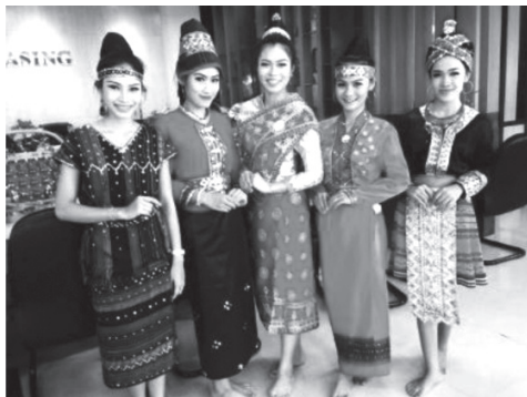
ภาพที่ 3 ฟ้อนเผ่าลาวส้มพันธ์