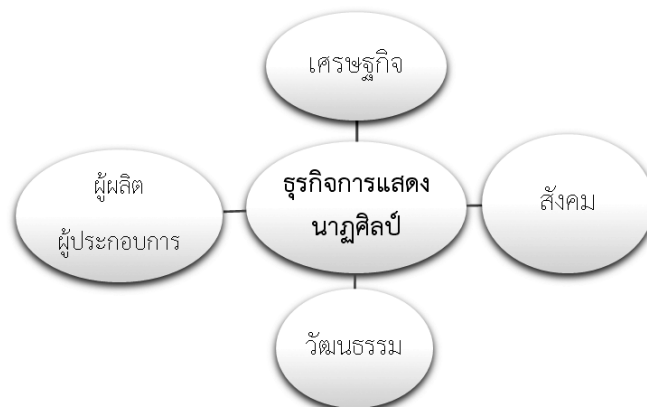
ภาพที่ 8 ตารางประเภทการแสดงนาฏศิลป์ ในนครหลวงเวียงจันทน์

พัฒนาเชียร์ลีดเดอร์ให้เป็นกีฬาส่งเสริมเยาวชนวัยรุ่นหนุ่มสาวชาวลาวหันมาเล่นกีฬาใช้เวลาว่างให้เกิดประโยชน์ การรับวัฒนธรรมการเต้นเชียร์ลีดเดอร์มาจากทางตะวันตกเต็มรูปแบบ ซึ่งเป็นเรื่องยากที่ชาวลาวยุคใหม่จะเข้าใจ ในการแสดงประเภทนี้จึงได้มีการกำหนดกฎเกณฑ์การแข่งขัน โดยได้เชิญครูฝึกจากประเทศเพื่อนบ้านเข้ามา เป็นผู้กำกับดูแลความถูกต้องของการเต้นประเภทนี้ และทำความเข้าใจในรูปแบบของการเต้นรวมถึงเครื่อง แต่งกาย ในช่วงแรกที่ได้มีการนำเชียร์ลีดเดอร์เข้ามาในปี พ.ศ.2555 เป็นครั้งแรกครั้งนั้นการเครื่องแต่งกายมี ขีดจำกัดทางด้านวัฒนธรรมการแต่งกายของชาวลาวยุคใหม่ไม่ทันสมัยและเบ้าเจนนินไปการไม่ให้เกิดโดดลอดข้ามศีรษะ การนั่งคร่อมศีรษะ การถูกเนื้อต้องตัวกันระหว่างชายหญิง ต่อมาได้มีการให้ความรู้ให้เข้าใจเกี่ยวกับการแสดงประเภทเชียร์ลีดเดอร์นี้ เพื่อให้พัฒนาก้าวไปสู่มาตรฐานระดับสากล เพื่อทัดเทียมกับนานาชาติ ประการ แข่งขันระดับนานาชาติ จึงกำหนดให้เป็นกีฬาเชียร์ลีดเดอร์ขึ้น การเต้น การต่อตัว การโยนตัว ท่าทาง ลีลาการแสดง เครื่องแต่งกาย เพื่อให้ทัดเทียมในระดับนานาชาติ การแสดงนาฏศิลป์ที่คิดขึ้นมาใหม่ให้เข้า กับรูปแบบของการจัดงานส่งเสริมการขายในแต่ละงาน การใช้เทคนิคแสง สี เสียง เครื่องแต่งกาย ประกอบ เสียงดนตรีรวมไปถึงการใช้เทคนิคเอฟเฟ็คเพื่อให้เกิดความตื่นตาตื่นใจในการจัดงานเพื่อให้เกิดความประทับใจ เพื่อให้เข้ากับยุคสมัยที่มีการพัฒนาตลอดเวลา ตอบสนองความต้องการของกลุ่มลูกค้า ผู้ว่าจ้างงาน สร้างรายได้ เกิดอาชีพในชุมชน เกิดการเรียนรู้พัฒนาของหนุ่มสาวชาวลาวยุคใหม่