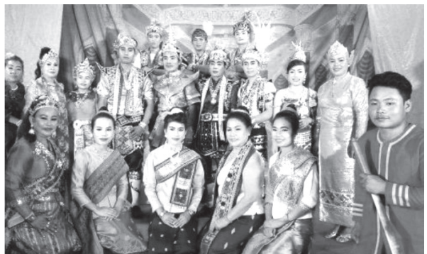
ภาพที่ 4 การแสดงหมอลำ ลำเรื่อง สังข์สินชัย

สิ่งที่กล่าวมานี้ทำให้เกิดกระบวนการเปลี่ยนแปลงสถานภาพ ประเภทของการแสดงนาฏยศิลป์ ในนครหลวงเวียงจันทน์ สาธารณรัฐประชาธิปไตยประชาชนลาว เกิดรูปแบบการแสดงที่เปลี่ยนไป มีทั้งแบบฟ้อนดั้งเดิม การฟ้อนปรับปรุงขึ้นมาใหม่โดยอยู่ในพื้นฐานของการฟ้อนแบบเดิม การฟ้อนที่คิดสร้างสรรค์ใหม่