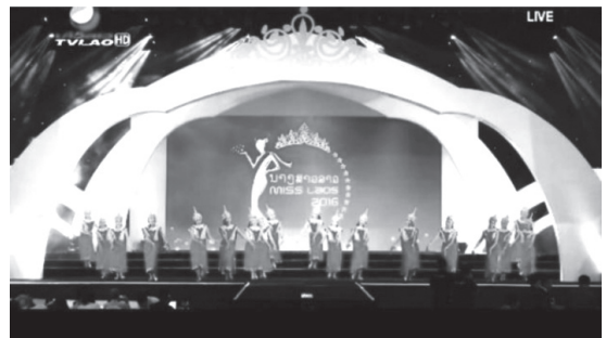
ภาพที่ 2 ฟ้อนสาวลานล้านช้าง งานประกวดนางสาวลาว พ.ศ. 2559