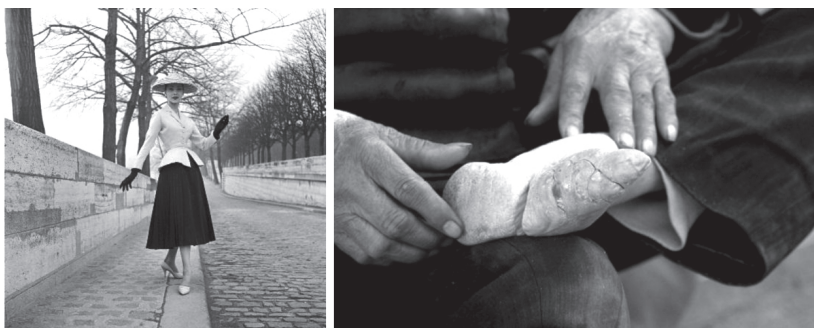
ภาพประกอบ: (ภาพซ้าย) The Bar Suit ออกแบบโดยคริสเตียน ดิออร์ ปี ค.ศ.1947

ในความสัมพันธ์อันชวนให้ขบคิดของระบบเศรษฐกิจที่มีผลกับร่างกายและการตกอยู่ภายใต้อำนาจบงการที่คลั่งไคล้กับการควบคุมร่างกายของตนเช่นนี้ ที่ทำให้เครื่องแต่งกายและร่างกายในลักษณะของโครงสร้างทางกายภาพแบบแยกส่วนและแยกองค์ประกอบถูกแฟชั่นแบบ Fetish นำมา “เล่น” กับการสร้างความหมายใหม่ เราพบว่า คริสเตียน ดิออร์ (Christian Dior) เป็นดีไซเนอร์คนสำคัญในช่วงทศวรรษ 1940-50 ที่หยิบเอาทรวดทรงผู้หญิงที่เกิดจาก คอร์เซ็ตและครีโนลีน มาทำให้เกิดความสำคัญในยุคที่ยุโรปจำเป็นต้องฟื้นตัวทางเศรษฐกิจหลังจากสงครามโลกครั้งที่ 2 ร่างกายที่ถูกควบคุมได้ทำหน้าที่แยกตัวเองออกจากรูปแบบของเครื่องแต่งกายยุคก่อนหน้าที่หลวมกว่าและมีรูปทรงที่ปล่อยสบายกว่า ในความสัมพันธ์แบบนาย/บ่าวและนายทุน/แรงงาน ผลงานการออกแบบของดิออร์สร้างนิยามใหม่ของร่างกายชั้นสูงให้เกิดขึ้นกับแฟชั่นสตรีและทำให้ร่างกายรัดรูปกลายเป็นโครงสร้างอุดมคติที่สัมพันธ์กับอำนาจและชนชั้นนายทุน ขณะที่รูปทรงหลวมๆของเสื้อผ้ายุคก่อนหน้าตกเป็นสัญลักษณ์ของชนชั้นล่างและผู้ใช้แรงงาน