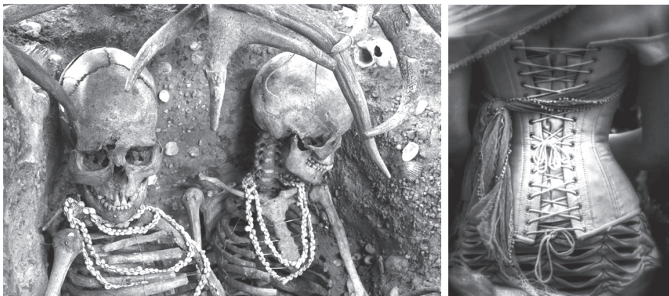
ภาพประกอบ: (ภาพซ้าย) โครงกระดูกมนุษย์ยุคหินกลางที่ถูกฝังพร้อมกับสร้อยคอทำมาจากเปลือกหอยพบที่เกาะ T_viec ประเทศฝรั่งเศส และ (ภาพขวา) การรัด Corset ของสตรีในสมัยคริสต์ศตวรรษที่ 19

การให้คุณค่าใหม่กับวัตถุอย่างที่มีความสัมพันธ์กับจิตใจมากจนถึงขั้นของการสร้างให้วัตถุนั้นเป็นดัง “สิ่งของที่ต้องปรารถนา” นี้เอง ที่มีส่วนทำให้ มนุษย์ตกเป็น “ทาสของวัตถุ” เราเริ่มรู้สึกผูกพันจนเข้าสู่สภาวะของการหลงรักในวัตถุนั้น เริ่มต้นด้วยการชื่นชมรูปลักษณะภายนอกของมันก่อนที่จะเพิ่มคุณค่าให้กับวัตถุนั้นผ่านสุนทรียะที่ปรกฏ และเมื่อวัตถุดำรงความสำคัญกับมนุษย์มากจนถึงระดับที่ก้าวล้ำเข้าไปสู่ขอบเขตของความพึงพอใจทางเพศ สิ่งของต้องปรารถนาที่เราหลงใหลจึงกลายเป็นวัตถุที่ถูกใช้เพื่อกระตุ้นเร้าความรู้สึกทางเพศและทดแทนสภาวะของความขาดให้สมบูรณ์ได้