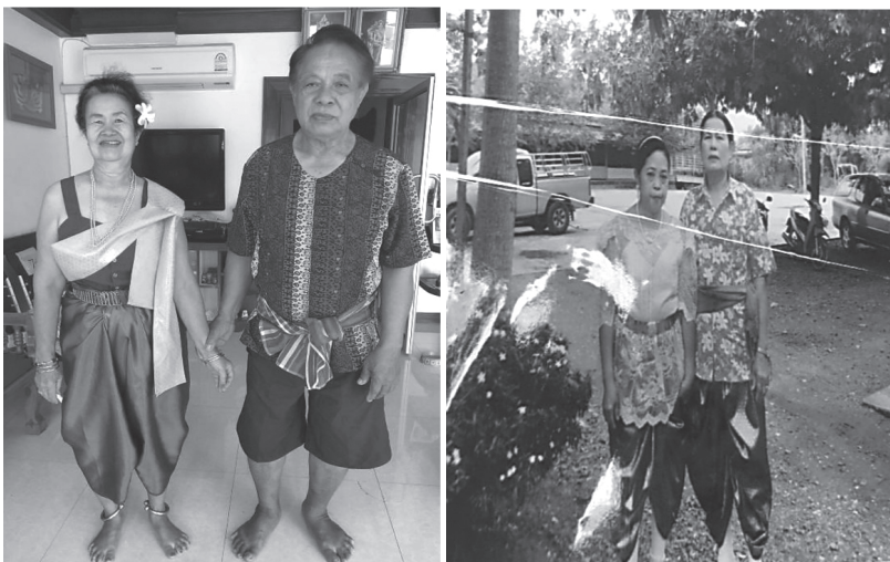
ที่มา สุวีร์รัตน์ จันทพงษ์. 2559

2. ผู้แสดงหญิง สวมเสื้อห้าตะเข็บหรือเสื้อปาน้อย เสื้อแขนกระบอก เสื้อลูกไม้ ห่มผ้าสไบพาดไหลข้างซ้ายห้อยชายทั้งข้างหน้าและข้างหลังนุ่งโจงกระเบนพื้น คาดทับด้วยเข็มขัดเงิน สวมกำไลข้อมือ ข้อเท้า สร้อยคอที่ทำด้วยเงิน ทัดดอกไม้เหนือหูข้างซ้าย เครื่องประดับนอกจากเป็นเครื่องหมายแสดงฐานะแล้ว ยังมี ความหมายอย่างอื่นอีกด้วย เช่น กำไลข้อเท้าเป็นสัญลักษณ์ของพรหมจารี หมายถึงหญิงที่ยังไม่ได้แต่งงาน หรือแสดงค่านิยมของชุมชน เป็นต้น