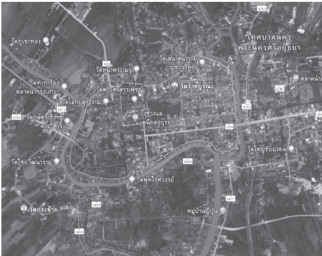
ภาพที่ 7 แผนผังแสดงการกระจายตัวของวัด ที่มีเจดีย์ทรงระฆังแบบมีชุดรองรับองค์ระฆังอยู่ในผังแปดเหลี่ยม

เมื่อผู้ศึกษาได้ตรวจสอบกลุ่มวัดบริเวณเกาะเมืองพระนครศรีอยุธยา ที่มีเจดีย์ทรงระฆังซึ่งมีชุดฐานรองรับองค์ระฆังในผังแปดเหลี่ยมอยู่ภายในวัด พบว่า ส่วนใหญ่วัดเหล่านี้จะตั้งอยู่ใกล้ๆ กันเป็นกลุ่มอยู่เสมอเท่าที่ผู้ศึกษาสามารถจำแนกได้มีอยู่ทั้งหมด 3 กลุ่มด้วยกัน ได้แก่ กลุ่มภายในเกาะเมือง (วัดราชบูรณะ, วัดชุมแสง, วัดหลังคาขาว, วัดหลังคาดำ, วัดธรรมิกราช, วัดสุวรรณาวาส) กลุ่มนอกเกาะเมืองด้านทิศเหนือ (วัดหัตถาวาส, วัดตะไกร, วัดจงกลม, วัดชะราม) และกลุ่มนอกเกาะเมืองด้านทิศตะวันออก (วัดใหญ่ชัยมงคล, วัดสามปลื้ม, วัดนางคำ, วัดโยธยา) ส่วนวัดกระซ่าย เป็นวัดเดียวที่แยกออกมาตั้งอยู่อย่างโดดๆ ที่นอกเกาะเมืองด้านทิศตะวันตกเฉียงใต้ ไม่มีวัดอื่นที่มีเจดีย์ลักษณะเดียวกันอยู่ในบริเวณใกล้เคียง ทำให้เกิดประเด็นว่า วัดแห่งนี้มีความพิเศษอย่างไร จึงได้แยกออกมาตั้งอยู่เพียงวัดเดียวเช่นนี้ แต่เนื่องจากในปัจจุบัน ยังไม่มีหลักฐานใดที่จะมาช่วยบ่งชี้เกี่ยวกับประเด็นนี้ได้ จึงยังไม่อาจสรุปได้อย่างแน่ชัด