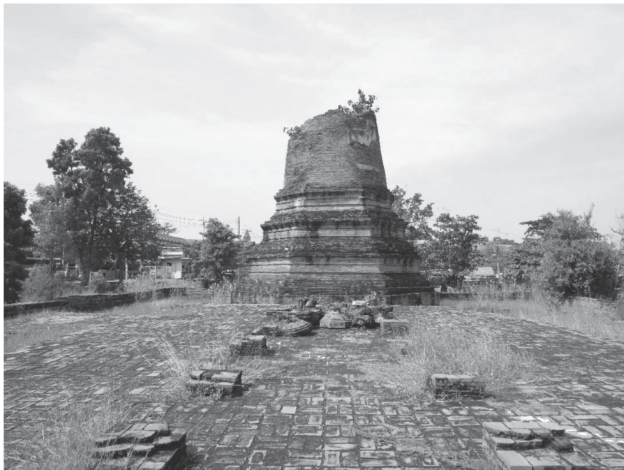
ภาพที่ 6 เจดีย์ประธานวัดห้วยดาวาส อยุรยา