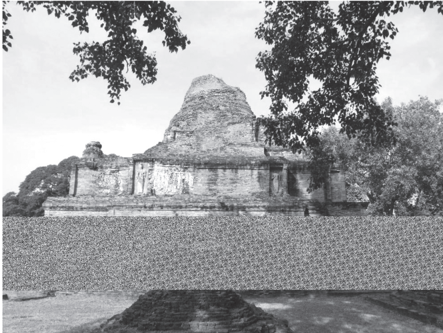
ภาพที่ 5 เจดีย์ประธานวัดขุนเมืองใจ อยุรยา