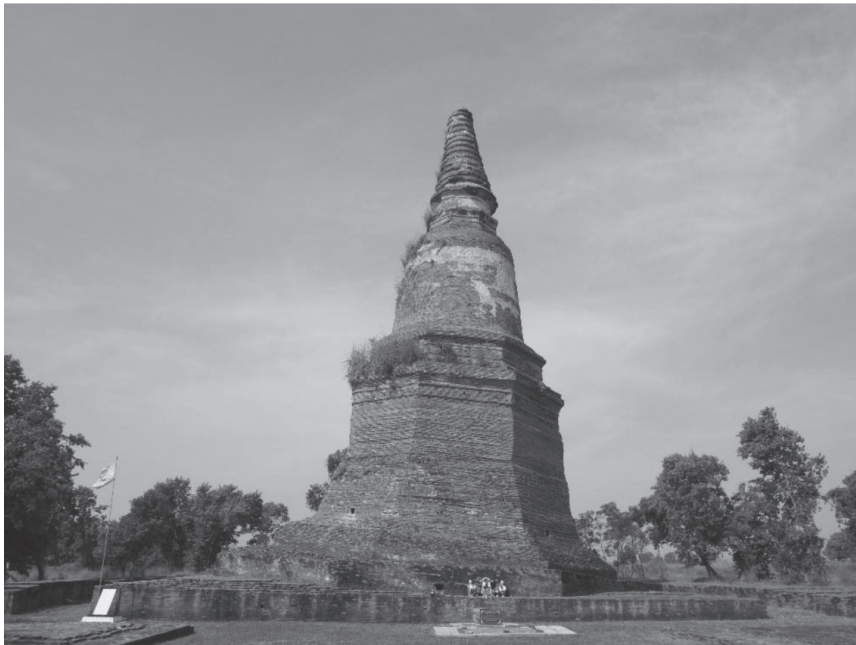
ภาพที่ 3 เจดีย์ประธานวัดกระซ่าย

เจดีย์ทรงระฆังที่มีชุดฐานรองรับองค์ระฆังในผังแปดเหลี่ยมนี้ เป็นรูปแบบที่นิยมสร้างในสมัยอยุธยาตอนต้น สันนิษฐานว่ามีวิวัฒนาการมาจากเจดีย์ทรงปราสาทหยอดที่มีเรือนธาตุ 2 ชั้น ชั้นล่างเป็นเรือนธาตุในผังสี่เหลี่ยม มุมหลังคาประดับสถูปจำลอง ส่วนชั้นบนเป็นเรือนธาตุในผังแปดเหลี่ยม ตัวอย่างเช่นเจดีย์ที่วัด