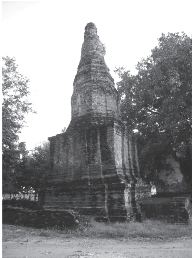
ภาพที่ 4 เจดีย์ทรงปราสาทที่ยอดที่มีเรือนธาตุ 2 ชั้น ที่วัดพระรูป สุพรรณบุรี

พระแก้ว สวรรคบุรี และวัดพระรูป สุพรรณบุรี ซึ่งมีอายุอยู่ในช่วงราวพุทธศตวรรษที่ 19-20 (สันติ เล็กสุขุม, 2544, น.78) เจดีย์ลักษณะนี้มีการแพร่กระจายอยู่ในวัฒนธรรมธรรมสารบุรี-สุพรรณบุรี มีวิวัฒนาการลดรูปลงเรื่อยๆ ก่อนจะลงมายังอยุธยาในลักษณะของเจดีย์ทรงปราสาทที่ยอดที่เหลือเพียงส่วนเรือนธาตุชั้นล่าง ส่วนเรือนธาตุชั้นบนถูกลดรูปจนกลายเป็นฐานบัวรองรับองค์ระฆังในผังแปดเหลี่ยม เช่น เจดีย์ประธานวัดขุนเมืองใจ วัดอโยธยา และวัดใหญ่ชัยมงคล (สันติ เล็กสุขุม, 2544, น.82)