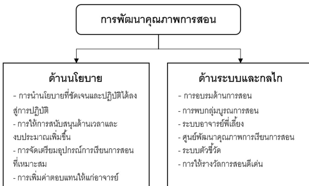
รูปภาพที่ 1 แผนภาพการพัฒนาคุณภาพการสอน(Thupa-ang. 2015: 149)

กล่าวโดยสรุปคำตอบของคำถามวิจัยที่ 2 นี้ประกอบไปด้วย 2 ด้านใหญ่คือ ด้านนโยบาย และ ด้านระบบและกลไก ซึ่งจะต้องใช้ร่วมกันในการพัฒนาคุณภาพการสอน อย่างไรก็ตามอาจกล่าวได้ว่า ปัจจุบันการอุดมศึกษาไทยมีเพียงระบบตัวชี้วัด (Performance indicator system) เท่านั้นที่ใช้กันอย่างแพร่หลายในการพัฒนาคุณภาพการสอนของการอุดมศึกษาไทย จากข้อเสนอแนะของอาจารย์มหาวิทยาลัยทั้งหมด 10 ข้อ (4 ด้านนโยบาย และ 6 ด้านระบบและกลไก) และเมื่อกล่าวถึงคุณภาพการสอนคงเป็นเรื่องยากที่จะไม่กล่าวถึงการประกันคุณภาพการศึกษา เนื่องจากเป็นสิ่งสำคัญในระบบการบริหารจัดการคุณภาพของมหาวิทยาลัยในปัจจุบัน ซึ่งเป็นคำถามวิจัยข้อต่อไป