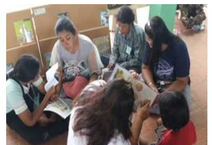
ภาพประกอบ 6 กิจกรรมระดับครอบครัว