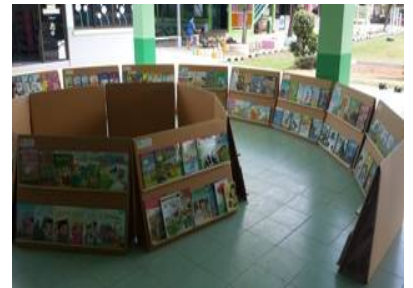
ภาพประกอบที่ 3 ผลงานกิจกรรมระดับโรงเรียน