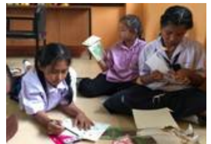
ภาพประกอบ 5 ผลงานกิจกรรมระดับนักเรียน