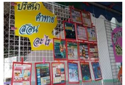
ภาพประกอบที่ 4 ผลงานกิจกรรมระดับห้องเรียน