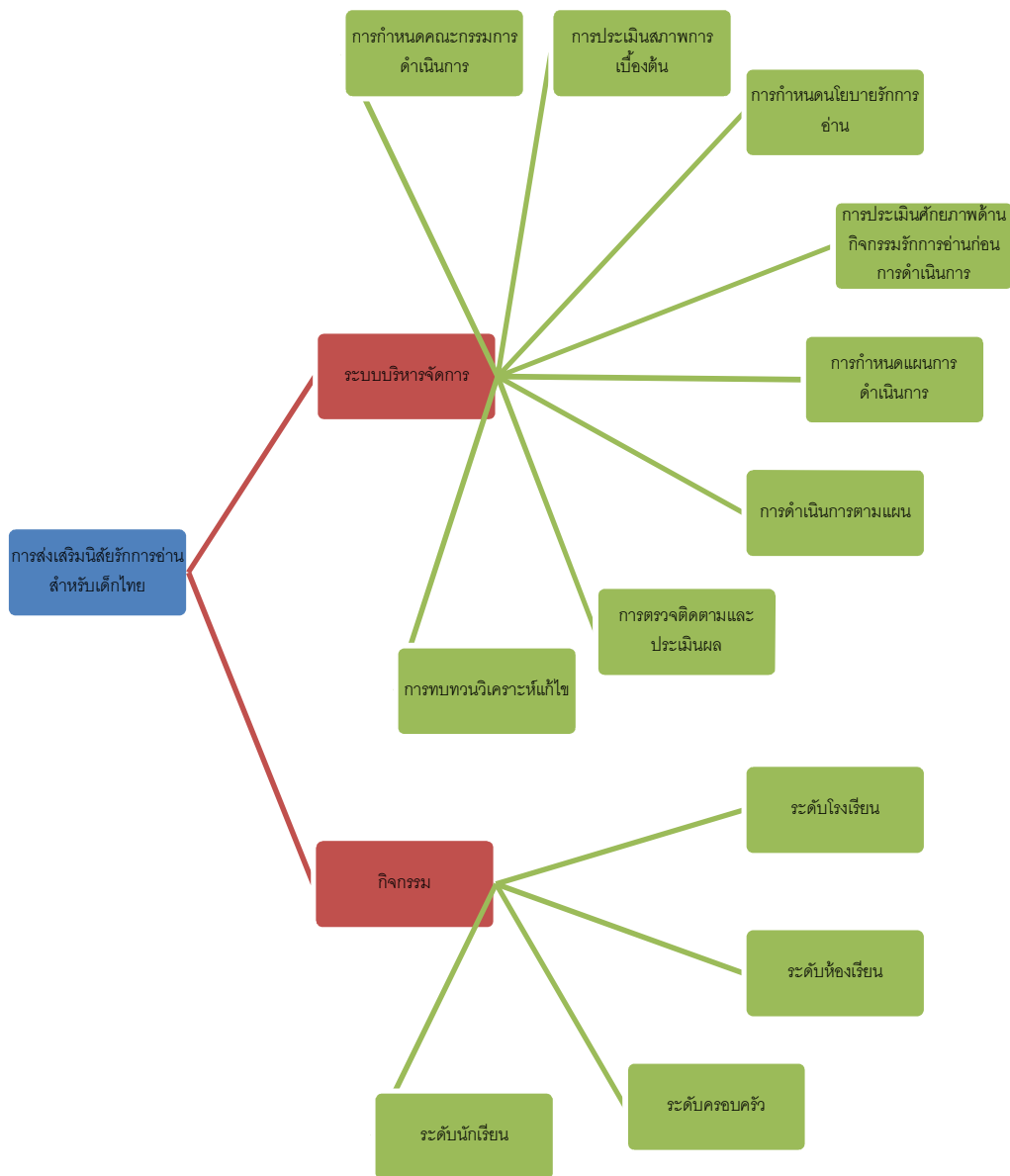
ภาพประกอบ 2 การเสริมสร้างนิสัยรักการอ่านสำหรับเด็กไทย

ตอนที่ 2 การดำเนินการใช้ระบบบริหารจัดการ และกิจกรรมส่งเสริมนิสัยรักการอ่าน