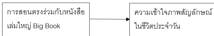
ภาพที่ 1 แสดงกรอบแนวคิดในการวิจัย