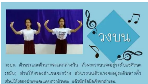
ลักษณะการตั้งวงบน