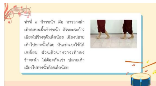
ลักษณะการก้าวหน้า