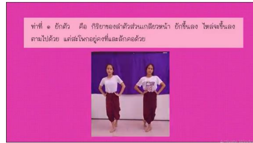
ลักษณะการปฏิบัติท่ายกตัว

ชุดที่ 5 การเคลื่อนไหวด้วยภาษาท่า โดยในชุดกิจกรรมมีความหมายและขั้นตอนการปฏิบัติอย่างละเอียดเป็นขั้นตอน ดังตัวอย่าง