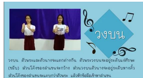
ขั้นตอนการปฏิบัติวงบน

ชุดที่ 3 ลักษณะการเคลื่อนไหวด้วยเท้า โดยในชุดกิจกรรมมีความหมายและขั้นตอนการปฏิบัติอย่างละเอียดเป็นขั้นตอน ดังตัวอย่าง