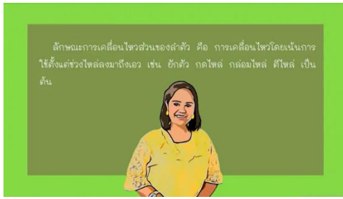
ความหมายของการเคลื่อนไหวส่วนลำตัว

ชุดที่ 4 ลักษณะการเคลื่อนไหวส่วนของลำตัว โดยในชุดกิจกรรมมีความหมายและขั้นตอนการปฏิบัติอย่างละเอียดเป็นขั้นตอน ดังตัวอย่าง