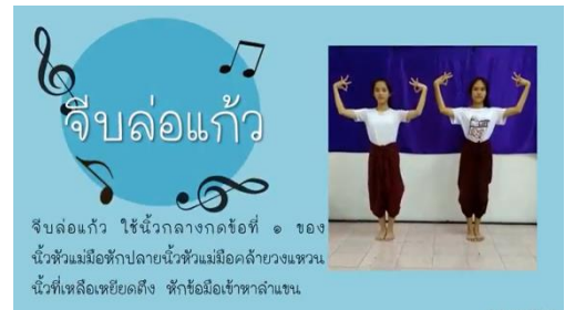
ลักษณะการจับล่อแก้ว