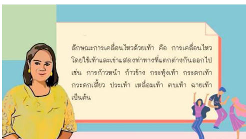
ความหมายของการเคลื่อนไหวด้วยเท้า

ชุดที่ 3 ลักษณะการเคลื่อนไหวด้วยเท้า โดยในชุดกิจกรรมมีความหมายและขั้นตอนการปฏิบัติอย่างละเอียดเป็นขั้นตอน ดังตัวอย่าง