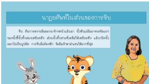
ความหมายของการจับ

ชุดที่ 2 ลักษณะมือจับและการตั้งวง โดยในชุดกิจกรรมมีความหมายและขั้นตอนการปฏิบัติอย่างละเอียดเป็นขั้นตอน ดังตัวอย่าง