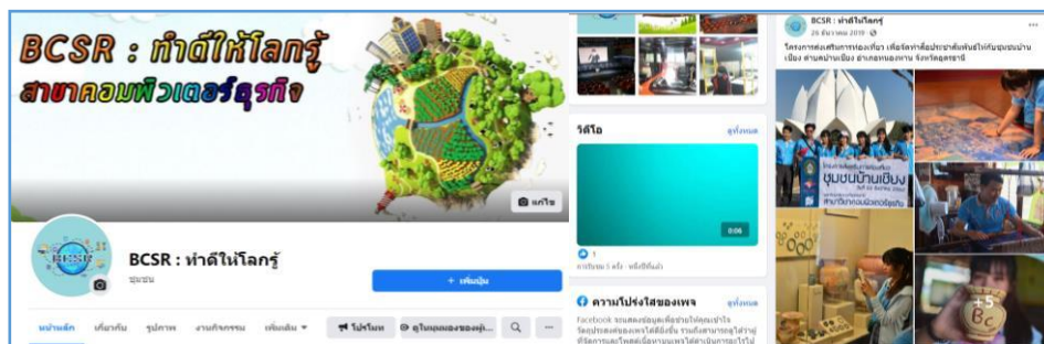
ภาพที่ 3 เพจ BCSR สำหรับงานประชาสัมพันธ์โครงการบริการวิชาการแก่สังคม

การประยุกต์ใช้เทคโนโลยีสารสนเทศ โดยได้สร้างเพจเฟซบุ๊ก ในชื่อ BCSR: ทำดีให้โลกรู้ เป็นเครื่องมือสนับสนุนการประชาสัมพันธ์โครงการ เพื่อเผยแพร่ผลงานการบริการวิชาการแก่สังคม โดยตัวแทนนักศึกษาจะเป็นผู้ดำเนินการจัดการเพจด้วยตนเอง