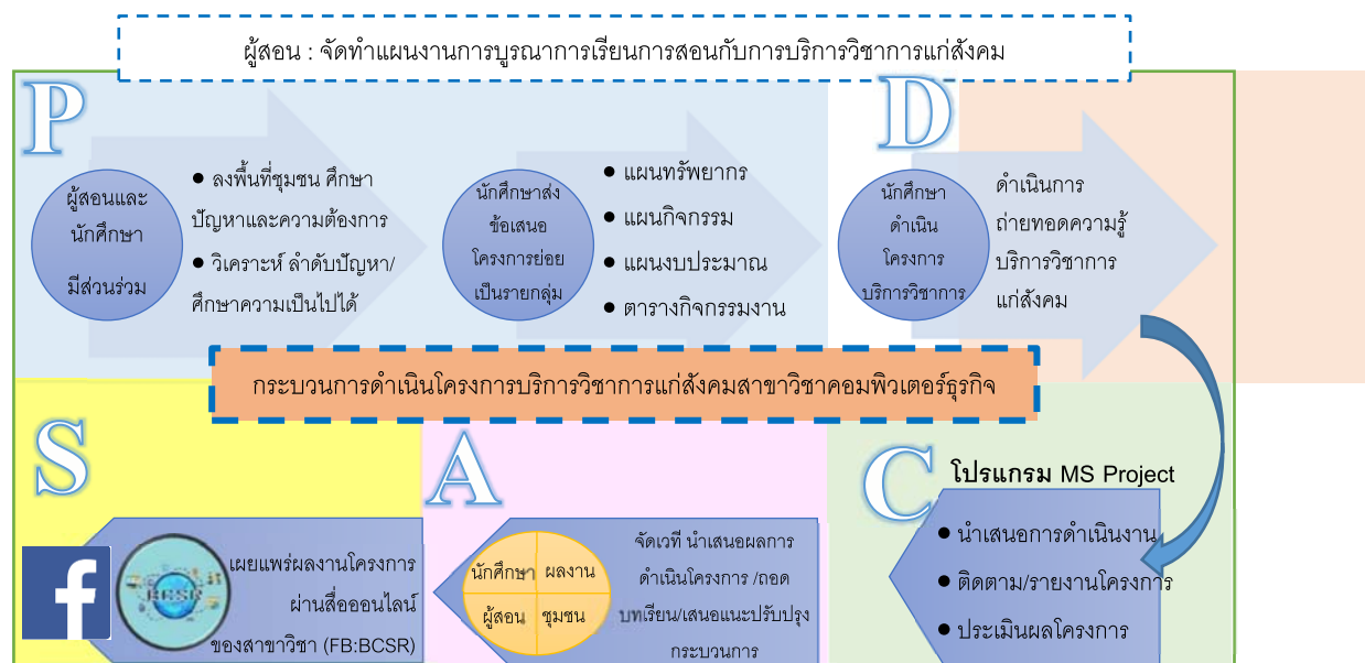
ภาพที่ 2 กระบวนการดำเนินงานโครงการบริการวิชาการแก่สังคม ของสาขาวิชาคอมพิวเตอร์ธุรกิจ

ผลการสังเคราะห์และออกแบบกระบวนการจัดการเรียนการสอนแบบบูรณาการกับโครงการบริการ วิชาการแก่สังคมดังนี้