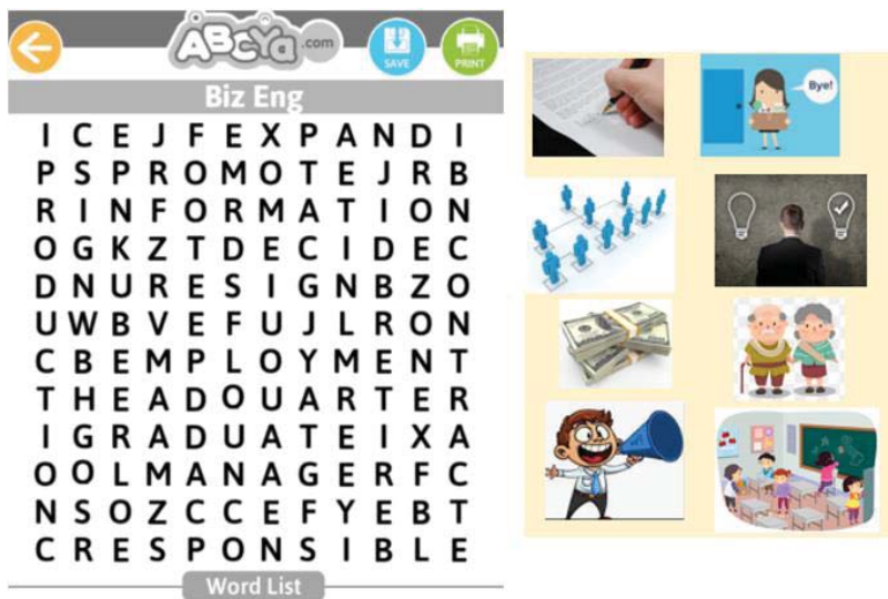
ภาพที่ 2 แสดงตัวอย่าง word search game

- เมื่อได้คำที่ซ่อนอยู่ในเกมแล้วให้สมาชิกทุกคนในกลุ่มสามารถช่วยกันหาความหมายของคำจากรูปภาพที่กำหนดให้ในเกม จัดว่าเป็นวิธีที่ส่งเสริมให้ผู้เรียนมีส่วนร่วมและเกิดการเรียนรู้ได้เป็นอย่างดี