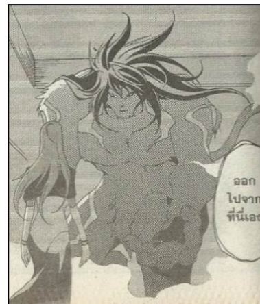
ภาพที่ 8 ลิงลมในการ์ตูนสิงห์ไกรภพ ที่มา : ภาณุ ลีลีสาย. (2553). สิงห์ไกรภพ Lion Heart Chronicle เล่ม 8. กรุงเทพฯ: สยามอินเตอร์คอมิกส์. หน้า 118.