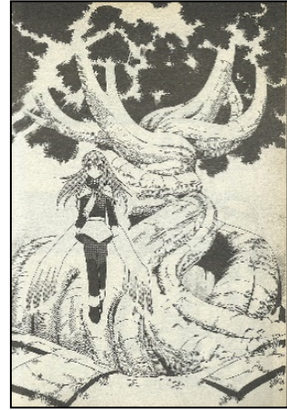
ภาพที่ 7 ต้นสรรรพยา ที่มา : ภาณุ ลีลีสาย. (2551). สิงห์ไกรภพ Lion Heart Chronicle เล่ม 4. กรุงเทพฯ: สยามอินเตอร์คอมิกส์. หน้า 123.

สร้างขึ้นใหม่มีลักษณะของตัวละครในแบบฉบับการ์ตูนญี่ปุ่นที่มักสร้างตัวละครครึ่งมนุษย์ครึ่งสัตว์ให้มีร่างกายเหมือนมนุษย์ เช่น ลิงลม ที่มีการสร้างให้มีร่างกายและกล้ามเนื้อเหมือนกับมนุษย์ แต่มีขนปกคลุมร่างกายและใบหน้าเหมือนลิง ดังภาพ