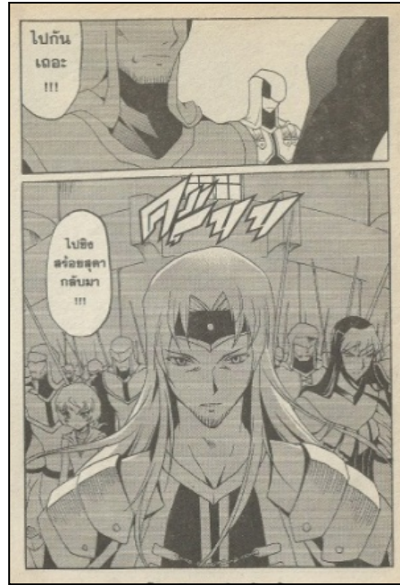
ภาพที่ 4 ท้าวจตุพักตร์และกองทัพยก ที่มา : ภาณุ ลีลีสาย. (2553). สิงห์ไกรภพ Lion Heart Chronicle เล่ม 9. กรุงเทพฯ: สยามอินเตอร์คอมิกส์. หน้า 179.

จุดเริ่มต้นของสงครามครั้งที่ 2 คือท้าวจตุ พักตร์ไกรธแคนที่สิงห์ไกรภพพานางสร้อยสุดาผู้เป็นธิดา ของตนหนีไป ดึงในตัวอย่างที่ทำวजूพักตร์รวบรวม ทหารเพื่อบุกไปชิงตัวสร้อยสุดา ดังนี้