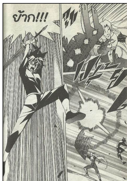
ภาพที่ 1 สิ่งไกรภพต่อสู้กับท้าวจตุพักตร์

ในการตุนสิ่งไกรภพ การต่อสู้ครั้งสุดท้าย ระหว่างสิ่งไกรภพและอวตารที่อาศัยอยู่ในร่างของท้าว จตุพักตร์เป็นการต่อสู้ที่สำคัญที่สุด การต่อสู้ครั้งนี้ สิ่งไกรภพต่อสู้ด้วยดาบเพชรเจ็ดสี และเนื่องจากเป็น การตุนแนวแอคชั่น (Action) ผู้เขียนให้ความสำคัญกับ ฉากต่อสู้จึงเพิ่มรายละเอียดในการสู้ทำให้เนื้อหาของ ตอนต่อสู้ยืดยาว เห็นได้จากตอนที่สิ่งไกรภพสู้กับท้าว จตุพักตร์ในช่วงแรกที่สิ่งไกรภพใช้ดาบเพชรเจ็ดสีใน การต่อสู้ สิ่งไกรภพได้เปลี่ยนมาสู้ด้วยพลังกำลังของ ตน ผู้เขียนเพิ่มรายละเอียดการต่อสู้ให้รุนแรงขึ้นโดยให้ ตัวละครขึ้นไปต่อสู้บนอวกาศ เพื่อให้ได้ภาพการต่อสู้ที่ เห็นจริง ดังภาพ