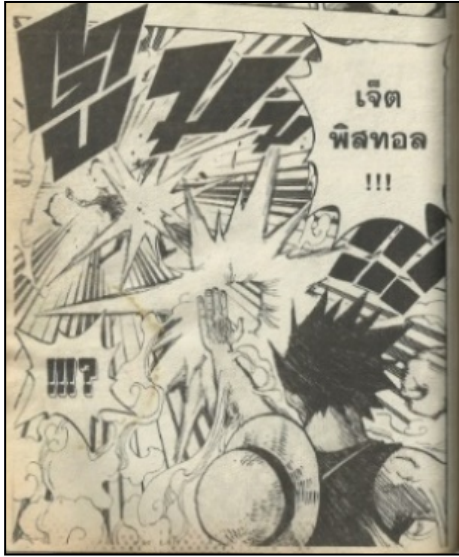
ภาพที่ 2 การต่อสู้โดยปล่อยพลังจากฝ่ามือ ในการ์ตูนญี่ปุ่น