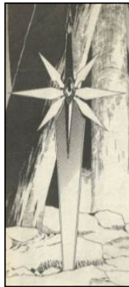
ภาพที่ 9 ดาบเพชรเจ็ดสี อาวุธของสิงห์ไกรภพ ที่มา : ภาณุ ลีลือสาย. (2553). สิงห์ไกรภพ Lion Heart Chronicle เล่ม 10. กรุงเทพฯ: สยามอินเตอร์ คอมิกส์. หน้า 72.

พระขรรค์ แม้ว่าจะป็นอาวุธที่มีความสามารถเหนือดาบทั่วไป จัดอยู่ในกลุ่มของวิเศษที่เป็นแฟนตาซี (Fantasy) แต่ก็เป็นที่รู้จักของคนในปัจจุบันมากนัก ผู้เขียนจึงได้เปลี่ยนรูปแบบอาวุธจากพระขรรค์เป็น “ดาบเพชรเจ็ดสี” ที่รูปร่างโดยรวมคือดาบและเพิ่มความเป็นแฟนตาซี (Fantasy) เข้าไปในด้ามจับให้มีลักษณะโดดเด่นและแตกต่างจากดาบทั่วไปดังภาพ