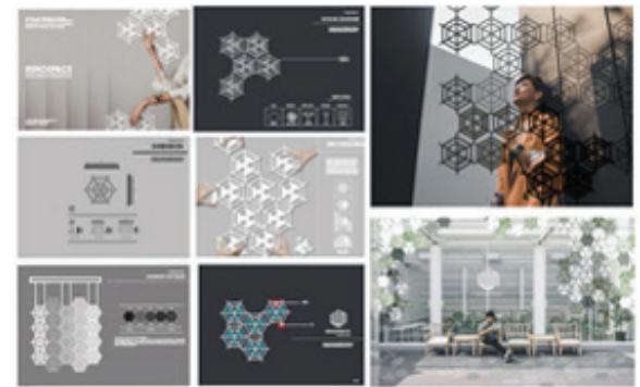
ภาพประกอบ 1 ภาพรวมของการออกแบบผลิตภัณฑ์ ตกแต่งภายในระบบโมดูลาร์

5) การใช้งาน และประโยชน์ใช้สอยผลจากการวิจัยชี้ว่า การจัดวางองค์ประกอบด้วยการแขวน เหมาะสมที่จะนำมา เป็นกระบวนการในการใช้งานผลิตภัณฑ์มากที่สุด เนื่องจาก สามารถจัดสรรพื้นที่ได้อย่างมีประสิทธิภาพ สะดวกต่อ การใช้งาน ไม่ทำให้เสียพื้นที่ในส่วนบริเวณทางเดิน และ จะไม่ทำให้โครงสร้างเสียหาย หรือ ชยับเปลี่ยนทิศทาง เมื่อเกิดแรงมากระทบ จากคุณสมบัติข้างต้นจึงทำให้ผู้วิจัย เลือกการใช้งานดังกล่าวมาเป็นวิธีการใช้งานผลิตภัณฑ์ตกแต่ง ภายในระบบโมดูลาร์สำหรับธุรกิจโฮสเทล