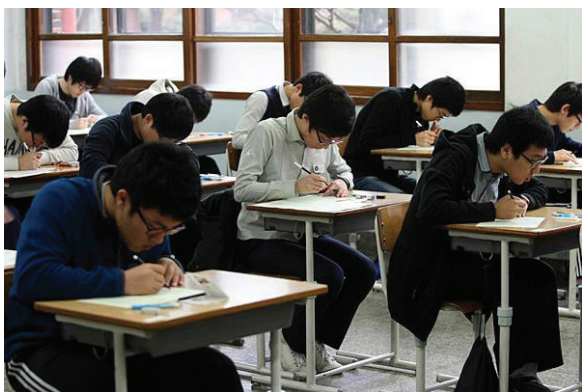
ภาพที่ 4 บรรยากาศการสอบแข่งขันเข้ามหาวิทยาลัยของคนเกาหลีใต้

ในการสอบแข่งขันเพื่อเข้ามหาวิทยาลัยจะมีนักเรียนที่เข้าเรียนในระดับมหาวิทยาลัยได้ราว 70 เปอร์เซ็นต์ แต่มีนักเรียนเพียง 2 เปอร์เซ็นต์เท่านั้นที่สามารถสอบเข้ามหาวิทยาลัยชั้นนำ 3 แห่ง ที่เรียกว่า SKY ได้ โดยคนเกาหลีมีความเชื่อว่า หากเรียนจบในมหาวิทยาลัยชั้นนำ ก็จะได้งานที่ดีก็จะเป็นหนทางในการเข้าทำงานในบริษัทยักษ์ใหญ่อย่าง แอลจี (LG) ฮุนได (Hyundai) เอสเค (SK) ล็อดเต้ (Lotte) และ ซัมซุง (Samsung) ซึ่งทำให้เป็นที่นับหน้าถือตาของคนในสังคมเกาหลีใต้ ซึ่งทุกๆปี หนังสือพิมพ์จะตีพิมพ์ว่ามีผู้พิพากษา ทนาย ผู้บริหารที่จบมาจากมหาวิทยาลัยชั้นนำจำนวนกี่คน ทำให้บรรดาผู้ปกครองและคนในสังคมเกาหลีใต้มีความเชื่อว่าหากสอบเข้ามหาวิทยาลัยชั้นนำได้ก็จะได้อะไรดีๆ ได้