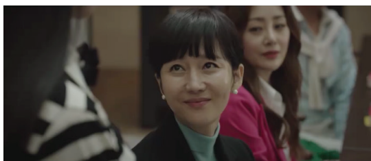
ภาพที่ 2 ตัวละครฮันซอจิน ตัวละครหลักของละครเรื่อง SKY Castle

ตัวละครหลักอย่างฮันซอจิน (รับบทโดย ยอมจองอา) ต้องการให้ลูกสาวคนโตชื่อว่าคังเยซอ (รับบทโดย คิมฮเยยุน) สอบเข้าคณะแพทยศาสตร์ มหาวิทยาลัยโซล เพื่อจะได้เป็นหมอรุ่นที่ 3 ของตระกูล อย่างพ่อตาและสามีของเธอ บวกกับความกดดันจากแม่ยายที่ห่วงภาพลักษณ์ของตระกูลจึงมากดดันลูกสะใภ้อย่างเธอให้ทำทุกวิถีทาง ฮันซอจินจึงพยายามขอความช่วยเหลือจากอิมยองจู (รับบทโดย คิมจองนาน) ที่สามารถทำให้ลูกชายสอบเข้าคณะแพทยศาสตร์ มหาวิทยาลัยโซลได้ แต่เธอก็กลับฆ่าตัวตายอย่างเป็นทางการ แต่ก็ไม่ได้ทำให้ฮันซอจินและบรรดาพ่อแม่ใน SKY Castle ลดละความพยายาม ยังคงยอมแลกทุกอย่างไม่ว่าจะเป็นเงินทองจำนวนมาก แม้กระทั่งศักดิ์ศรีของตนเอง