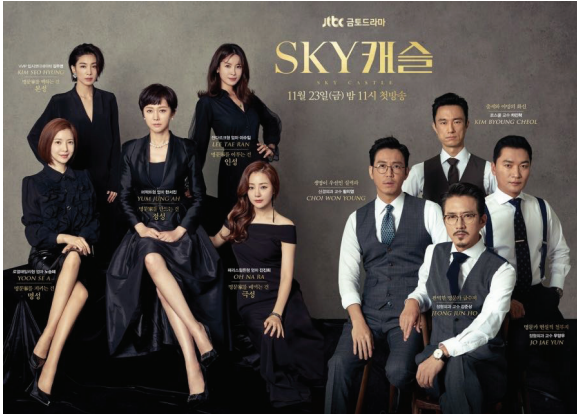
ภาพที่ 1 โปสเตอร์ละครโทรทัศน์เรื่อง SKY Castle เป็นภาพของตัวละครรุ่นพ่อแม่

SKY Castle จึงกลายเป็นชุมชนของเหล่าคนรวยที่มีความรู้จนทำให้เกิดความเชื่อและวัฒนธรรมบางอย่าง โดยเฉพาะเรื่องของการศึกษาของลูกตนเอง จึงทำให้ตัวละครในเรื่องพยายามทำทุกวิถีทางเพื่อไขว่คว้าโอกาสให้ลูกของตนเองกวาดวิชาหนักๆ จนไปถึงการจ้างโค้ชส่วนตัวเพื่อติวสอบให้ได้คะแนนสูงสุดในชั้นเรียน เพื่อให้เข้าเรียนในคณะแพทยศาสตร์ มหาวิทยาลัยโซลให้ได้ เพื่อในอนาคตจะได้เป็นที่นับหน้าถือตาและเป็นชื่อเสียงต่อวงศ์ตระกูล