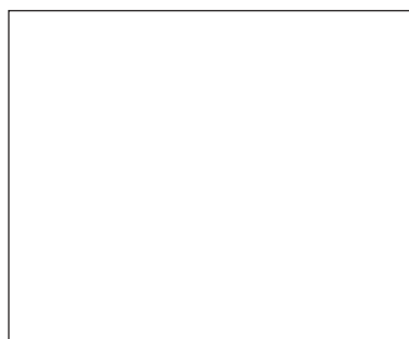
Eric Carle กับภรรยา

ผลงานของเขาผมถือเป็นแม่แบบในการสอนวิชาการเขียนเรื่องสำหรับเด็ก ประเภทบันเทิงคดีมีอยู่เรื่องหนึ่งที่มีความครบทุกประการสำหรับทฤษฎีการเขียนของนักวิชาการทั่วโลก คือ แก่นเรื่องชัดเจน โครงเรื่องต่อเนื่องไม่ซับซ้อนสำหรับเด็ก ตัวละครน่าสนใจและมีบทบาทเด่นชัดในแต่ละตัว ทั้งตัวเอก ตัวรอง และตัวประกอบ ฉากเวลาและสถานที่ที่มีบรรยากาศของภาพโดยไม่ต้องอธิบายอะไรเลย ทัศนคติต่อการมองเรื่องที่น่าเสนอให้กับเด็กสะท้อนส่งผ่านไปสู่อุปกรณ์นำเสนองานและน่าสนใจที่สายตาผ่านความคิดของอิริค คาร์ล นำเสนอต่อเด็กยิ่งใหญ่มาก เทคนิคและรูปแบบสไตล์เฉพาะตัว เขาเป็นปัจเจกโดยเฉพาะไม่มีใครเหมือนและไม่เหมือนใคร