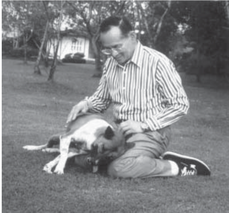
ความรักและความจงรักภักดีของทองแดงต่อพระบาทสมเด็จพระเจ้าอยู่หัว