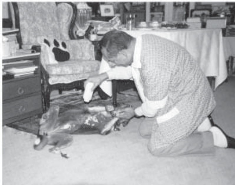
ทองแดงนอน “แอ้งแม้ง” ให้ทรงทาแป้งพระราชทาน

(ภาพจาก : หนังสือพระราชนิพนธ์ “เรื่องทองแดง-The Story of Tongdaeng”)