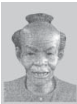
๕. แร้งกระพือปีก