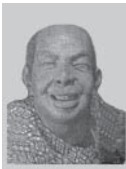
๒. ดงช้างข้าม