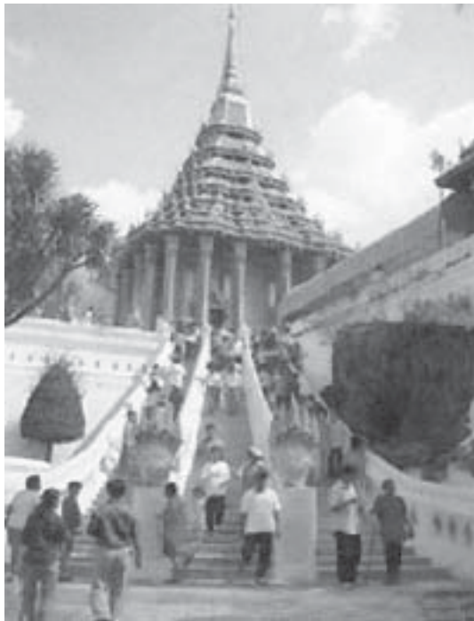
วัดพระพุทธรบาทราชวรมหาวิหาร อ.พุทธรบาท จ. สระบุรี สร้างในสมัยอยุธยา เมื่อ พ.ศ. ๒๑๖๗

สุนทรภู่อยู่ที่วัดพระพุทธรบาทได้สี่วัน พระองค์เจ้าปฐมวงศ์ก็เสด็จกลับกรุงเทพฯ สี่วันที่พระพุทธรบาทนั้น สุนทรภู่ได้เที่ยวชมธรรมชาติธารน้ำป่าเขาถ้ำคูหาต่างๆ ได้พบสมเด็จกรมพระปรมานุชิตชิโนรสโดยบังเอิญ ซึ่งเวลานั้นพระองค์ผนวชเป็นสามเณรซึ่งสุนทรภู่หลีกเลี่ยงจนตกเขา ดังบรรยายว่า “เจ้าเณรน้อยเสด็จมาดูน่ารัก พระกลดหัทธองขวางทางถวาย พี่เหลียวพบทลบทกลงเจียนตาย กระต่ายกลิ้งก้อนศิลาตาม”