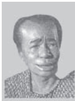
๓. ง่ามเทโพ