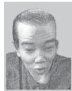
๔. ชะโดตีแปลง