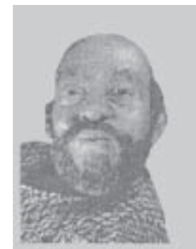
๗. ราชคสิงเครา (ราชคางเครา)