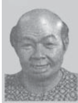
๑. พุ่งมหาหลง