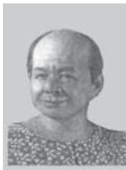
๖. นี๋ทางฟาด (นี๋ชวานฟาด)