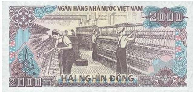
ภาพที่ 8 ธนบัตรด้านหลังมูลค่า 2,000 ด่งห์

ยุโรป ตุรกี บังกลาเทศ และอินเดียสิ่งทอและเครื่องนุ่งห่ม และคิดเป็นร้อยละ 10 ของ อุตสาหกรรมการผลิตทั้งหมด และมีอัตราการขยายตัวประมาณร้อยละ 17 ต่อปีในช่วง 10 ปีที่ผ่านมา (ข้อมูลจากกรมส่งเสริมการค้าระหว่างประเทศ กระทรวงพาณิชย์ : ค.ศ.2019) ซึ่งนับว่าเป็นอุตสาหกรรมขนาดใหญ่ที่สร้างรายได้ให้แก่คนเวียดนามอย่างมหาศาล และยังเป็นโรงงานอุตสาหกรรมที่มีการใช้แรงงานจากชนชั้นกรรมาชีพที่อาศัยอยู่บริเวณโดยรอบภูมิภาคแห่งนี้ เป็นการขยายขอบข่ายความเจริญออกไปให้ทั่วถึง สร้างอาชีพแก่ประชาชนในภูมิภาคต่าง ๆ เพื่อให้มีความเป็นอยู่ที่ดีขึ้น