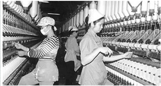
ภาพที่ 9 การทำงานในโรงงานอุตสาหกรรมทอผ้าไหมดีเยี่ยม

4. ภาพบนธนบัตร 5,000 ด่งห์ เป็นภาพโรงไฟฟ้าพลังน้ำจิอัน (Trị An) ซึ่งเป็นโรงงานไฟฟ้าพลังน้ำขนาดใหญ่ที่สุดในบริเวณภาคใต้ของประเทศเวียดนาม สร้างขึ้นบนแม่น้ำต่งนาย จังหวัดต่งนาย (Đông Nai) ทางตะวันออกเฉียงเหนือห่างจากเมืองโฮจิมินห์ประมาณ 65 กิโลเมตร โรงงานไฟฟ้าแห่งนี้ได้รับการสนับสนุนด้านการเงินและเทคโนโลยีจากสหภาพโซเวียตตั้งแต่ปี ค.ศ.1987 และได้เริ่มใช้งานครั้งแรกในปี ค.ศ.1988 โรงงานไฟฟ้าพลังงานน้ำจิอันแห่งนี้สามารถผลิตกระแสไฟได้มากถึง 1760 ล้านกิโลวัตต์ต่อปีและสามารถจ่ายกระแสไฟไปยังจังหวัดต่งนายและจังหวัดใกล้เคียงรวมถึงถึงมหานครโฮจิมินห์อีกด้วย (Tập Đoàn Điện Lực Việt Nam. 2016: ออนไลน์)