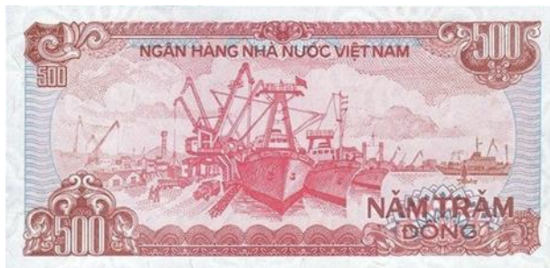
ภาพที่ 4 ด้านหลังธนบัตรมูลค่า 500 ด่งห์

โจมตีอย่างหนักจนได้รับความเสียหาย กระทั่งหลังสิ้นสุดสงครามเวียดนามในปี ค.ศ. 1975 รัฐบาลได้มีนโยบายฟื้นฟูประเทศจากสงคราม ทำเรือไฮฟองจึงได้รับการซ่อมแซมให้กลับมาใช้ได้อีกครั้งหนึ่ง จากนั้นก็ได้เริ่มก่อสร้างต่อเติมและขยายให้ทันสมัยมากขึ้น เพื่อรองรับการขนส่งสินค้าที่มีแนวโน้มเพิ่มขึ้นในอนาคต (สุมาลี สุขदानนท์. 2554: ออนไลน์) ปัจจุบันท่าเรือไฮฟองเป็นท่าเรือหลักและประตูการค้าของ 17 จังหวัดทางภาคเหนือที่มีความสำคัญอย่างมากต่อภาคเศรษฐกิจและการขนส่งสินค้าของประเทศเวียดนามตอนเหนือ โดยสามารถรองรับเรือระวางบรรทุกตั้งแต่ 7,000 -10,000 ตัน นับได้ว่าเป็นท่าเรือใหญ่เป็นอันดับ 2 ของประเทศและยังเป็นท่าเรือแห่งแรกในประวัติศาสตร์เวียดนามที่มีการขนส่งสินค้านำเข้าและส่งออกจำนวนมาก ส่งเสริมให้เกิดการลงทุนของภาคอุตสาหกรรมตั้งแต่อดีตจนถึงปัจจุบันและยังคงดำเนินการพัฒนาอย่างต่อเนื่อง (วีรวรรณ ภิญญรัตน์ และคณะ. 2555: 145)