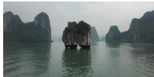
ภาพที่ 21 หินดิ่งเอื่อง กลางอ่าวฮาลอง