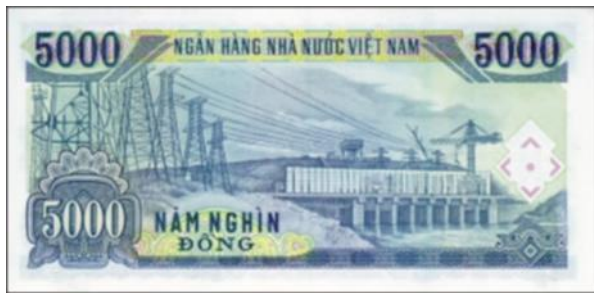
ภาพที่ 10 ธนบัตรด้านหลังมูลค่า 5,000 ด่งห์

4. ภาพบนธนบัตร 5,000 ด่งห์ เป็นภาพโรงไฟฟ้าพลังน้ำจิอัน (Trị An) ซึ่งเป็นโรงงานไฟฟ้าพลังน้ำขนาดใหญ่ที่สุดในบริเวณภาคใต้ของประเทศเวียดนาม สร้างขึ้นบนแม่น้ำต่งนาย จังหวัดต่งนาย (Đông Nai) ทางตะวันออกเฉียงเหนือห่างจากเมืองโฮจิมินห์ประมาณ 65 กิโลเมตร โรงงานไฟฟ้าแห่งนี้ได้รับการสนับสนุนด้านการเงินและเทคโนโลยีจากสหภาพโซเวียตตั้งแต่ปี ค.ศ.1987 และได้เริ่มใช้งานครั้งแรกในปี ค.ศ.1988 โรงงานไฟฟ้าพลังงานน้ำจิอันแห่งนี้สามารถผลิตกระแสไฟได้มากถึง 1760 ล้านกิโลวัตต์ต่อปีและสามารถจ่ายกระแสไฟไปยังจังหวัดต่งนายและจังหวัดใกล้เคียงรวมถึงถึงมหานครโฮจิมินห์อีกด้วย (Tập Đoàn Điện Lực Việt Nam. 2016: ออนไลน์)