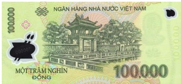
ภาพที่ 18 ธนบัตรด้านหลังมูลค่า 100,000 ด่งห์