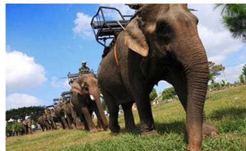
ภาพที่ 7 ช้างลากซุงเมืองเตยเงวียน

3. ภาพบนธนบัตร 2,000 ด่งห์ เป็นภาพการทำงานในโรงงานอุตสาหกรรมทอผ้าผ่านนามดัญตั้งอยู่ในจังหวัดนามดัญ (Nam Định) บริเวณทางตอนเหนือของประเทศเวียดนาม สร้างขึ้นในปลายศตวรรษที่ 19 โดยข้าหลวงใหญ่แห่งอินโดจีนชาวฝรั่งเศส โรงงานอุตสาหกรรมทอผ้าแห่งนี้ในอดีตเคยเป็นศูนย์วิจัยไหม จนกระทั่งปี ค.ศ. 1898 ฝรั่งเศสได้เชิญนักวิจัยใหม่มาสร้างเครื่องจักรไอน้ำผลิตผ้าไหมเป็นครั้งแรกในเมืองนามดัญ ทำให้โรงงานสิ่งทอนามดัญเป็นต้นกำเนิดของอุตสาหกรรมสิ่งทอในประเทศเวียดนามและเป็นส่วนหนึ่งของประวัติศาสตร์เมืองนามดัญ (Dần trí. 2016: ออนไลน์) อุตสาหกรรมผลิตภัณฑ์สิ่งทอเป็นหนึ่งในสินค้าส่งออกอันดับสองของประเทศเวียดนาม รองจากน้ำมันดิบ (ข้อมูลจากกรมส่งเสริมการส่งออก : ค.ศ. 2017) ยิ่งไปกว่านั้นเวียดนามยังเป็น 1 ใน 6 อันดับแรกของกลุ่ม 153 ประเทศที่ส่งออกเสื้อผ้าไปทั่วโลก รองจากจีน สหภาพ