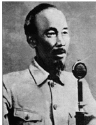
ภาพที่ 2 ประธานาธิบดีโฮ จิ มินห์