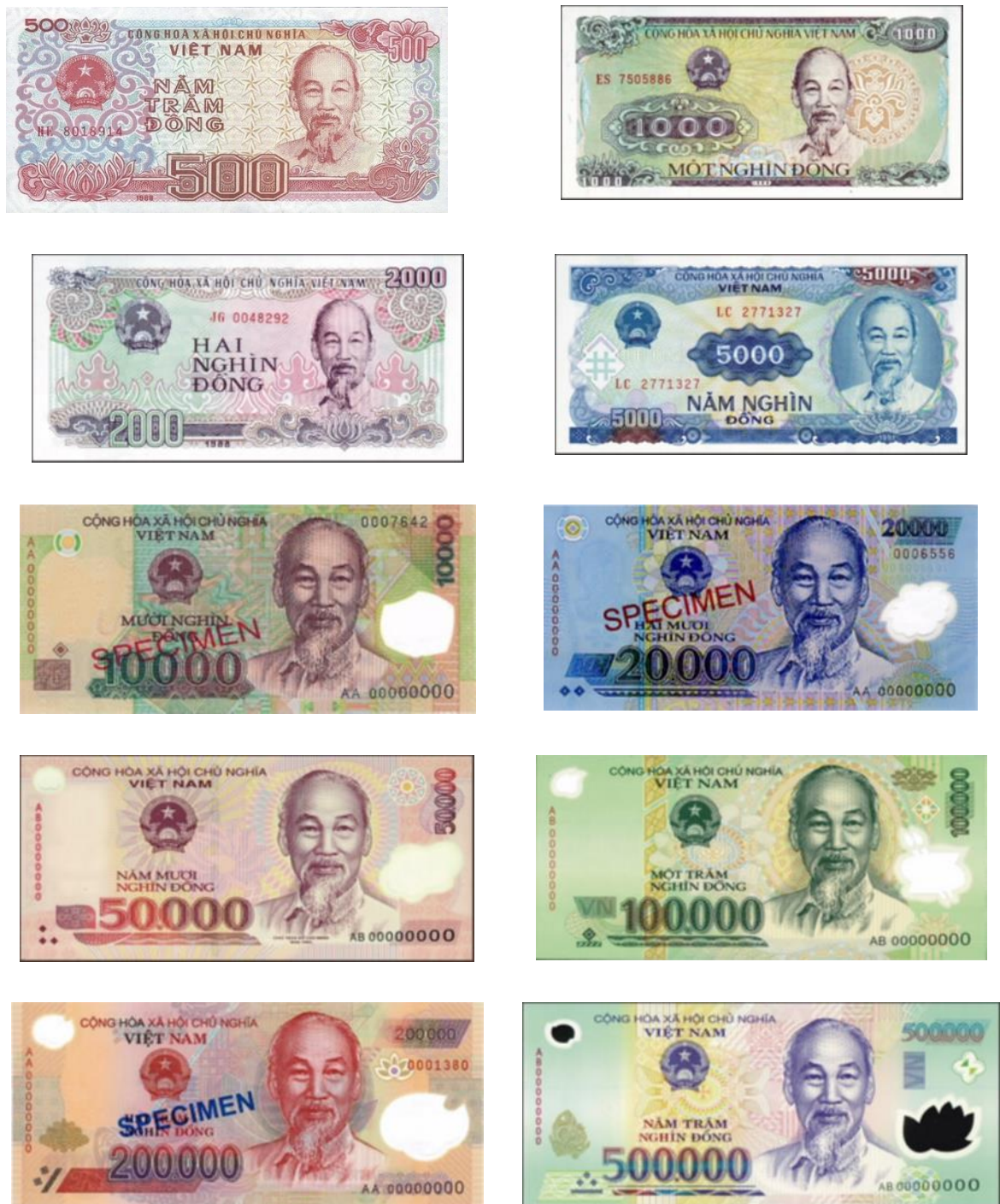
ภาพที่ 3 ชุดภาพธนบัตรประเทศเวียดนามที่หมุนเวียนอยู่ในปัจจุบัน (ด้านหน้า)