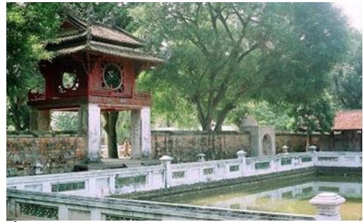
ภาพที่ 19 ศาลาควงวันในวิหารวรรณกรรม