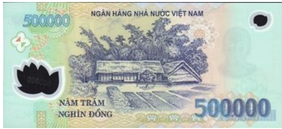
ภาพที่ 22 ธนบัตรด้านหลังมูลค่า 500,000 ด่งห์