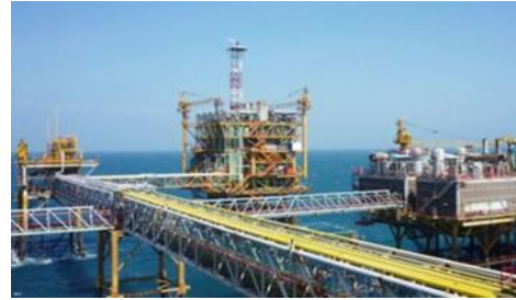
ภาพที่ 13 แท่นขุดเจาะน้ำมันนอกชายฝั่งเมืองหวุงเต่า