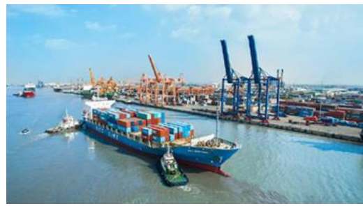
ภาพที่ 5 ท่าเรือไฮฟอง

2. ภาพบนธนบัตร 1,000 ด่งห์ เป็นภาพการทำอุตสาหกรรมป่าไม้ตามเขตพื้นที่ราบสูงบริเวณเมืองเตยเงวียน (Tây Nguyên) บริเวณภาคกลางของประเทศเวียดนามซึ่งประกอบด้วย 6 จังหวัด ได้แก่ กอน ตุม (Kon Tum), ซา ลาย (Gia Lai), ดัก ลัก (Đắk Lắk), ดัก นง (Đắk Nông) และ เลิม ด่ง (Lâm Đồng) ซึ่งบริเวณนี้เป็นพื้นที่ป่าไม้ที่มีความอุดมสมบูรณ์และเป็นแหล่งทรัพยากรทางธรรมชาติที่สำคัญ อีกทั้งอุตสาหกรรมป่าไม้ก็ยังสร้างรายได้ให้กับคนในประเทศและเป็นสินค้าส่งออกที่สำคัญอันดับ 8 ในปี ค.ศ. 2017 อีกด้วย (vneconomy. 2019: ออนไลน์)