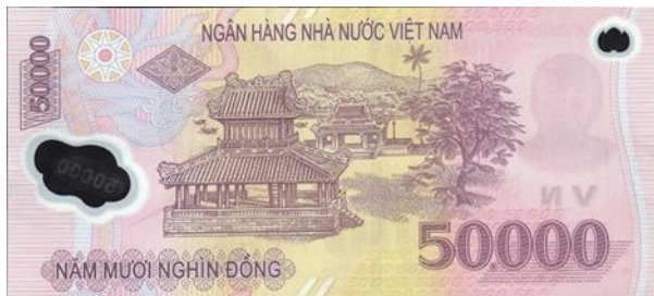
ภาพที่ 16 ธนบัตรด้านหลังมูลค่า 50,000 ด่งห์

7. ภาพธนบัตร 50,000 ด่งห์ เป็นภาพศาลาฟู้วันเลา หนึ่งในสถาปัตยกรรมอันเก่าแก่ที่เกี่ยวข้องกับประวัติศาสตร์ของราชวงศ์เหงวียน สร้างขึ้นในปี ค.ศ. 1819 สมัยกษัตริย์ชาลอง (Gia Long) ศาลาแห่งนี้สร้างขึ้นเพื่อเป็นสถานที่ออกพระราชกฤษฎีกาของประเทศ สำหรับพระมหากษัตริย์ ราชวงศ์และขุนนาง ทั้งยังเป็นสถานที่ต้อนรับพระราชอาคันตุกะจากต่างประเทศลักษณะคล้ายศาลาสองชั้น ด้านหน้ามีปี่นใหญ่สองกระบอกตั้งหันหน้าเข้าหาศาลา ตัวศาลาตั้งอยู่บริเวณด้านหน้าพระราชวังเว้ (Thủ Thiê Huế) ริมแม่น้ำหอมและอยู่ทางด้านหลัง ป้อมปราการเว้หันหน้าไปทางทิศใต้ และเนื่องด้วยบริเวณที่ตั้งอยู่ริมแม่น้ำหอมจึงทำให้ศาลาฟู้วันเลาเป็นสถานที่ประกอบกิจกรรมบันเทิงและผ่อนคลายพระอิริยาบถจากการทรงงานของพระมหากษัตริย์อีกด้วย ในสมัยการปกครองของกษัตริย์เถี่ยว จิ (Thiêu Tri) ได้มีการนำแผ่นหินสลักคำว่า “Khuynh cái hậ mả” แปลว่า “ใครผ่านมามากต้องถอดหมวกและลงจากรถม้า” มาตั้งบริเวณด้านหน้าซึ่ง เพื่อเป็นการแสดงความเคารพแก่พระมหากษัตริย์และพระบรมวงศานุวงศ์ (Huỳnh Thị Anh Vân. 2013: ออนไลน์) จากประวัติความเป็นมาอันยาวนานจึงทำให้ศาลาฟู้วันเลากลายเป็นสัญลักษณ์สำคัญของเมืองเว้ ซึ่งเคยเป็นราชธานีเก่าของเวียดนามในอดีตอีกด้วย