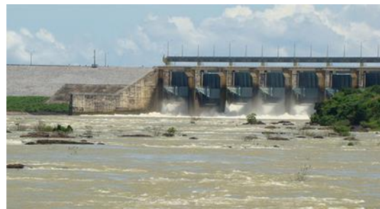
ภาพที่ 11 โรงงานไฟฟ้าพลังน้ำจิอัน

5. ภาพบนธนบัตร 10,000 ด่งห์ เป็นภาพการขุดเจาะน้ำมันทางตอนใต้นอกชายฝั่งเมืองหุงเต่า (Vũng Tàu) ตั้งอยู่ในจังหวัดบาเรีย-หุงเต่า (Ba Rịa – Vũng Tàu) ทางตะวันออกเฉียงใต้ห่างจากชายฝั่งทะเลหุงเต่าประมาณ 145 กิโลเมตร ในปี ค.ศ. 1975 กลุ่มบริษัท “Vietsovpetro” ได้ร่วมมือกันระหว่างประเทศเวียดนามกับประเทศรัสเซีย ในการขุดพบแหล่งน้ำมันนอกชายฝั่ง หลังจากนั้นจึงได้ร่วมมือกันพัฒนาแท่นขุดเจาะน้ำมัน (Petrotime. 2018: ออนไลน์) จนเมืองหุงเต่ากลายเป็นจุดศูนย์กลางของอุตสาหกรรมน้ำมันและก๊าซธรรมชาติ ทั้งนี้รัฐบาลเวียดนามได้จำกัดสัมปทานการแสวงหาก๊าซธรรมชาติบางส่วนสำหรับกลุ่มบริษัทน้ำมันจากต่างประเทศและสงวนบางส่วนไว้สำหรับการพัฒนาอุตสาหกรรมและเศรษฐกิจในประเทศในอนาคต ที่มีแนวโน้มในการใช้พลังงานเหล่านี้เพิ่มสูงขึ้น กล่าวได้ว่าประเทศเวียดนามถือเป็นประเทศที่มีแหล่งทรัพยากร