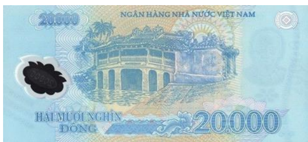
ภาพที่ 14 ธนบัตรด้านหลังมูลค่า 20,000 ด่งห์