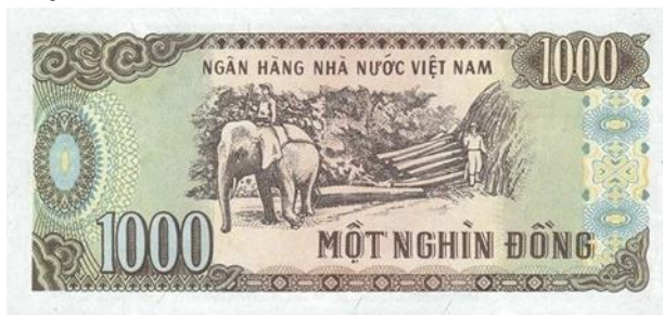
ภาพที่ 6 ด้านหลังธนบัตรมูลค่า 1,000 ด่งห์

2. ภาพบนธนบัตร 1,000 ด่งห์ เป็นภาพการทำอุตสาหกรรมป่าไม้ตามเขตพื้นที่ราบสูงบริเวณเมืองเตยเงวียน (Tây Nguyên) บริเวณภาคกลางของประเทศเวียดนามซึ่งประกอบด้วย 6 จังหวัด ได้แก่ กอน ตุม (Kon Tum), ซา ลาย (Gia Lai), ดัก ลัก (Đắk Lắk), ดัก นง (Đắk Nông) และ เลิม ด่ง (Lâm Đồng) ซึ่งบริเวณนี้เป็นพื้นที่ป่าไม้ที่มีความอุดมสมบูรณ์และเป็นแหล่งทรัพยากรทางธรรมชาติที่สำคัญ อีกทั้งอุตสาหกรรมป่าไม้ก็ยังสร้างรายได้ให้กับคนในประเทศและเป็นสินค้าส่งออกที่สำคัญอันดับ 8 ในปี ค.ศ. 2017 อีกด้วย (vneconomy. 2019: ออนไลน์)