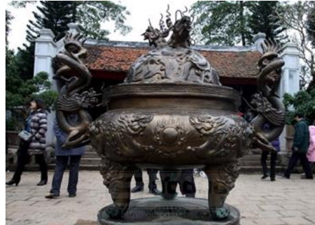
ภาพกระถางเผาเครื่องหอม