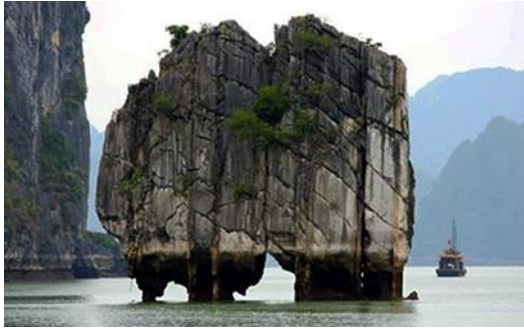
ภาพหินดิ่งเฮือง กลางอ่าวฮาลอง

เครื่องหอมนี้เป็นการแสดงถึงความจริงใจและความบริสุทธิ์ใจ ควันหอมที่พวยพุ่งนั้น เปรียบเสมือนควันบริสุทธิ์ที่จะช่วยขับไล่สิ่งไม่ดี สิ่งชั่วร้ายและอันตรายทั้งปวงตามความเชื่อโบราณ รวมถึงกลิ่นจากการเผาเครื่องหอมยังสามารถช่วยทำให้จิตใจสงบเย็น ด้วยเหตุนี้ชาวเวียดนามจึงเชื่อว่าเกาะหินที่มีลักษณะคล้ายกระถางเครื่องหอมที่ปรากฏอยู่กลางทะเล เปรียบเสมือนเครื่องบูชาเทพเจ้ามังกรที่สิงสถิตอยู่ในอ่าวแห่งนี้ และยังถือเป็นการทำความเคารพบรรพบุรุษเวียดนามในอดีต ตามตำนานของชาวเวียดนามที่ว่าบรรพบุรุษของตนสืบเชื้อสายจากมังกร