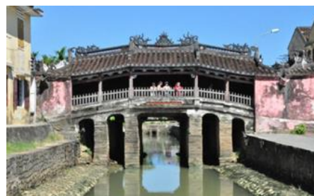
ภาพที่ 15 สะพานญี่ปุ่นในเมืองฮอยอัน