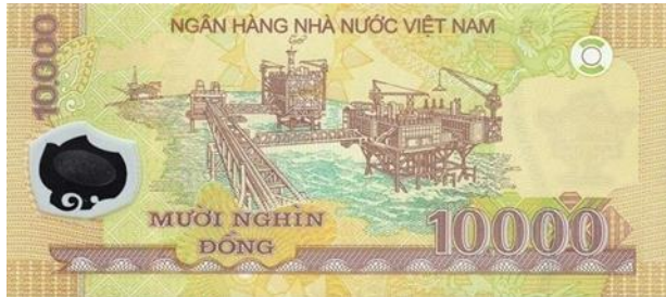
ภาพที่ 12 ธนบัตรด้านหลังมูลค่า 10,000 ด่งห์

ทางธรรมชาติที่อุดมสมบูรณ์อีกประเทศหนึ่งในเอเชียตะวันออกเฉียงใต้ โดยเฉพาะอย่างยิ่งทรัพยากรน้ำมัน ปิโตรเลียม และ ก๊าซธรรมชาติ