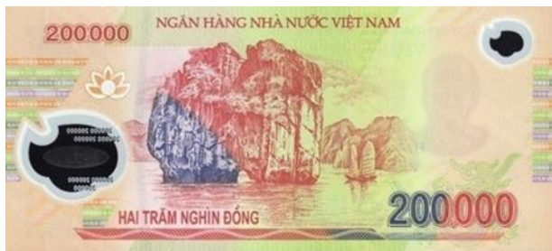
ภาพที่ 20 ธนบัตรด้านหลังมูลค่า 200,000 ด่งห์

9. ภาพบนธนบัตร 200,000 ด่งห์ เป็นภาพของหิน ดิ่ง เอื่อง (Đình HU'Ông) ปรากฏอยู่กลางอ่าวฮาลอง (Vinh Ha Long) ซึ่งเป็นมรดกโลกทางธรรมชาติที่ได้รับการขึ้นทะเบียนโดยองค์การสหประชาชาติ (UNESCO) ในปี ค.ศ.1994 (ข้อมูลอ้างอิงจากเว็บไซต์องค์การสหประชาชาติ) และยังเป็นหนึ่งในสถานที่ท่องเที่ยวยอดนิยมของชาวเวียดนามและชาวต่างประเทศ อ่าวฮาลองตั้งอยู่บริเวณพื้นที่อ่าวตังเกี๋ยทางตอนบนของประเทศเวียดนาม มีลักษณะเป็นหมู่เกาะนับพันชั้นสลับเรียงรายกระจายอยู่ทั่วอ่าว มีความหลากหลายทางชีวภาพทั้งทางบกและทางทะเล ทั้งยังมีถ้ำหินงอกหินย้อยนับ 10 ถ้ำ และสัตว์น้ำหลายพันชนิด อ่าวฮาลองยังเป็นหนึ่งในพื้นที่เพาะเลี้ยงฟาร์มมุกที่สำคัญและเป็นสินค้าส่งออกที่นารายได้ให้กับประเทศเวียดนาม คำว่า “ฮาลอง” (Hà Long) ในภาษาเวียดนามหมายถึง “มังกรร่อนลง” ตามตำนานพื้นบ้านของชาวเวียดนามเล่าว่า ในอดีตเวียดนามถูกจีนรุกราน เทพเจ้าจึงได้ส่งมังกรมาช่วยปกป้องพื้นแผ่นดินเวียดนามจากข้าศึกจีน ซึ่งชาวเวียดนามเชื่อกันว่ามังกรเป็นสัตว์ศักดิ์สิทธิ์และเป็นบรรพบุรุษของตน ตามตำนานยังเล่าอีกว่ามังกรได้พ่นอัญมณีและหยกออกมาจนกลายเป็นเกาะแก่งน้อยใหญ่กระจายกระจาย เพื่อเป็นเกราะป้องกันข้าศึกรุกราน ชาวเวียดนามยังเชื่ออีกว่าได้อ่าวฮาลองยังคงเป็นที่สิงสถิตของเทพเจ้ามังกรตามตำนานดังกล่าวอีกด้วย