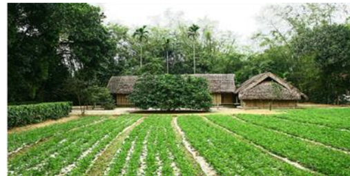
ภาพที่ 23 บ้านเกิดโฮจิมินห์ หมู่บ้านสว่างจู้