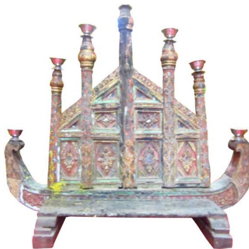
ภาพที่ 5 สัตตภัณฑ์แบบห้าเหลี่ยม วัดชัยศรีภูมิ อำเภอเมือง จังหวัดเชียงใหม่

4. สัตตภัณฑ์แบบห้าเหลี่ยม สัตตภัณฑ์เป็นแบบห้าเหลี่ยม วางบนฐานคล้ายเรือพบที่วัดชัยศรีภูมิ อำเภอเมือง จังหวัดเชียงใหม่ เป็นแบบห้าเหลี่ยมทรงสำเภ ทำจากไม้เนื้อแข็ง ไม่ปรากฏปีที่สร้างชัดเจน แต่มีมาก่อนปี 2518 ไม่ปรากฏช่างผู้สร้าง สัตตภัณฑ์ชิ้นนี้มีขนาด กว้าง 130 เซนติเมตร สูง 110 เซนติเมตร ใช้ไม้สักเป็นวัสดุหลักในการสร้าง นำมาแกะสลักเป็นรูปต่างๆ มีเสา 5 เสา เป็นลายพรรณพฤกษา วางบนเรือ ส่วนหัวและหางของเรือมีข้างละ 1 เสา ตรงกลางเป็นช่อง สี่เหลี่ยมผืนผ้า 4 ช่อง จตุรัส 2 ช่อง และสามเหลี่ยม 4 ช่อง ตรงกลางเป็นลายกนก และพรรณพฤกษา สำหรับส่วนฐานจะมีลักษณะเป็นไม้รองรับ