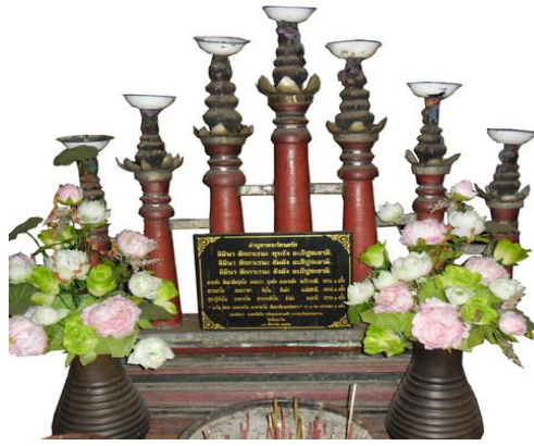
ภาพที่ 8 สัตตภณท์แบบเสาวัดอินทราวาส อำเภอเมือง จังหวัดเชียงใหม่

สำหรับที่สัตตภณท์วัดตันแก้วน อำเภอหางดง จังหวัดเชียงใหม่ เป็นแบบเสา ทำจากไม้เนื้อแข็ง ไม่มีลวดลาย ไม่ปรากฏปีที่สร้างและช่างผู้สร้าง สัตตภณท์ชั้นนี้มีขนาด กว้าง 141 เซนติเมตร สูง 98 เซนติเมตร ใช้ไม้สักทำเป็นเสา จำนวน 7 เสา มีที่ปักเทียนด้านบนทำเป็นพุ่ม มีที่ปักเทียนตรงกลาง ปัจจุบันยังอยู่ในสภาพค่อนข้างดี แต่สีเริ่มจางลงบ้าง ปัจจุบันเก็บไว้ในวิหารของวัด ใช้จุดธูปเทียนบูชาทั่วไป