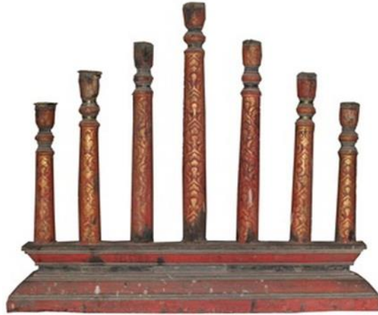
ภาพที่ 10 สัตตภัณฑ์แบบเสาวัตวังทอง อำเภอเมือง จังหวัดลำพูน

สรุปได้ว่า ประเภทของสัตตภัณฑ์ที่ค้นพบในปัจจุบันมีอยู่ทั้งหมด 5 รูปแบบ ได้แก่ 1) สัตตภัณฑ์รูปสามเหลี่ยม เป็นเอกลักษณ์และลักษณะเด่นของจังหวัดเชียงใหม่ 2) สัตตภัณฑ์แบบห้าเหลี่ยม พบในจังหวัดเชียงใหม่ 3) สัตตภัณฑ์แบบเสา พบในจังหวัดเชียงใหม่ ลำพูนและลำปาง 4) สัตตภัณฑ์รูปวงโค้ง (ครึ่งวงกลม) พบมากในจังหวัดลำพูนและลำปาง 5) สัตตภัณฑ์แบบชั้นบันได หรือเรียกว่า บันไดแก้ว รูปแบบนี้เป็นงานศิลปกรรมของช่างฝีมือของชาวไทยลื้อในจังหวัดแพร่และน่าน ปัจจุบันพบได้ในวัดของชาวไทยลื้อ