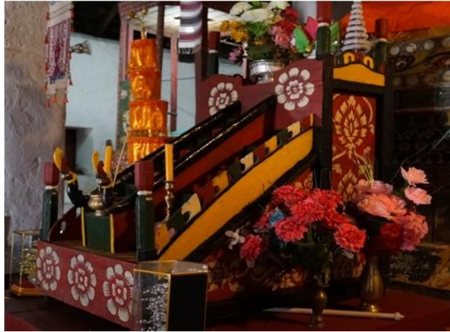
ภาพที่ 4 สัตตภัณฑ์แบบขั้นบันได วัดดอนมูล อำเภอท่าวังผา จังหวัดน่าน

ในการสืบค้นและจัดเก็บข้อมูลภาคสนามในเขตภาคเหนือตอนบน 7 จังหวัด ได้แก่ เชียงใหม่ เชียงราย พะเยา ลำพูน ลำปาง แพร่ และน่านจากวัดต่างๆ จำนวน 500 วัด พบสัตตภัณฑ์ทั้งหมด จำนวน 128 ชิ้น ส่วนมากจะมีรูปแบบแบ่งออกเป็น 3 ประเภทตั้งที่นำเสนอไว้ข้างต้น คือ รูปแบบสามเหลี่ยม ครึ่งวงกลม และแบบขั้นบันไดตามลำดับ แต่คณะผู้วิจัยได้ค้นพบสัตตภัณฑ์บางชิ้นที่มีลักษณะไม่ตรงกับรูปแบบข้างต้น จึงนำเสนอรูปแบบที่ค้นพบเพิ่มเติมอีก 2 รูปแบบ คือ รูปแบบห้าเหลี่ยม และรูปแบบเสา ดังนี้