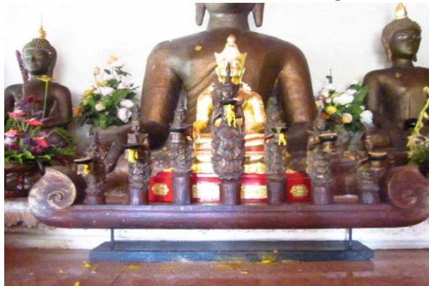
ภาพที่ 7 สัตตภัณฑ์แบบเสา วัดผาลาด อำเภอเมือง จังหวัดเชียงใหม่

5. สัตตภัณฑ์แบบเสา สัตตภัณฑ์แบบนี้จะมีเสาทั้งหมด 7 เสาตั้งขึ้นรอบรับเทียนที่ใช้จุด ไม่มีแผงสามเหลี่ยม หรือห้าเหลี่ยมปิดด้านหน้าแต่อย่างใด มีลวดลายน้อย เน้นการใช้งานเป็นหลัก พบที่วัดผาลาด วัดอินทราวาส วัดตันแกวัน ในจังหวัดเชียงใหม่ และวัดวังทองในจังหวัดลำพูน สัตตภัณฑ์วัดผาลาด อำเภอเมือง จังหวัดเชียงใหม่ ชั้นที่ 2 เป็นแบบเสา ทำจากไม้ ลวดลายเป็นรูปเทวดา ไม่ปรากฏปีที่สร้างและช่างผู้สร้าง สัตตภัณฑ์ชั้นนี้มีขนาด กว้าง 134 เซนติเมตร สูง 76 เซนติเมตร ใช้ไม้สักเป็นวัสดุหลักในการสร้าง นำมาแกะสลักเป็นรูปเทวดาบนหัวเสา จำนวนทั้งหมด 7 องค์ด้วยกัน ยืนอยู่ในท่าพนมมือ ใช้เทคนิคทาสีทางวิทยาศาสตร์ สีแดง วางบนฐานไม้ที่ทำคล้ายรูปเรือ