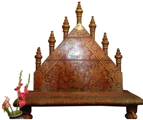
ภาพที่ 6 สัตตภัณฑ์แบบห้าเหลี่ยมวัดพระสิงค์วรมหาวิหาร อำเภอเมือง จังหวัดเชียงใหม่

ลวดลายด้วยเทคนิคทาสีวิทยาศาสตร์ คือ สีพลาสติคสีทอง ลงรักปิดทอง ตรงกลางเป็นรูปหงส์ 4 ตัว สำหรับส่วนฐานจะมีลักษณะคล้ายโต๊ะยกพื้นสูง และปิดทอง