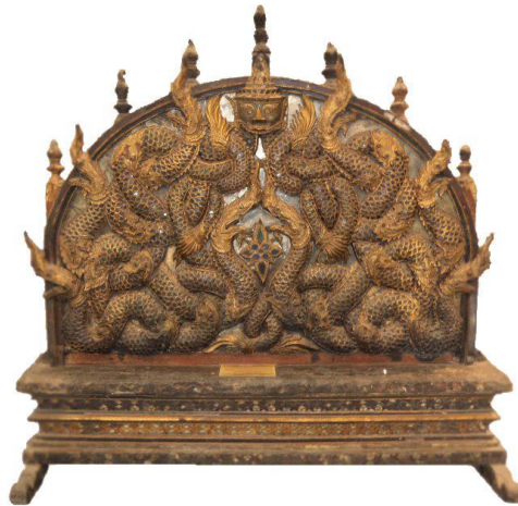
ภาพที่ 3 สัตตภัณฑ์แบบวงโค้ง พิพิธภัณฑสถานแห่งชาติหริภุญไชย อำเภอเมือง จังหวัดลำพูน

2. สัตตภัณฑ์รูปโค้งหรือครึ่งวงกลม ลักษณะคล้ายสัตตภัณฑ์รูปสามเหลี่ยม แต่ส่วนยอดจะมนเป็นวงโค้งคล้ายตัวเตี้ยงดูเป็นรูปวงกลมมียอดเสา 7 ยอด กรอบด้านข้างไม่นิยมลวดลายตัวนาค แม้มักจะตกแต่งด้วยตัวนาคไว้ภายใน ซึ่งเป็นลายนาคเกี่ยวหรือนาคขดพันกันแน่น สัตตภัณฑ์ในรูปแบบนี้พบมากในเขตเมืองลำพูนและลำปาง