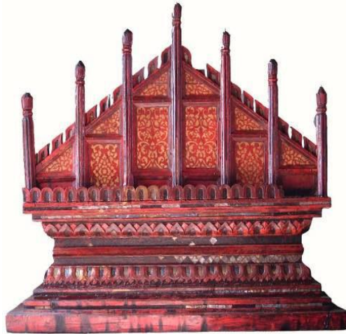
ภาพที่ 2 สัตตภัณฑ์แบบสามเหลี่ยมวัดนาคตหลวง อำเภอแม่ทะ จังหวัดลำปาง

2. สัตตภัณฑ์รูปโค้งหรือครึ่งวงกลม ลักษณะคล้ายสัตตภัณฑ์รูปสามเหลี่ยม แต่ส่วนยอดจะมนเป็นวงโค้งคล้ายตัวเตี้ยงดูเป็นรูปวงกลมมียอดเสา 7 ยอด กรอบด้านข้างไม่นิยมลวดลายตัวนาค แม้มักจะตกแต่งด้วยตัวนาคไว้ภายใน ซึ่งเป็นลายนาคเกี่ยวหรือนาคขดพันกันแน่น สัตตภัณฑ์ในรูปแบบนี้พบมากในเขตเมืองลำพูนและลำปาง