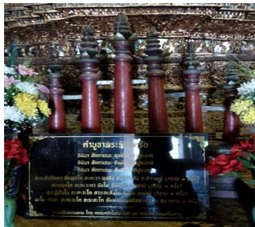
ภาพที่ 9 สัตตภณท์แบบเสาวัดตันแก้วน อำเภอหางดง จังหวัดเชียงใหม่

สำหรับที่สัตตภณท์วัดตันแก้วน อำเภอหางดง จังหวัดเชียงใหม่ เป็นแบบเสา ทำจากไม้เนื้อแข็ง ไม่มีลวดลาย ไม่ปรากฏปีที่สร้างและช่างผู้สร้าง สัตตภณท์ชั้นนี้มีขนาด กว้าง 141 เซนติเมตร สูง 98 เซนติเมตร ใช้ไม้สักทำเป็นเสา จำนวน 7 เสา มีที่ปักเทียนด้านบนทำเป็นพุ่ม มีที่ปักเทียนตรงกลาง ปัจจุบันยังอยู่ในสภาพค่อนข้างดี แต่สีเริ่มจางลงบ้าง ปัจจุบันเก็บไว้ในวิหารของวัด ใช้จุดธูปเทียนบูชาทั่วไป