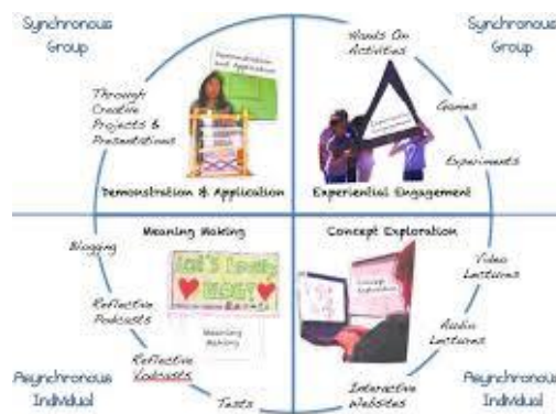
รูปที่ 3 องค์ประกอบทั้ง 4 การจัดการเรียนการสอนแบบห้องเรียนกลับด้าน (Flipped Classroom)

การจัดการเรียนการสอนแบบห้องเรียนกลับด้าน (Flipped Classroom) ซึ่งเป็นรูปแบบการเรียนการสอนเน้นการสร้างผู้เรียนให้เกิดการเรียนรู้แบบรอบด้านหรือ Mastery Learning นั้นจะมีองค์ประกอบสำคัญที่เกิดขึ้น 4 องค์ประกอบที่เป็นวัฏจักร (Cycle) หมุนเวียนกันอย่างเป็นระบบ ซึ่งองค์ประกอบทั้ง 4 ที่เกิดขึ้น ได้แก่