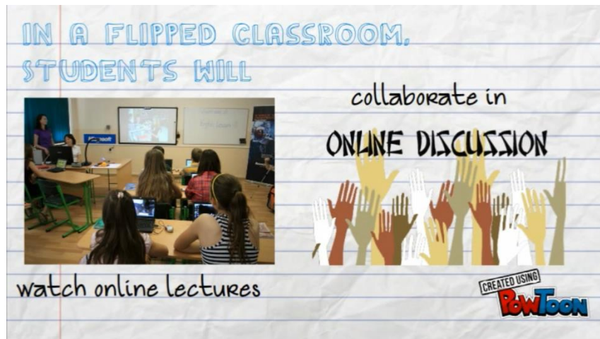
รูปที่ 2 รูปแบบการเรียนการสอนแบบห้องเรียนกลับด้าน