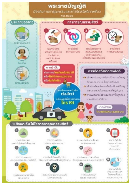
ภาพที่ 3 แสดงผลการออกแบบสื่ออินโฟกราฟิก เรื่อง พระราชบัญญัติป้องกันการทารุณกรรม และการจัดสวัสดิภาพสัตว์ พ.ศ. ๒๕๕๗ รูปแบบภาพนิ่ง