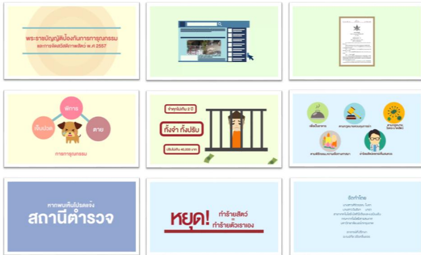
ภาพที่ 2 แสดงผลการออกแบบสื่ออินโฟกราฟิก เรื่อง พระราชบัญญัติป้องกันการทารุณกรรม และการจัดสวัสดิภาพสัตว์ พ.ศ. ๒๕๕๗ รูปแบบภาพเคลื่อนไหว