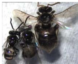
ภาพที่ 2 ชันโรงแต่ละวรรณะเรียงจากซ้ายไปขวา ได้แก่ ชันโรงตัวผู้ ชันโรงาน และชันโรงนางพญา

จากการศึกษาเอกสาร พบว่า ชันโรงสร้างรังตามโพรงมืดที่มีขนาดพอเหมาะ ปลอดภัยต่อการดำรงชีวิตของมัน ชันโรงไม่สามารถกัดไม้หรือขุดดินเพื่อสร้างรังได้ จึงต้องอาศัยโพรงต่าง ๆ เช่น