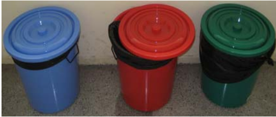
ภาพที่ 7 ภาชนะรองรับภายในอาคาร บริเวณหน้าห้องเรียน ชั้น 2 อาคารบรรณารักษ์ศาสตร์

ขยะจากภายในอาคาร จะมีภาชนะรองรับ 3 ถัง คือ ถังสีน้ำเงินรองรับขยะเปียก ถังสีแดงรองรับขยะแห้ง และถังสีเขียวรองรับขยะรีไซเคิล โดยมีถุงสีดาร์องไว้ในถังเพื่อป้องกันการเคลื่อนย้ายไปกำจัด (ภาพที่ 7) ซึ่งพนักงานทำความสะอาดประจำอาคารแต่ละอาคารจะนำขยะที่รีไซเคิลได้ไปขายที่ธนาคารวัสดุรีไซเคิล ขยะแห้งและขยะเปียกจะนำไปเก็บรวบรวมกันไว้ที่โรงพักขยะชั่วคราว ซึ่งตั้งอยู่ริมกำแพงใกล้สนามเทนนิสของมหาวิทยาลัย