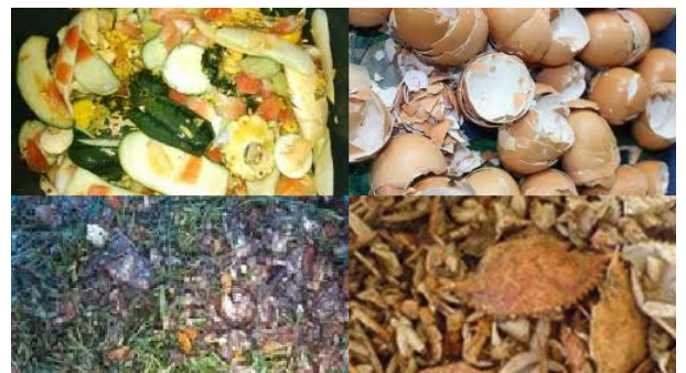
ภาพที่ 1 ขยะย่อยสลายหรือมูลฝอยย่อยสลายได้

มูลฝอยย่อยสลาย คือ ขยะที่เน่าเสียและย่อยสลายได้เร็ว สามารถนำมาหมักทำปุ๋ยได้ เช่น เศษผัก เปลือกผลไม้ เศษอาหาร ใบไม้ เศษเนื้อสัตว์ เป็นต้น (ภาพที่ 1) แต่จะไม่รวมถึงซากหรือเศษของพืช ผัก ผลไม้ หรือสัตว์ที่เกิดจากการทดลองในห้องปฏิบัติการ โดยที่ขยะย่อยสลายนี้เป็นขยะที่พบมากที่สุดคือ พบมากถึงร้อยละ 64 ของปริมาณขยะทั้งหมดในกองขยะ