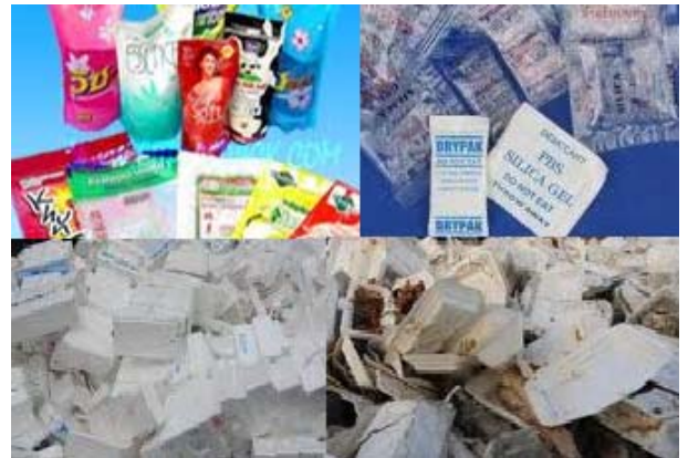
ภาพที่ 4 ขยะทั่วไปหรือมูลฝอยทั่วไป

3. ขยะอันตราย (hazardous waste) หรือมูลฝอยอันตราย คือ ขยะที่มีองค์ประกอบหรือปนเปื้อนวัตถุอันตรายชนิดต่างๆ ซึ่งได้แก่ วัตถุระเบิด วัตถุไวไฟ วัตถุออกซิไดซ์ วัตถุมีพิษ วัตถุที่ทำให้เกิดโรค วัตถุกัดกร่อน วัตถุที่ทำให้เกิดการเปลี่ยนแปลงทางพันธุกรรม วัตถุกัดกร่อน วัตถุที่ก่อให้เกิดการระคายเคือง วัตถุอย่างอื่นไม่ว่าจะเป็นเคมีภัณฑ์หรือสิ่งอื่นใดที่อาจทำให้เกิดอันตรายแก่บุคคล สัตว์ พืช ทรัพย์สิน หรือสิ่งแวดล้อม เช่น ถ่านไฟฉาย หลอดฟลูออเรสเซนต์ แบตเตอรี่โทรศัพท์เคลื่อนที่ ภาชนะบรรจุสารกำจัดศัตรูพืช กระป๋องสเปรย์บรรจุสีหรือสารเคมี เป็นต้น (ภาพที่ 3) ขยะอันตรายนี้เป็นขยะที่มักจะพบได้น้อยที่สุด กล่าวคือ พบเพียงประมาณร้อยละ 3 ของปริมาณขยะทั้งหมดในกองขยะ