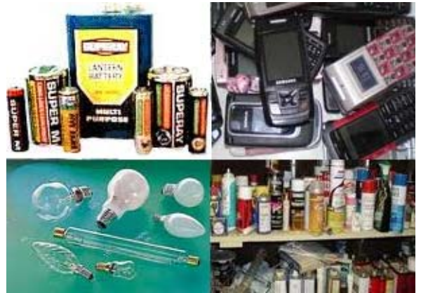
ภาพที่ 3 ขยะอันตรายหรือมูลฝอยอันตราย

3. ขยะอันตราย (hazardous waste) หรือมูลฝอยอันตราย คือ ขยะที่มีองค์ประกอบหรือปนเปื้อนวัตถุอันตรายชนิดต่างๆ ซึ่งได้แก่ วัตถุระเบิด วัตถุไวไฟ วัตถุออกซิไดซ์ วัตถุมีพิษ วัตถุที่ทำให้เกิดโรค วัตถุกัดกร่อน วัตถุที่ทำให้เกิดการเปลี่ยนแปลงทางพันธุกรรม วัตถุกัดกร่อน วัตถุที่ก่อให้เกิดการระคายเคือง วัตถุอย่างอื่นไม่ว่าจะเป็นเคมีภัณฑ์หรือสิ่งอื่นใดที่อาจทำให้เกิดอันตรายแก่บุคคล สัตว์ พืช ทรัพย์สิน หรือสิ่งแวดล้อม เช่น ถ่านไฟฉาย หลอดฟลูออเรสเซนต์ แบตเตอรี่โทรศัพท์เคลื่อนที่ ภาชนะบรรจุสารกำจัดศัตรูพืช กระป๋องสเปรย์บรรจุสีหรือสารเคมี เป็นต้น (ภาพที่ 3) ขยะอันตรายนี้เป็นขยะที่มักจะพบได้น้อยที่สุด กล่าวคือ พบเพียงประมาณร้อยละ 3 ของปริมาณขยะทั้งหมดในกองขยะ