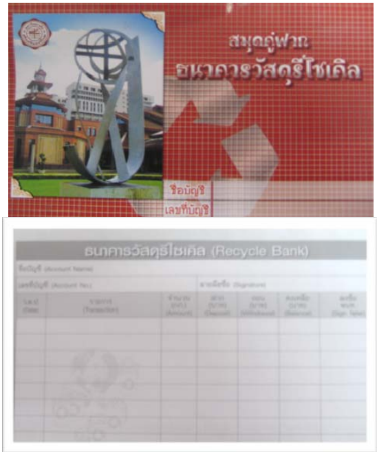
ภาพที่ 10 สมุดคู่มือธนาคารวัสดุรีไซเคิล

ของขยะแต่ละประเภท รวมทั้งแสดงให้เห็นถึงความร่วมมือของนิสิตและบุคลากรของมหาวิทยาลัย ที่มีส่วนร่วมในการประหยัดทรัพยากรธรรมชาติ และร่วมกันรักษาสิ่งแวดล้อมเพื่อสิ่งแวดล้อมที่ดีต่อไป