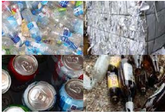
ภาพที่ 2 ขยะรีไซเคิลหรือมูลฝอยที่ยังใช้ได้