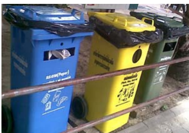
ภาพที่ 8 ภาชนะรองรับขยะมูลฝอยบริเวณทางเดินอาคาร 14 (ตึกไขดาว)

ขยะจากภายนอกอาคาร จะมีการจัดเตรียมถังขยะไว้ภายนอกอาคาร และบริเวณทางเดิน (ภาพที่ 8) และถ้าเป็นภายในอาคารหรือห้องเรียนจะมีถังรองรับขนาดเล็ก (ภาพที่ 7) สำหรับเศษอาหารจากโรงอาหาร ได้มีการตั้งภาชนะรองรับขยะมูลฝอยประกอบด้วย ถังสีเขียวสำหรับรองรับขยะทั่วไป ได้แก่ ถุงพลาสติก หรือโฟมเป็นอาหาร เศษผ้า หญา ใบไม้ กิ่งไม้ ถังสีเหลืองสำหรับรองรับขยะหมุนเวียน ได้แก่ ขวดพลาสติก กล่องเครื่องดื่ม และขวดที่ยังนำไปใช้หมุนเวียนได้ และถังน้ำเงินสำหรับรองรับ กระดาษที่ใช้แล้ว 2 หน้า กระดาษทั่วไป วารสาร นิตยสาร กล่องใส่ของ เป็นต้น ซึ่งทางมหาวิทยาลัยจะมีพนักงานทำความสะอาดมาจัดเก็บขยะที่อยู่ภายนอกในแต่ละจุด นำมารวมกันไว้ที่โรงพักขยะชั่วคราวเช่นเดียวกับขยะภายในอาคาร ในเวลา 20.00 น.ของทุกวัน จะมีพนักงานเก็บขยะกรุงเทพฯมาเก็บขยะในโรงพักขยะชั่วคราว เพื่อนำไปกำจัดต่อไป (ภาพที่ 9)