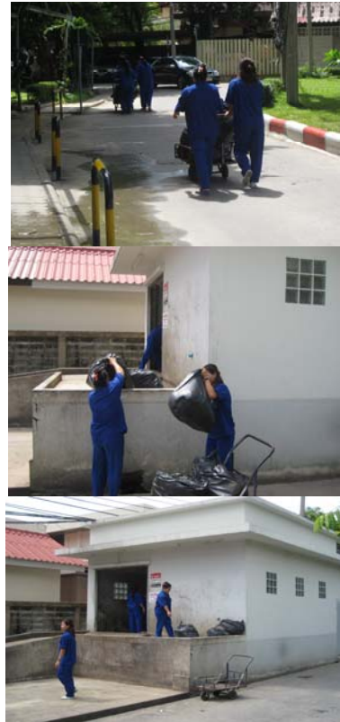
ภาพที่ 9 ขั้นตอนที่พนักงานทำความสะอาดนำขยะมาเก็บรวบรวมไว้ที่โรงพักขยะชั่วคราว