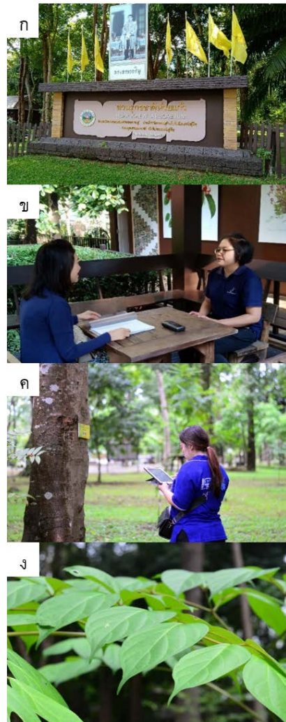
ภาพที่ 1 การรวบรวมข้อมูลพรรณไม้ (ก) สวนรุกขชาติห้วยแก้ว (ข) การร่วมกันศึกษาข้อมูลรายละเอียดพรรณไม้ (ค) ลงพื้นที่เพื่อตรวจสอบความถูกต้องของข้อมูล และ (ง) ตัวอย่างภาพถ่ายพรรณไม้ที่เก็บรวบรวม

เช่น ฐานข้อมูลพรรณไม้องค์การสวนพฤกษศาสตร์หอพรรณไม้กรมอุทยานแห่งชาติ หนังสือพรรณไม้เมืองไทย จากนั้นคณะผู้วิจัยและผู้เชี่ยวชาญในพื้นที่ร่วมกันตรวจสอบความถูกต้องของข้อมูลอีกครั้งก่อนนำเข้าข้อมูลสู่ฐานข้อมูล