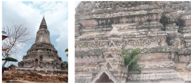
ภาพที่ 5 เจดีย์บรรจุพระอัฐิของสมเด็จพระศรีรักรัษราสมาอิศราธิบดี (พระองค์ด้วง) และรายละเอียดการประดับตกแต่งเป็นลวดลายด้วยกระเบื้องเคลือบสี ผู้วิจัยถ่ายเมื่อวันที่ 24 มีนาคม 2558

นอกจากเจดีย์ทั้งสองตามที่กล่าวมาแล้ว ณ สุสานหลวงพนมอู่ดงค์หรือเขาพระราชทรัพย์ ยังมีเจดีย์ที่สำคัญอีกองค์หนึ่งซึ่งแม้ว่าจากประวัติการสร้างนั้นจะสร้างขึ้นในช่วงสมัยรัตนโกสินทร์ สมัยรัชกาลที่ 5 ของไทย แต่รูปแบบและการประดับตกแต่งลวดลายต่างๆ ทำให้นึกถึงพระเจดีย์ในสมัยรัตนโกสินทร์ตอนต้นเป็นอย่างมาก คือ พระเจดีย์บรรจุพระบรมอัฐิของสมเด็จพระศรีรักรัษราสมาอิศราธิบดี (พระองค์ด้วง) สร้างขึ้นในพ.ศ. 2434 ตรงกับสมัยรัชกาลที่ 5 โดยสมเด็จพระนโรดมบรมรามเทวาวตาร พระราชาโอรส