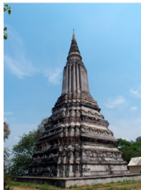
ภาพที่ 2 เจดีย์บรรจุพระอัฐิสมเด็จพระนารายณ์ราชา (พระองค์เอง) ผู้วิจัยถ่ายเมื่อวันที่ 24 มีนาคม 2558

เจดีย์บนเขาพระราชทรัพย์หรือสุสานหลวงพนมอูดงค์ที่ทราบประวัติการสร้างที่แน่นอนว่าสร้างขึ้นตรงกับสมัยรัชกาลที่ 1 ของไทย (พ.ศ. 2325 - 2352) พบเพียงองค์เดียวคือเจดีย์บรรจุพระบรมอัฐิสมเด็จพระนารายณ์ราชา (พระองค์เอง) สร้างขึ้นใน พ.ศ. 2341 โดยเจ้าฟ้าทะละหะ (ปก) ซึ่งดำรงตำแหน่งผู้สำเร็จราชการแผ่นดินเขมรในขณะนั้น