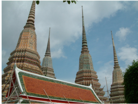
ภาพที่ 6 หมู่พระมหาเจดีย์ที่วัดพระเชตุพนวิมลมังคลารามหรือวัดโพธิ์ กรุงเทพฯ ผู้วิจัยถ่ายเมื่อวันที่ 2 พฤษภาคม 2551

ขณะเดียวกันเจดีย์พระองค์ด้วงยังได้นำลักษณะของเจดีย์องค์อื่นๆ ที่สร้างอยู่เดิมบนเขาพระราชทรัพย์มาเพิ่มเติมผสมผสานด้วย โดยเฉพาะเจดีย์ไตรตรึงษ์หรือเจดีย์ดำไรสัมพันธ์ที่อยู่ใกล้กันทั้งขนาด ความสูง และการทำฐานเป็นช่องๆ รวมทั้งลักษณะจากเจดีย์บรรจุพระบรมอัฐิสมเด็จพระมหินทราชา (นักพระสัตถา) ที่มีการประดับซุ้มจรณะนำแนบชิดกับฐานเจดีย์ทั้งสิ้นด้าน อันเป็นการกลับไปเลียนแบบเจดีย์ศิลปะสมัยอยุธยาตอนต้น แต่สิ่งที่เพิ่มเติมขึ้นมาอันเป็นเอกลักษณ์ของเจดีย์เขมรและคงอยู่สืบต่อมาจนถึงปัจจุบันคือ การทำลวดลายสายสังวาลประดับตกแต่งห้อยระย้าบริเวณส่วนองค์ระฆัง