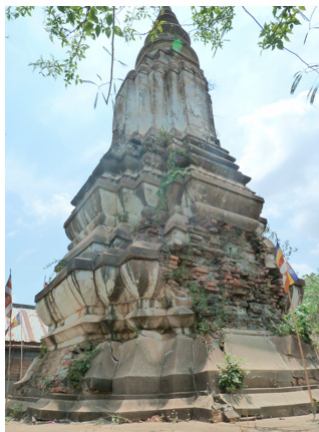
ภาพที่ 4 เจดีย์บรรจุพระอัฐิสมเด็จพระอุทัยราชา (พระองค์จันทที่ 2)

เจดีย์บนเขาพระราชทรัพย์หรือสุสานหลวงพนมอดงค์ที่ทราบประวัติแน่นอนว่าสร้างขึ้นตรงกับช่วงรัตนโกสินทร์ตอนต้นของไทยมีอีกองค์หนึ่ง สร้างขึ้นตรงกับสมัยรัชกาลที่ 3 ของไทย (พ.ศ. 2367-2394) คือ เจดีย์บรรจุพระบรมอัฐิสมเด็จพระอุทัยราชา (พระองค์จันท) ตั้งอยู่ด้านหน้าวิหารพระพุทธไสยาสน์ ณ วัดธรรมเกตุ สร้างขึ้นเมื่อ พ.ศ. 2377 โดยพระธิดา ทั้ง 4 พระองค์พร้อมด้วยพระวงศานุวงศ์