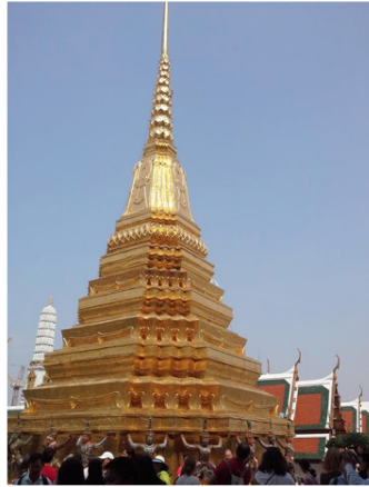
ภาพที่ 3 พระเจดีย์ทอง วัดพระศรีรัตนศาสดาราม กรุงเทพฯ

ผู้วิจัยถ่ายเมื่อวันที่ 8 กุมภาพันธ์ 2559