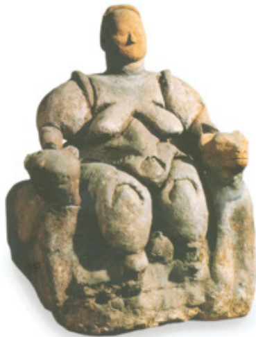
ภาพที่ 1 เทพีมารดรคลอดบุตรเป็นมนุษย์ท่ามกลางบริวารที่เป็นสัตว์ป่า รูปปั้นดินเหนียวสูง ๑๒ ซม. ณ ชาทัลฮูยุก ประเทศตุรกี

เป็นเรื่องน่าประหลาดใจว่าในโลกแห่งอารยธรรมโบราณ ยิ่งย้อนกลับไปในสมัยก่อนประวัติศาสตร์สตรีเป็นเพศที่ยิ่งใหญ่ในอดีต ดังหลักฐานการค้นพบรูปเคารพบูชาพระแม่แห่งแผ่นดิน เช่น รูปเทพีมารดรคลอดบุตรเป็นมนุษย์ท่ามกลางบริวารที่เป็นสัตว์ป่า ณ ชาทัลฮูยุก (ประเทศตุรกี) อายุประมาณ ๕,๔๐๐ - ๕,๒๐๐ ปีก่อนคริสตกาล ซึ่งเป็นยุคหินใหม่ โดยภาพลักษณ์สตรีที่เป็นเทพีนั้น มีลักษณะอ้วนท้วมสมบูรณ์ มีความหมายว่า สตรีเป็นสัญลักษณ์ของการก่อกำเนิด