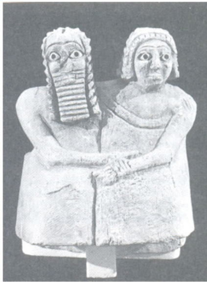
ภาพที่ 3 ตุ๊กตาคู่สามีภรรยาสุเมเรียน อายุประมาณ ๒,๖๐๐ ปี ก่อนคริสตกาล ที่มา: Kagan et.al. (1987).

ก้าวเข้าสู่ยุคอารยธรรมโบราณ หลายแห่งปรากฏหลักฐานทั้งในรูปแบบที่สตรียังคงได้รับการยกย่องสูงกว่า สตรีที่ได้รับความเท่าเทียมกับบุรุษ หรือบางครั้งอาจเป็นผู้อยู่เบื้องหลังความคิดแห่งอำนาจของผู้เป็นสามีด้วย จนไปถึงสตรีที่มีฐานะต่ำต้อยกว่าบุรุษ รูปปั้นดินเผาของสุเมเรียนเป็นคู่สามีภรรยา 9 แสดงให้เห็นถึงสถานะที่เท่าเทียมกันระหว่างคู่สามีภรรยา