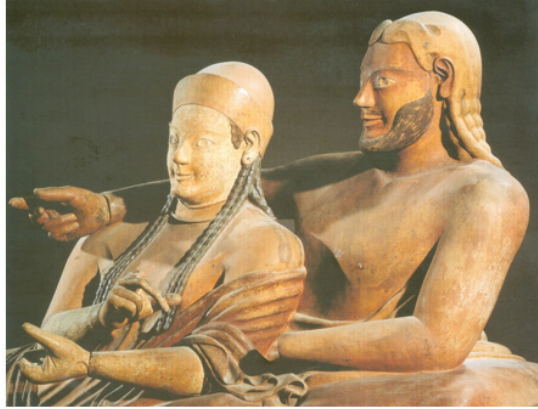
ภาพที่ 4 คู่ชายหญิงที่อิงแอบแนบชิดกันบนฝาหีบศพศิลปะสมัยศตวรรษที่ ๖ พบที่ทาร์ควิเนีย อดีตนครรัฐของอีทรัสคัน