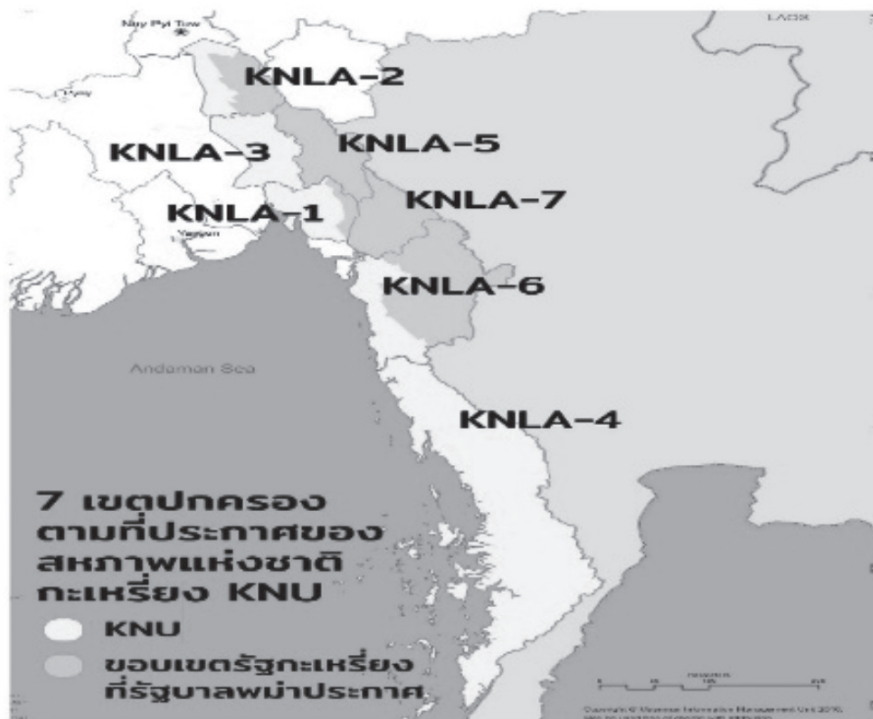
ภาพที่ 3 ทำเลที่ตั้งของกองพันทั้งเจ็ดในรัฐกะเหรี่ยง หรือ กะเหรี่ยง