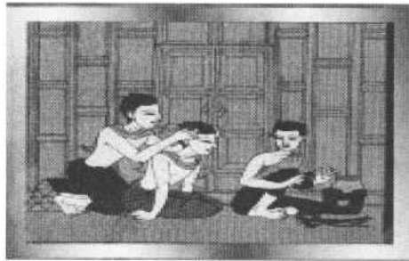
รูปภาพ 5 ภาพตัวอย่างภูมิปัญญาการดูแลสุขภาพ

3) ภูมิปัญญาการดูแลสุขภาพ เป็นองค์ความรู้ในการจัดการ ดูแลสุขภาพ ในชุมชนแบบดั้งเดิม จนกลายเป็นส่วนหนึ่งของวิถีชีวิตเกี่ยวข้องกับความเชื่อพิธีกรรมวัฒนธรรม ประเพณีและทรัพยากรที่แตกต่างกันในแต่ละท้องถิ่นและเป็นที่ยอมรับของชุมชนนั้นๆ เช่น วิธีการปฏิบัติเพื่อการดูแลสุขภาพและรักษาโรค ความเชื่อและระบบความสัมพันธ์ในการดูแลสุขภาพ และอื่นๆ เป็นต้น