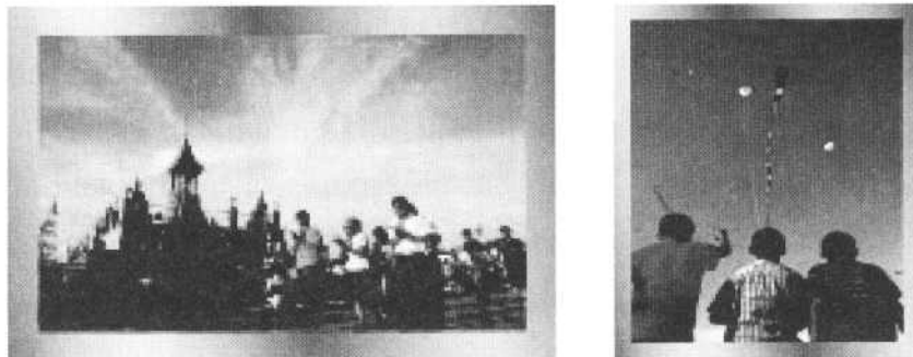
รูปภาพ 3 ภาพตัวอย่างแนวปฏิบัติทางสังคม พิธีกรรมและงานเทศกาลต่างๆ

2.3 แนวปฏิบัติทางสังคม พิธีกรรมและงานเทศกาลต่างๆ หมายถึง แบบอย่างที่ยึดมั่นกันมา และสิ่งที่นิยมถือประเพณีปฏิบัติสืบๆ กันมาจนเป็นแบบแผน ขนบธรรมเนียม หรือจารีตประเพณี ประกอบด้วย ความเชื่อ ขนบธรรมเนียม และประเพณีและพิธีกรรม มีรายละเอียดดังนี้