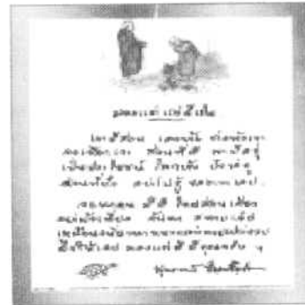
รูปภาพ 1 ตัวอย่างมุขปาฐะ