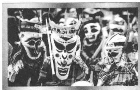
รูปภาพ 4 ภาพตัวอย่างประเพณีและพิธีกรรม

3) ประเพณีและพิธีกรรม สิ่งที่ยึดมั่นถือปฏิบัติสืบๆ กันมาจนเป็นแบบแผน ขนบธรรมเนียมหรือจารีตประเพณี ประกอบด้วย พิธีกรรมการทำมาหากิน พิธีกรรมการดูแลสุขภาพ พิธีกรรมเกี่ยวกับการแลกเปลี่ยนผ่านชีวิต พิธีกรรมในรอบปี/ประเพณี 12 เดือน งานฉลอง และอื่นๆ เป็นต้น