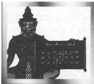
รูปภาพ 6 ภาพตัวอย่างโหราศาสตร์ ดาราศาสตร์

5) โหราศาสตร์ ดาราศาสตร์ เป็นองค์ความรู้ที่คนในท้องถิ่นและชุมชนที่สั่งสม และสืบทอดต่อกันมาเกี่ยวกับการทำนายทายทัก ดวงชะตา ดวงดาว จักรวาล และสิ่งที่เหนือธรรมชาติ หรือเป็นวิชาที่ว่าด้วยการพยากรณ์ โดยอาศัยการโคจรของดวงดาวเป็นหลัก เช่น การตั้งชื่อ การพยากรณ์ การให้ฤกษ์ และอื่นๆ เป็นต้น