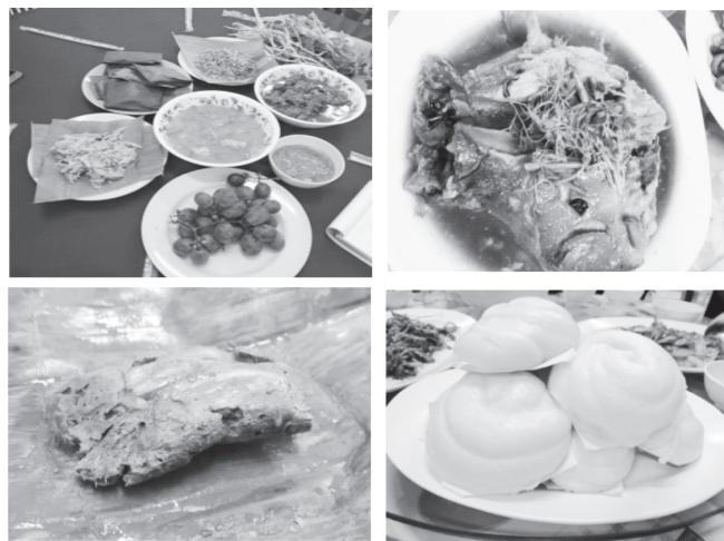
ภาพที่ 3 อาหารพื้นถิ่นชาติพันธุ์ และ อาหารจีนยูนนาน

1.2.2 อาหาร อาหารถือเป็นองค์ประกอบการท่องเที่ยวที่เป็นการอำนวยความสะดวกให้ความรู้ ส่งเสริมการเรียนรู้ให้นักท่องเที่ยวที่ชื่นชอบการท่องเที่ยวเชิงวัฒนธรรม ซึ่งถือเป็นทุนทางสังคม (Social Capital) ที่สนับสนุนการท่องเที่ยวของชุมชนให้มีความสมบูรณ์และชุมชนก็มีรายได้จากการที่นักท่องเที่ยวมาเที่ยวพักผ่อนและใช้จ่ายในชุมชน อาหารพื้นถิ่นที่เป็นเอกลักษณ์ของตำบลแม่สลองนอกที่นักท่องเที่ยวมีโอกาสได้ลิ้มลอง แบ่งออกเป็น 2 รูปแบบ ได้ อาหารของชาวจีนยูนนานสามารถรับประทานได้ในร้านอาหารต่างๆ ในหมู่ที่ 1 บ้านสันติคีรี และอาหารพื้นถิ่นของกลุ่มชาติพันธุ์อื่นสามารถรับประทานได้ก็ต่อเมื่อไปท่องเที่ยวและเข้าพักแบบโฮมสเตย์เพื่อสัมผัสและเรียนรู้วิถีชุมชนเชิงลึกในชุมชนบ้านจะบู่สี บ้านกลาง และบ้านแม่เต๋อ เป็นต้น