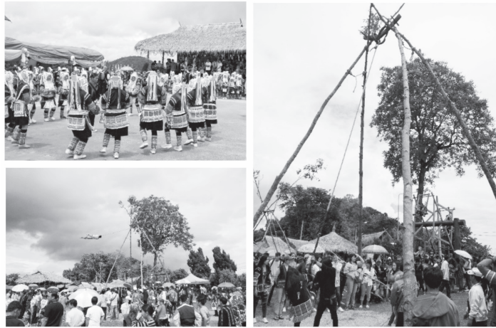
ภาพที่ 2 ประเพณีไล่ชิงช้ากลุ่มชาติพันธุ์อาข่า ตำบลแม่สลองนอก อำเภอมะป้าหลวง จังหวัดเชียงราย

1.2.2 อาหาร อาหารถือเป็นองค์ประกอบการท่องเที่ยวที่เป็นการอำนวยความสะดวกให้ความรู้ ส่งเสริมการเรียนรู้ให้นักท่องเที่ยวที่ชื่นชอบการท่องเที่ยวเชิงวัฒนธรรม ซึ่งถือเป็นทุนทางสังคม (Social Capital) ที่สนับสนุนการท่องเที่ยวของชุมชนให้มีความสมบูรณ์และชุมชนก็มีรายได้จากการที่นักท่องเที่ยวมาเที่ยวพักผ่อนและใช้จ่ายในชุมชน อาหารพื้นถิ่นที่เป็นเอกลักษณ์ของตำบลแม่สลองนอกที่นักท่องเที่ยวมีโอกาสได้ลิ้มลอง แบ่งออกเป็น 2 รูปแบบ ได้ อาหารของชาวจีนยูนนานสามารถรับประทานได้ในร้านอาหารต่างๆ ในหมู่ที่ 1 บ้านสันติคีรี และอาหารพื้นถิ่นของกลุ่มชาติพันธุ์อื่นสามารถรับประทานได้ก็ต่อเมื่อไปท่องเที่ยวและเข้าพักแบบโฮมสเตย์เพื่อสัมผัสและเรียนรู้วิถีชุมชนเชิงลึกในชุมชนบ้านจะบู่สี บ้านกลาง และบ้านแม่เต๋อ เป็นต้น