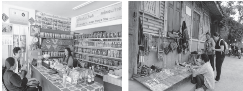
ภาพที่ 4 ร้านค้าของที่ระลึกและผลิตภัณฑ์จากชุมชน