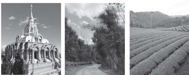
ภาพที่ 5 แหล่งท่องเที่ยวในตำบลแม่สลองนอก

ทรัพยากรธรรมชาติและสิ่งแวดล้อมต่าง ๆ ที่มีบทบาทสำคัญต่อการจัดการท่องเที่ยวของชุมชน ประกอบด้วย ทรัพยากรธรรมชาติด้านแหล่งน้ำ ป่าไม้ ไร่ชา และดอกซากุระหรือต้นนางพญาเสือโคร่งบนดอยแม่สลอง เป็นต้น ทุนทางธรรมชาติที่มีความโดดเด่นและเป็นสิ่งสนับสนุนการท่องเที่ยวของชุมชนที่สำคัญ เช่น ไร่ชาที่เป็นที่นิยมที่สุด คือ ไร่ชา 101 เนื่องจากเป็นไร่ชาที่มีขนาดใหญ่ที่สุดและเป็นไร่ชาแห่งแรกที่เริ่มปลูกชาในพื้นที่ตำบลแม่สลองนอก นอกจากนั้นยังมีไร่ชาวังพุดตาล ไร่ชาหงส์ฟู ไร่ชาดอยหมอกดอกไม้ และมีไร่ชาอื่น ๆ อีกในชุมชน นอกจากนี้ในชุมชนยังมีดอกซากุระหรือต้นนางพญาเสือโคร่งบนดอยแม่สลอง เป็นสายพันธุ์ที่เล็กที่สุด มีสีชมพูอมขาวบานสะพรั่งตลอดทางขึ้นดอยแม่สลอง เส้นทางเข้าสู่หมู่บ้านสันติคีรี ทั้งด้านกิวสะโตและบ้านสามแยกฮาฮา เป็นไม้ป่าที่หายากได้ยากในเมืองไทย ผลิดอกในระหว่างช่วงเดือนธันวาคม-กุมภาพันธ์ ขึ้นอยู่กับสภาพภูมิอากาศของแต่ละปี ซึ่งเป็นที่ดึงดูดให้นักท่องเที่ยวเข้ามาเยี่ยมชมดอกซากุระ