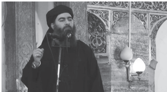
ภาพที่ 2: นายอะบู บักร อัล-บัฆดาดี ผู้นำกลุ่มไอเอสและกาหลิบ (Caliph) ของรัฐอิสลามใน ค.ศ. 2014