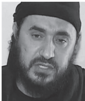
ภาพที่ 1: นายอะบู มุสอับ อัล-ซอร์กาวิ ผู้ก่อตั้งกลุ่มไอเอส

อันที่จริง กลุ่มญะมาอัต อัล-เตาฮีด วัล-ญิฮาดได้มีพัฒนาการมาก่อนหน้า ค.ศ. 2003 โดยผูกอยู่กับผู้นำคือ นายอะบู มุสอับ อัล-ซอร์กาวิ (Abu Musab al-Zarqawi) ชาวจอร์แดนที่มีเครือข่ายนักรบมุสลิมกว้างขวาง เขาได้รับการสนับสนุนทางการเงินจากโอซามะ บิน ลาเดน (Osama bin Laden) ผู้นำกลุ่มอัลกออิดะห์ประมาณ 200,000 ดอลลาร์สหรัฐ เพื่อใช้ในการตั้งค่ายฝึกทหารที่เมืองเฮรัต (Herat) ชายแดนอัฟกานิสถาน-อิหร่าน ใน ค.ศ. 2000 ค่ายนี้ได้ฝึกนักรบจาก จอร์แดน ปาเลสไตน์ เพื่อสร้างกองกำลัง ญุนด์ อัชชาม (Jund Ash-Sham) ให้ปฏิบัติการก่อการร้ายในประเทศอิสราเอล ปาเลสไตน์ จอร์แดน และประเทศอาหรับอื่นๆ โดยมีเป้าหมายเพื่อเปลี่ยนแปลงการปกครอง ปฏิบัติการที่โดดเด่น เช่น การลอบสังหารลอเรนซ์ ไมเคิล โฟลีย์ (Laurence Michael Foley) เจ้าหน้าที่สหรัฐฯ ในกรุงอัมมานเมื่อ ค.ศ. 2002 ผลงานของทหารจากค่ายฝึกนี้สร้างความพอใจให้แก่ บิน ลาเดนเป็นอย่างมาก จึงได้เรียกตัวซอร์กาวิกลับไปยังสำนักงานกลุ่มอัลกออิดะห์เพื่อปฏิญาณเข้าเป็นสมาชิก แต่เนื่องจากซอร์กาวิและบิน ลาเดนมีทัศนคติและมุมมองต่อการทำญิฮาดที่แตกต่างกัน ซอร์กาวิจึงปฏิเสธการเข้าเป็นสมาชิกกลุ่มอัลกออิดะห์ แต่ยังคงความสัมพันธ์ระหว่างกันไว้เพื่อผลประโยชน์ และการสนับสนุนทางการเงินต่อไป (ไวสส์. 2558: 42)