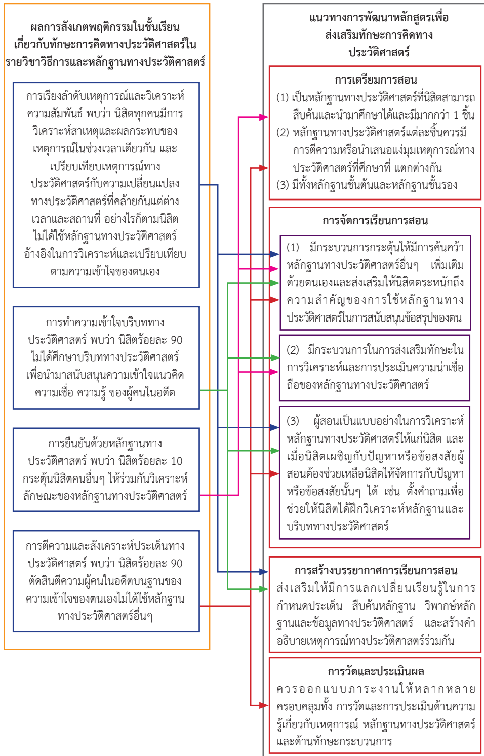
ภาพที่ 3: แนวทางการพัฒนาการเรียนการสอนเพื่อส่งเสริมทักษะการคิดทางประวัติศาสตร์ของนิสิตครูสังคมศึกษา