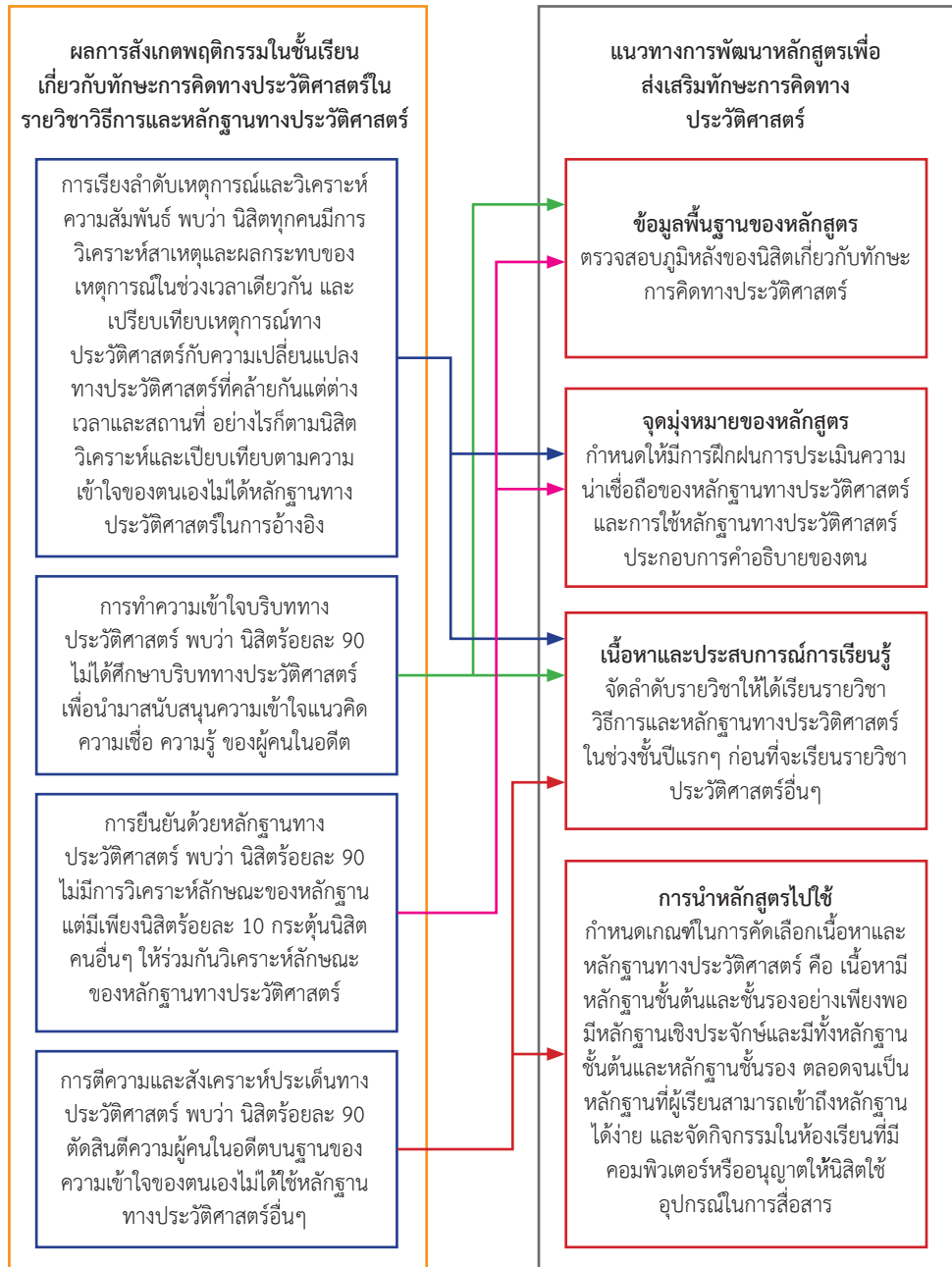
ภาพที่ 2: แนวทางการพัฒนาหลักสูตรเพื่อส่งเสริมทักษะการคิดทางประวัติศาสตร์ของนิสิตครูสังคมศึกษา

2.1 แนวทางการพัฒนาหลักสูตรเพื่อส่งเสริมทักษะการคิดทางประวัติศาสตร์ของนิสิตครูสังคมศึกษา จากการสังเกตพฤติกรรมในชั้นเรียน ผู้วิจัยสามารถสรุปแนวทางการพัฒนาหลักสูตรเพื่อส่งเสริมทักษะการคิดทางประวัติศาสตร์ได้ดังภาพที่ 2 ซึ่งมีรายละเอียดดังต่อไปนี้