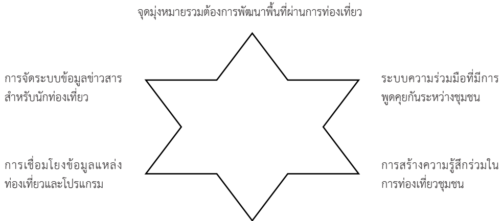
ภาพที่ 2: การเชื่อมโยงเครือข่ายของการท่องเที่ยวชุมชน 3 พื้นที่