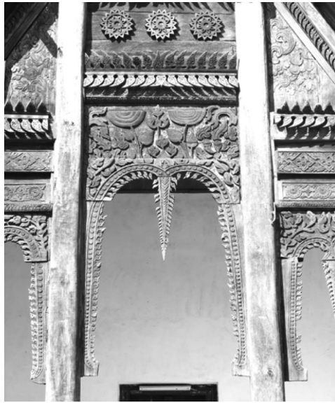
ภาพที่ 18 สำหรับวางมุ้ง ลิมวัดแจ้ง อำเภอเมือง จังหวัดอุบลราชธานี เมื่อวันที่ 25 พฤศจิกายน 2558