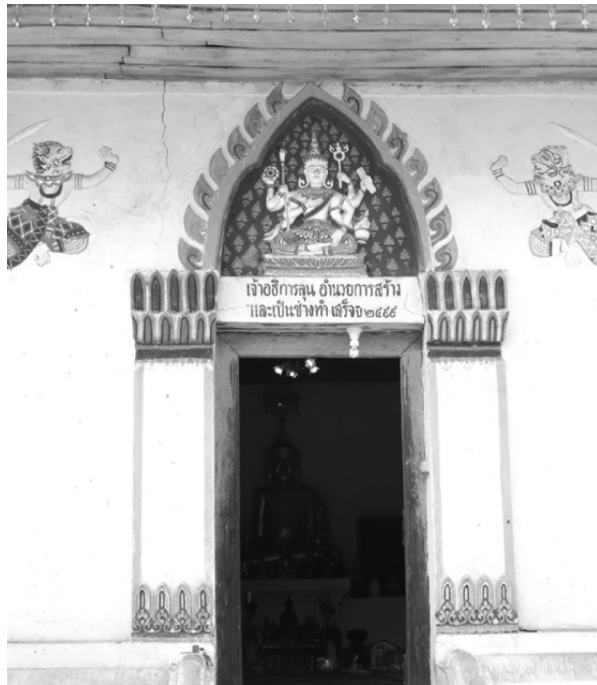
ภาพที่ 8 ปูนปั้นพระนารายณ์ บริเวณประตูทางเข้าลิมวัดค้อเหนือ อำเภอเมือง จังหวัดยโสธร ที่มา: ภาพถ่ายโดยผู้วิจัย เมื่อวันที่ 28 มิถุนายน 2558

ลิมที่ใช้โครงสร้างก่ออิฐถือปูนมีทั้งหมด 7 หลังคือ ลิมวัดค้อเหนือ ลิมวัดหัวคำ ลิมวัดแคน้อย ลิมวัดป่าบกน้อย ลิมวัดนาหลู่ ลิมวัดบากเรือ และลิมวัดหัวเมือง ลิมในกลุ่มนี้ก่อผนังทึบและเจาะช่องหน้าต่างขนาดเล็ก ไม่นิยมประดับลวดลายตามตัวอาคาร เนื่องมาจากยังใช้เค้าโครงลิมพินบ้านที่มีความเรียบง่าย มีปลั่ง สมถะ และมีสัจจะ 1 แต่ลิมที่วัดค้อเหนือมีการประดับปูนปั้นบริเวณซุ้มทรงบรรพแถลงของประตูทางเข้า เป็นรูปพระนารายณ์ ขนาบข้างด้วยสิงหะคล้ายหนุมาน (ภาพที่ 8) และ ลิมวัดป่าบกน้อยมีความแตกต่างออกไปคือ ตัวอาคารก่อผนังลวดล้นคล้ายชั้นบันได (ภาพที่ 9-10) ซึ่งเป็นรูปแบบที่ไม่พบในจังหวัดยโสธร แต่กลับพบในจังหวัดอื่น เช่น ลิมวัดบ้านโต ตำบลท่าตูม อำเภอเมือง จังหวัดมหาสารคาม 2