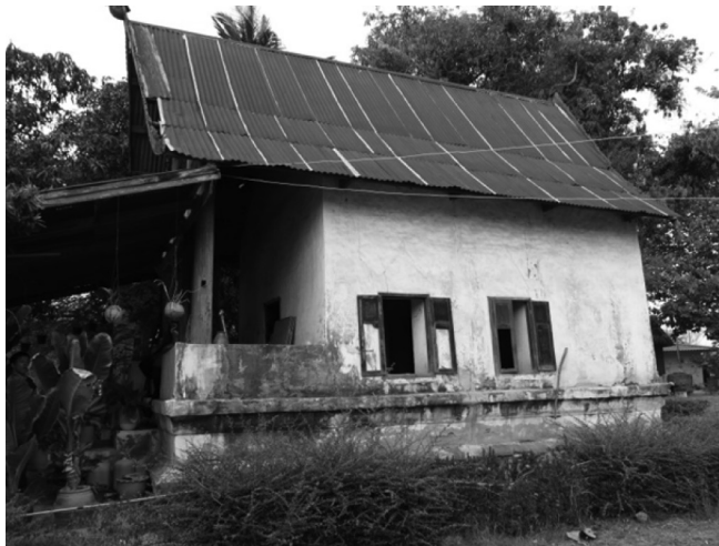
ภาพที่ 11 หลังคาของลิมวัดบากเรือ อำเภอมหาชนะชัย จังหวัดยโสธร

แต่ที่พิเศษคือลิมวัดค้อเหนือและลิมวัดธาตุทองมีการทำหลังคาลาดชั้นหนึ่งก่อน แล้วจึงค่อยทำหลังคาขนาดเล็กซ้อนตรงกลางหลังคาอีกชั้นหนึ่ง เรียกว่า “เทิบซ้อน” 1 (ภาพที่ 12) หลังคาประเภทนี้ พบในลิมแบบเชียงขวาง กล่าวคือ ลิมแบบเชียงขวางมีความเรียบง่าย มีการทำหลังคาซ้อนชั้นด้วยการทำหลังคาลาดชั้นหนึ่งก่อน แล้วจึงค่อยทำหลังคาขนาดเล็กซ้อนตรงกลางบนหลังคาอีกชั้นหนึ่ง เรียกว่า “เทิบซ้อน” ไม่มีการลดชั้นของมุขด้านหน้า ไม่ประดับตกแต่งมาก หลังคาไม่อ่อนโค้ง ไม่มีลวดตะบูนริพัน(ช่อฟ้า) แต่มีช่อฟ้า(โหง)อ่อนคล้ายคลึงกับลิมวัดสุวรรณคีรี (วัดค้อลี) (ภาพที่ 13) ลิมรูปแบบนี้พบแพร่หลายในจังหวัดอีสานเหนือ เช่นหนองคาย เลย อุตรธานี เป็นต้น 2 ผู้เขียนสันนิษฐานว่าอาจเป็นรูปแบบที่มีความสัมพันธ์กับลิมแบบเชียงขวางหรือช่างอาจจะจำรูปแบบมาดัดแปลงให้เข้ากับลิมพินบ้านในจังหวัดยโสธร