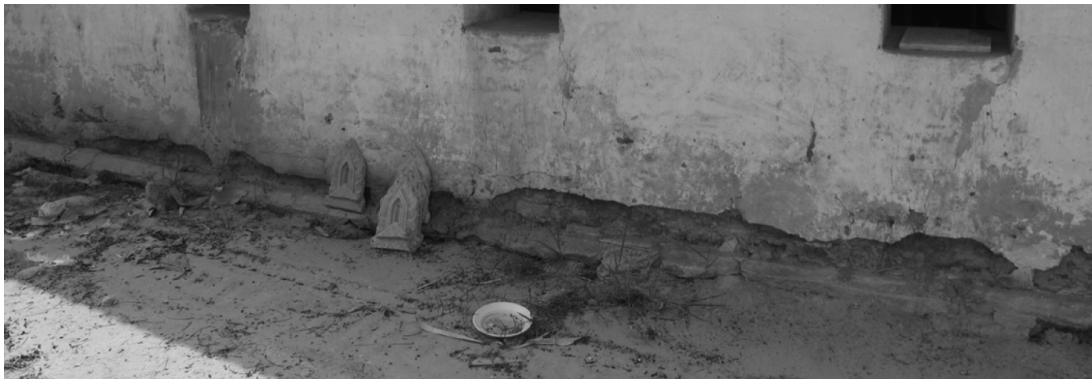
ภาพที่ 5 ฐานลิมวัดนาหลู่ อำเภอคำเขื่อนแก้ว จังหวัดยโสธร เมื่อวันที่ 1 มีนาคม 2558