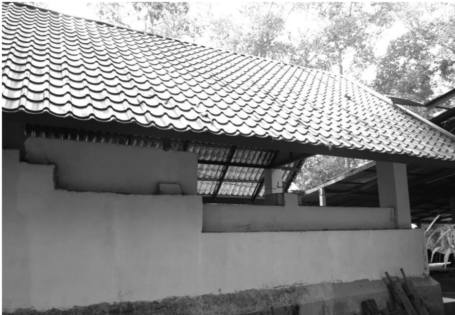
ภาพที่ 9 ส่วนผนังสิมวัดป่าบกน้อย อำเภอคำเขื่อนแก้ว จังหวัดยโสธร ที่มา: ภาพถ่ายโดยผู้เขียน เมื่อวันที่ 1 มีนาคม 2558