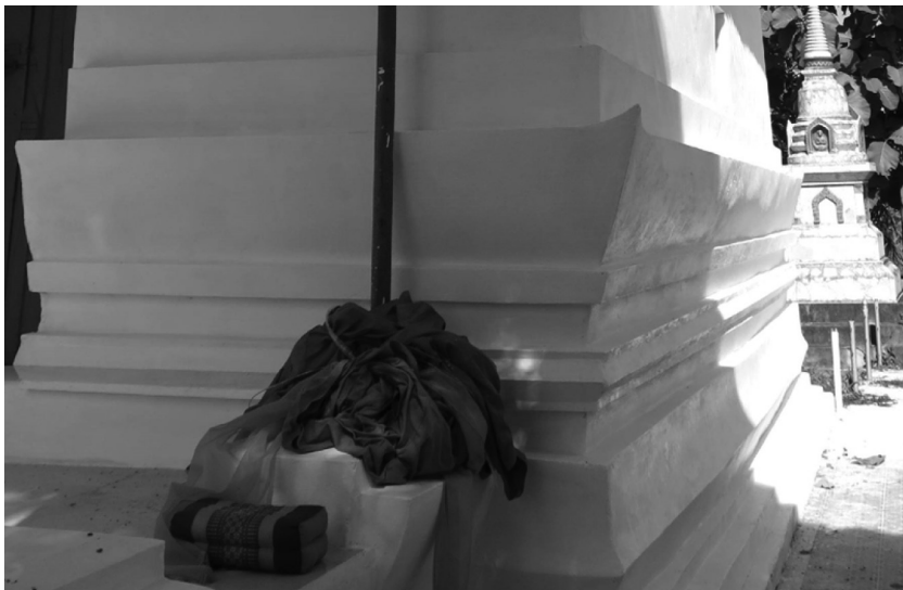
ภาพที่ 3 ฐานสิมวัดหัวเมือง อำเภอมหาชนะชัย จังหวัดยโสธร เมื่อวันที่ 29 มิถุนายน 2558