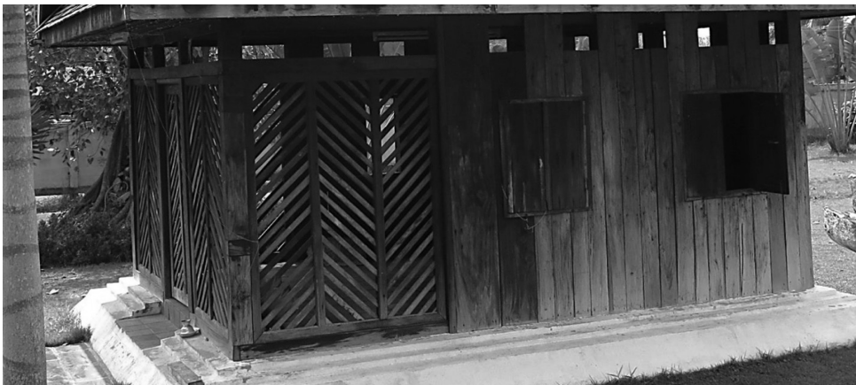
ภาพที่ 7 ส่วนผนังของลิมวัดธาตุทอง อำเภอกุดชุม จังหวัดยโสธร ที่มา: ภาพถ่ายโดยผู้เขียน เมื่อวันที่ 27 กุมภาพันธ์ 2558