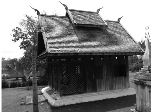
ภาพที่ 12 การขึ้นชั้นหลังคาของสิมวัดธาตุทอง อำเภอกุดชุม จังหวัดยโสธร เมื่อวันที่ 27 กุมภาพันธ์ 2558