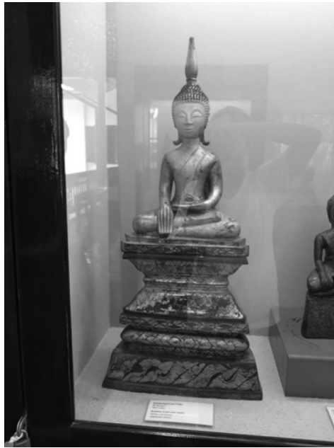
ภาพที่ 4 พระพุทธรูปศิลปะล้านช้าง จากพิพิธภัณฑ์สถานแห่งชาติอุบลราชธานี เมื่อวันที่ 25 พฤศจิกายน 2558