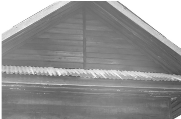
ภาพที่ 15 หน้าบันของลิมวัดสมสะอาด อำเภอเมือง จังหวัดยโสธร