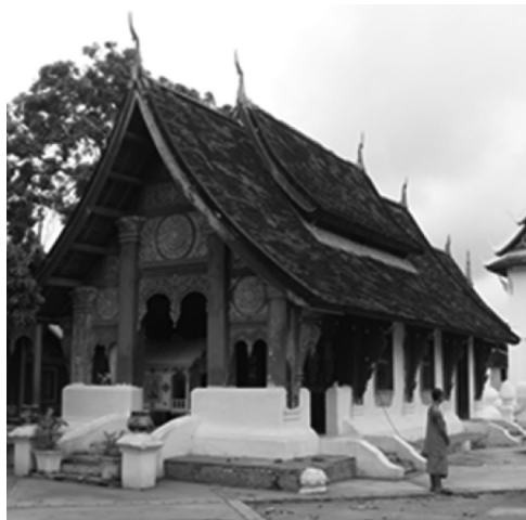
ภาพที่ 13 สิมแบบเชียงขวาง วัดคีลี เมืองหลวงพระบาง ที่มา: ภาพถ่ายโดย ธนภัทร์ ลิ้มหัตถ์นัยกุล เมื่อวันที่ 3 มกราคม 2554