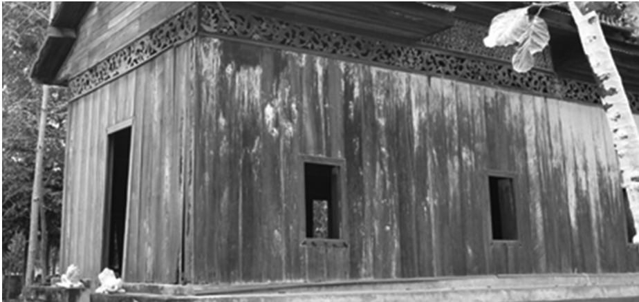
ภาพที่ 6 ส่วนผนังของลิมวัดกุดชุมไฉน อำเภอกุดชุม จังหวัดยโสธร เมื่อวันที่ 26 กุมภาพันธ์ 2558

โครงสร้างของตัวอาคารทำมาจากวัสดุ 2 ประเภท คือโครงสร้างวัสดุที่เป็นไม้ และโครงสร้างก่ออิฐถือปูน ลิมที่ทำจากไม้พบทั้งหมด 3 หลังคือ ลิมวัดสมสะอาด ลิมวัดกุดชุมไฉน และลิมวัดธาตุทอง ลิมในกลุ่มนี้ตัวอาคารมีการฉลุลายบริเวณคอสอง ผนังใช้ไม้กระดานตีในแนวตั้ง เจาะช่องหน้าต่างขนาดเล็ก (ภาพที่ 6) ส่วนลิมวัดธาตุทองที่มีการทำผนังครึ่งหน้าด้วยการตีไม้ระแนงเป็นก้างปลา (ภาพที่ 7) ครึ่งหลังตีด้วยไม้กระดานที่บเหมือนลิมไม้ทั่วไป