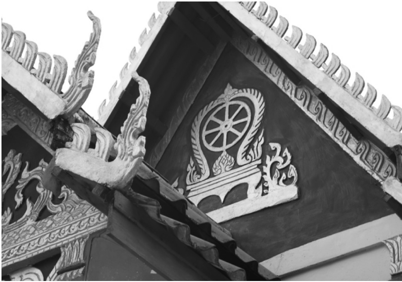
ภาพที่ 14 หน้าบันลายเสมาธรรมจักร ลิมวัดหัวคำ อำเภอเมือง จังหวัดยโสธร เมื่อวันที่ 29 มิถุนายน 2558