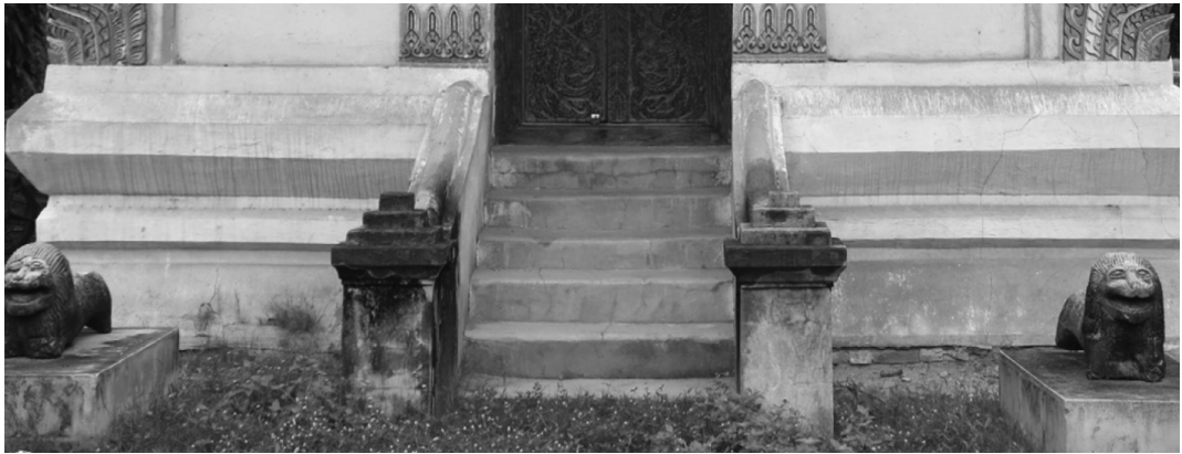
ภาพที่ 2 ส่วนฐานของสิมวัดค้อเหนือ อำเภอเมือง จังหวัดยโสธร