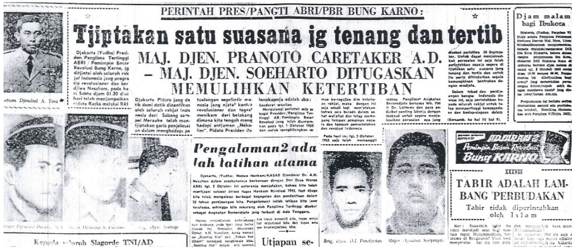
ภาพประกอบ 1 Berita Yudha ฉบับวันที่ 4 ตุลาคม 1965

ใน Berita Yudha ฉบับเดียวกันยังลงแถลงการณ์ของกองทัพเรือที่กล่าวหาว่าอุนตุง ผู้บัญชาการกองทหารอารักขาประธานาธิบดีเป็นผู้ก่อการในกรณีเกิดศตายุ โดยใช้ข้ออ้างเรื่องการรักษาความมั่นคงของการปฏิวัติอินโดนีเซียร่วมกับซูการ์โน ในแถลงการณ์กล่าวว่าซูการ์โนไม่ได้เกี่ยวข้องกับเหตุการณ์นี้ กองทัพเรือปฏิเสธว่าไม่มีส่วนร่วมกับกรณีเกิดศตายุ และพร้อมจะให้ความร่วมมือกับกองทัพกำลังผู้ที่เกี่ยวข้องกับกรณีเกิดศตายุ เพราะเป็นการทรยศต่อชาติและรัฐบาล 4 ข่าวอีกฉบับระบุว่ากลุ่มผู้ก่อการทำการฆาตกรรมสังหารกลุ่มนายพลอย่างโหดเหี้ยม ศพถูกนำไปทิ้งไว้ที่บ่อน้ำร้างที่ลูบังบ้ายาในเขตฐานทัพอากาศอินโดนีเซีย 5 และอีกฉบับก็รายงานข่าวซูการ์โนประณามการก่อการครั้งนี้ว่าโหดร้ายป่าเถื่อน ประกาศจะดำเนินคดีกับผู้เกี่ยวข้องทั้งหมด และยังคงกล่าวถึงกลุ่มนายพลผู้เสียชีวิตว่าเป็นวีรบุรุษแห่งการปฏิวัติ 6