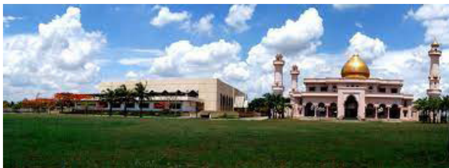
ภาพสำนักจุฬาราชมนตรี ที่ตั้ง 45 หมู่ที่ 3 ถนน คลองแก้ว แขวง คลองสิบ เขต หนองจอก กรุงเทพมหานคร

ชุมชนหนองจอกมีผู้นำเป็นบุคคลสำคัญของมุสลิม มีสถานที่สำคัญคือ สำนักจุฬาราชมนตรี สำนักคณะกรรมการกลางอิสลามแห่งประเทศไทยและศูนย์บริหารกิจการอิสลามแห่งประเทศไทย