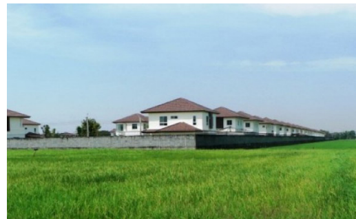
ภาพทุ่งนาที่บ้านลำไทร เขตหนองจอก