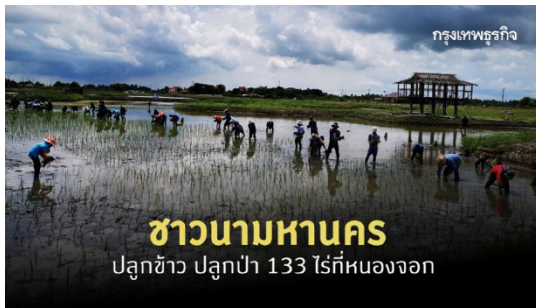
ภาพการทำนาที่เขตหนองจอก

อาจกล่าวได้ว่าชุมชนเขตหนองจอก เป็นชุมชนที่มีการอพยพของมุสลิมไทยเชื้อสายมลายูเข้ามาตั้งถิ่นฐานเป็นเวลากว่าสองร้อยปี บรรพบุรุษของมุสลิมชุมชนนี้มีความเชื่อมโยงกับมุสลิมมลายูที่ปัตตานี เมื่อเวลาผ่านไปมุสลิมกลุ่มนี้ได้ผสมกลมกลืนเป็นคนไทยมุสลิมเชื้อสายมลายู ที่มีถิ่นฐานอยู่ในกรุงเทพมหานคร ประกอบอาชีพทำนา เป็นอาชีพหลัก ในอดีตวิถีการดำเนินชีวิตของคนในชุมชนมีความคล้ายคลึงกับปัตตานี วิถีชีวิตมุสลิมที่หนองจอกตั้งแต่สมัยแรก ๆ พึ่งพาคลองแสนแสบเป็นหลักทั้งด้านอุปโภคบริโภค การทำการเกษตรกรรม ลักษณะของชุมชนเป็นแบบการตั้งบ้านเรือนอยู่สองฝั่งคลอง หันหน้าเข้าหากันและอยู่เป็นกลุ่ม ๆ แบบเครือญาติ ชุมชนหนองจอกเป็นชุมชนที่มีความอุดมสมบูรณ์ทางธรรมชาติ พื้นที่ชุมชนหนองจอกประกอบไปด้วยส่วนที่เป็นคลอง ลำกระโดง ลำราง มากถึง 114 สาย ชาวบ้านในสมัยก่อนจึงมีวิถีชีวิตที่ผูกพันกับธรรมชาติ การคมนาคมใช้ทางน้ำเป็นหลักแม้ในปัจจุบันคลองก็ยังคงมีประโยชน์ต่อชุมชนในด้านการประกอบอาชีพเกษตรกรรม บริเวณเขตหนองจอกยังคงมีการทำนาอยู่ที่บ้านลำไทร หรือ “คอยรุตตี๊กว่า” เป็นหมู่บ้านเล็กๆ แห่งหนึ่งในเขตหนองจอก ชานเมืองของกรุงเทพมหานคร คำว่า “ลำไทร” เป็นชื่อเรียกของชาวบ้าน ตามสภาพภูมิศาสตร์ที่เป็นลำคลองคดเคี้ยว มีต้นไทรขึ้นปกคลุมหนาที่บนพื้นที่ ส่วนคำว่า คอยรุตตี๊กว่า นั้นเป็นภาษาอาหรับมีความหมายโดยรวมว่า ผู้ที่มีความรักดีต่อพระผู้เป็นเจ้า (อัลลอฮ) โดยที่นี้เป็นชุมชนมุสลิมที่ยึดอาชีพชาวนามาตั้งแต่อดีต