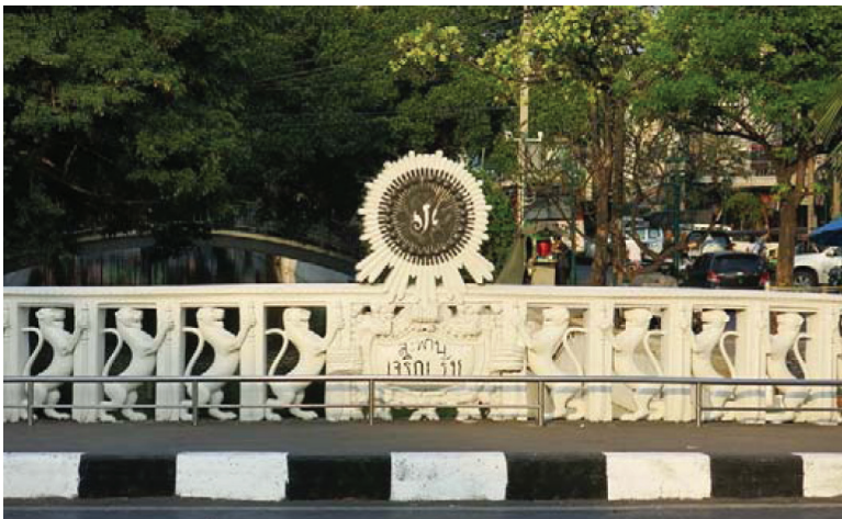
รูปที่ 7 สะพานเจริญรัช 31

การก่อสร้างสะพานชุดเจริญของพระบาทสมเด็จพระมงกุฎเกล้าเจ้าอยู่หัวเป็นการสืบทอดธรรมเนียมปฏิบัติของพระราชบิดาที่โปรดเกล้าฯ ให้สร้างสะพานเป็นประจำทุกปีโดยเริ่มตั้งแต่ พ.ศ. 2438 เพื่อบำรุงพระนครให้มีความสง่างามและเป็นทางสาธารณะให้ผู้คนสัญจรไปมาได้สะดวก 3 นัยของการสร้างสะพานที่คงทนถาวร สวยงาม และทันสมัยบ่งชี้ความเจริญของกรุงเทพฯ ที่ขยายตัวออกไปทุกทิศจากเดิมมีเฉพาะรอบเกาะรัตนโกสินทร์ รวมทั้งการตัดถนนใหม่ ๆ เพื่อรองรับรถยนต์ที่เพิ่มมากขึ้น เหตุผลที่สำคัญอีกประการหนึ่งคือ กรุงเทพฯ ในเวลานั้นมีชาวต่างประเทศเดินทางเข้ามาค้าขายจำนวนมาก จำเป็นที่ชนชั้นนำต้องเร่งสร้างความเจริญและทันสมัยทางกายภาพให้ปรากฏแก่ชาติตะวันตก สะพานที่สวยงามและมีเทคโนโลยีการก่อสร้างที่ทันสมัยจึงเป็นอีกสิ่งหนึ่งซึ่งช่วยสร้างความสง่างามให้กับพระนคร