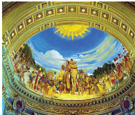
รูปที่ 9 พระราชกรณียกิจของพระบาทสมเด็จพระพุทธยอดฟ้าจุฬาโลก พระที่นั่งอนันตสมาคม 4 เพดานโดมด้านทิศเหนือ

ลักษณะของภาพพระราชกรณียกิจมีการจัดองค์ประกอบโดยเน้นบุคคลสำคัญอยู่ตรงกลาง มีการเขียนทัศนียวิทยาและแสงเงาแบบตะวันตก ภาพคนมีสีรีระเหมือนจริง (รูปที่ 9) นอกจากนี้เนื้อหาพระราชกรณียกิจที่เป็นหลักบริเวณเพดานโดมสำคัญ ๆ แล้ว ยังมีการผูกกลายโดยใช้กระหนกก้านขดที่แลดูเป็นลายพันธุ์พฤกษาแบบตะวันตกเป็นพื้นหลังมีเทวดาฝรั่งแทรกอยู่ ระหว่างห้องแต่ละห้องประดับสัญลักษณ์แทนองค์พระมหากษัตริย์ เช่น ครุฑ พระยานาค ช้างเอราวัณ (รูปที่ 10) ตรงกลางเพดานแต่ละห้องมีตัวอักษรประดิษฐ์ จปร. และ วปร. เป็นการย้ำว่าทั้งสองพระองค์เป็นผู้ที่โปรดเกล้าฯ ให้สร้างพระที่นั่งองค์นี้