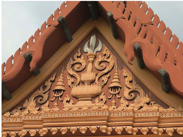
รูปที่ 2 หน้าบันด้านทิศตะวันออก หอประชุมโรงเรียนนวิชาวุธวิทยาลัย

สมชาติ จิงสิริรักษ์ อธิบายว่าโรงเรียนมหาดเล็กหลวงเป็นสถาปัตยกรรมแบบชาตินิยมเพราะเหตุผล 2 ประการคือ หนึ่ง โรงเรียนแห่งนี้มีรูปแบบสถาปัตยกรรมไทยเหมือนวัดวาอารามที่สวยงามทั้งหลาย ซึ่งพระบาทสมเด็จพระมงกุฎเกล้าเจ้าอยู่หัวทรงเห็นว่า คือ สัญลักษณ์แห่งความเป็นไทยทางด้านศิลปะ สถาปัตยกรรม และสอง สถานที่แห่งนี้ถูกสร้างโดยพระบรมราชโองการของพระมหากษัตริย์ที่ทรงประกาศอุดมการณ์ชาติ ศาสนา พระมหากษัตริย์ให้คนไทยยึดถือ อีกทั้งเป็นสถานที่ที่ป่มเพาะให้นักเรียนมีความยึดมั่นอย่างยั้งในองค์พระมหากษัตริย์ โดยปรากฏในกิจวัตรประจำวันของนักเรียนที่หลังจากสวดมนต์เสร็จแล้ว ต้องยืนร้องเพลงสรรเสริญพระบารมี นอกจากนี้ยังทรงพระกรุณาพิเศษให้นักเรียนโรงเรียนนี้ได้เข้าเฝ้าถวายงานอย่างใกล้ชิด 2