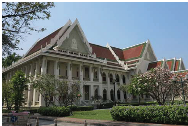
รูปที่ 3 ตึกบัญชาการหรือตึกคณะอักษรศาสตร์ จุฬาลงกรณ์มหาวิทยาลัย

อาคารดังกล่าวมีความสูง 2 ชั้น มีแผนผังเป็นรูปตัวอี E ประกอบไปด้วยมุข 3 มุข มุขกลางเป็นประธานมีมุขริมซ้ายและขวาเชื่อมด้วยปีกซึ่งทำเป็นห้องสี่เหลี่ยมผืนผ้า มุขกลางเป็นมุขทางเข้า ประกอบด้วย โถงทางเข้าใหญ่ จุดตัดตรงกลางอาคารมีบันไดขนาดใหญ่ขึ้นสู่ชั้นบน มุขริมซ้ายและขวาประกอบด้วยห้องโถงขนาดใหญ่ ทั้งหมดล้อมรอบด้วยระเบียงอีกชั้นหนึ่ง จุดเด่นของอาคารอยู่ที่หลังคาที่ผสมสถาปัตยกรรมไทย และสถาปัตยกรรมเขมร ที่หน้าบันมุขกลางทั้งทิศเหนือและใต้ประดับประติมากรรมรูปครุฑยุคหน้าบันมุขใต้ชื่อ ด้านทิศเหนือประดับตราอาร์มแผ่นดิน (รูปที่ 4)