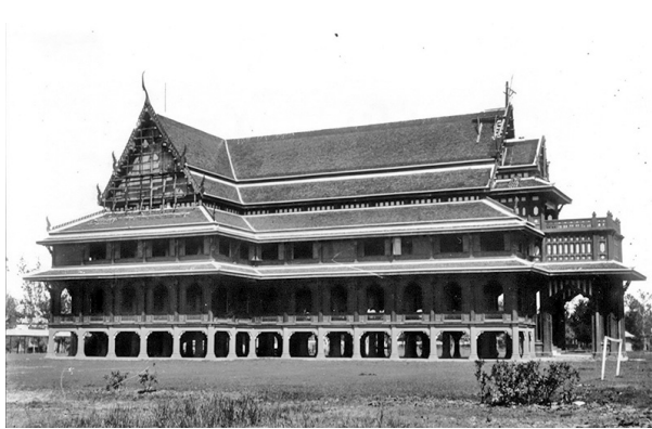
รูปที่ 1 อาคารหอสวดหรือหอประชุมโรงเรียนนวิชาวุธเมื่อแรกสร้าง 1