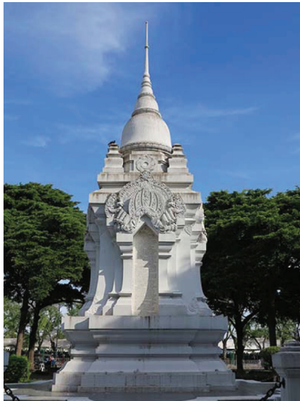
รูปที่ 5 อนุสาวรีย์ทหารอาสา สนามหลวง

ลักษณะอนุสาวรีย์ทหารอาสาที่ท้องสนามหลวง (รูปที่ 5) เลียนแบบเจดีย์ทรงปราสาทยอดในศิลปะสุโขทัย ตัวเรือนธาตุมีแผ่นจารึกหินอ่อนประดับทั้ง 4 ด้าน แต่ละด้านกล่าวถึงเหตุผลแห่งการประกาศสงคราม การประกาศรับทหารอาสาสมัคร การจัดกำลังรบ และอธิบายเหตุผลที่พระบาทสมเด็จพระมงกุฎเกล้าเจ้าอยู่หัวโปรดเกล้าฯ ให้สร้างอนุสาวรีย์เพื่อให้คนไทยทั้งหลายได้ระลึกถึงและนำไปเป็นแบบอย่างอันดีงาม จารึกอีก 2 ด้านระบุชื่อทหารผู้สละชีวิตและสถานที่ที่เสียชีวิต การสร้างอนุสาวรีย์ทหารอาสาแห่งนี้สะท้อนให้เห็นถึงการเปลี่ยนแปลงโลกทัศน์ของคนไทยจากที่เคยสร้างสถูปหรือเจดีย์เพื่อเป็นที่ระลึกถึงบุคคลหรือเหตุการณ์สำคัญทางประวัติศาสตร์ หรือสร้างเพื่ออุทิศบุญกุศลให้กับผู้ตายตามความเชื่อทางพระพุทธศาสนาซึ่งมักปรากฏอยู่ในวัดหรือศาสนสถาน แต่อนุสาวรีย์ทหารอาสาแห่งนี้พระบาทสมเด็จพระมงกุฎเกล้าเจ้าอยู่หัวทรงมีพระราชประสงค์ให้สร้างในพื้นที่สาธารณะเปิดโล่งให้ผู้คนเข้าถึงได้ง่าย สะท้อนแนวคิดการสร้างอนุสาวรีย์ในความหมายแบบตะวันตกแม้ว่าจะยังคงยึดติดรูปแบบสถูปเจดีย์แบบไทยประเพณีอยู่ก็ตาม