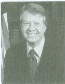
ประธานาธิบดี จิมมี่ คาร์เตอร์

สื่อมวลชนยังรายงานด้วยว่า คาร์เตอร์ได้รับการยอมรับจากผู้นำของประเทศในโลกที่สามหลายคน ผู้นำบางคนยอมรับว่าการที่พวกเขารอดชีวิตมาได้และประเทศของเขาเปลี่ยนระบบการปกครองจากเผด็จการมาเป็นประชาธิปไตย ส่วนหนึ่งเป็นผลมาจากการต่อสู้เรื่องสิทธิมนุษยชนของคาร์เตอร์นั่นเอง นายพลมานูเอล นอริเอกา (Manuel Noriega) แห่งปานามาได้เชิญคาร์เตอร์ไปเป็นสักขีพยานในการเลือกตั้งของปานามาในปี ค.ศ. 1989 ซึ่งเป็นผลมาจากการที่คาร์เตอร์สนับสนุนให้คืนคลองปานามาให้แก่ปานามาภายในปี 2000 แต่คาร์เตอร์ประกาศไม่รับรองการเลือกตั้งครั้งนี้เนื่องจากมีการโกงการเลือกตั้ง ดาร์เนียล ออร์เทกา (Daniel Ortega) ผู้นำกลุ่มแซนดินิสตา (Sandinista) ก็ได้เชิญให้คาร์เตอร์ไปเป็นสักขีพยานในการเลือกตั้งของนิการากัวในปี ค.ศ. 1990 เนื่องจากเขาเห็นว่าคาร์เตอร์ไม่ได้สนับสนุนจอมเผด็จการ อนาสตาซิโอ โซโมซา (Anastasio Somoza) ในสมัยที่เขาเป็นประธานาธิบดีของสหรัฐฯ ซึ่งส่งผลให้โซโมซาหมดอำนาจไป และเมื่อออร์เทกาพ่ายแพ้การเลือกตั้ง เขาก็ยอมรับโดยดีทั้งนี้เพราะเขาได้สัญญากับคาร์เตอร์ไว้แล้ว