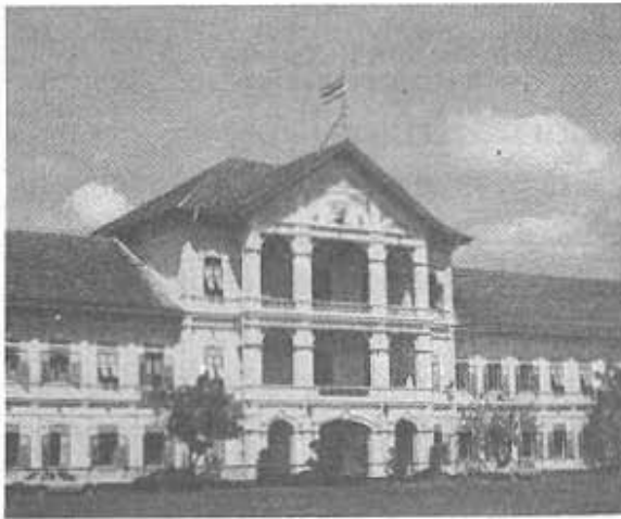
กองบัญชาการโรงเรียนนายร้อยพระจุลจอมเกล้าในปัจจุบัน (พ.ศ. 2528)

โรงเรียนนายร้อยพระจุลจอมเกล้า (Phra Chula Chomklao Military Academy) เป็นสถาบันการศึกษา วิชาการทหารแห่งหนึ่งของกองทัพบกที่ให้การศึกษานักอุดมศึกษา นักศึกษาในสถาบันนี้ เรียกว่า นักเรียนนายร้อย จุดประสงค์ก็เพื่อให้การศึกษานักหัด อบรมนักเรียนนายร้อย เพื่อให้สำเร็จการศึกษาออกไปรับราชการเป็นนายทหารสัญญาบัตรที่เป็นหลักของกองทัพบก ระยะเวลาในการศึกษา 5 ปี นักเรียนนายร้อยที่สำเร็จการศึกษาแล้วจะได้รับปริญญาตรีวิทยาศาสตร์บัณฑิต เขียนย่อว่า “วท.บ. (ทบ.)”