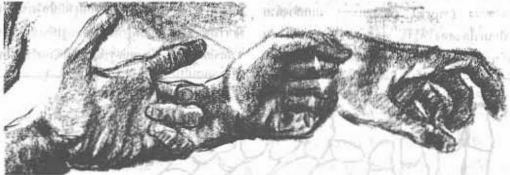
การวาดเขียนแสดงน้ำหนัก

แบบครูก่อน จนมีความชำนาญแล้ว จึงให้ฝึกเขียนสิ่งที่ละเอียดซับซ้อนมากขึ้น เป้าหมายเพื่อให้เป็นช่าง และหวังจะให้สืบทอดรูปแบบของครูต่อไป การฝึกฝนตามระบบอยู่กับครูนี้ ใช้เวลาไม่แน่นอน ขึ้นอยู่กับครูและความสนใจของนักเรียน วิธีสอนก็ใช้วิธีลอกแบบและเรียนแบบ ต่อเมื่อมีระบบโรงเรียนเกิดขึ้น การฝึกปฏิบัติการวาดเขียน จึงมีการจัดลำดับขั้นตอนตามลักษณะของระบบการศึกษา ซึ่งแบ่งออกเป็นลักษณะใหญ่ๆ ได้ ๒ ลักษณะคือ การฝึกฝนตามระบบการศึกษาสามัญ และ การฝึกฝนตามระบบ การศึกษาศิลปะ โดยตรง