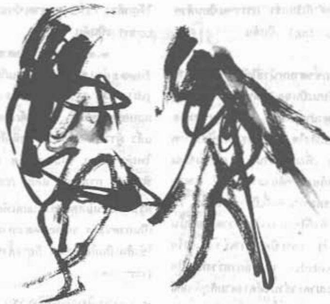
การวาดเขียนตามท่าทาง