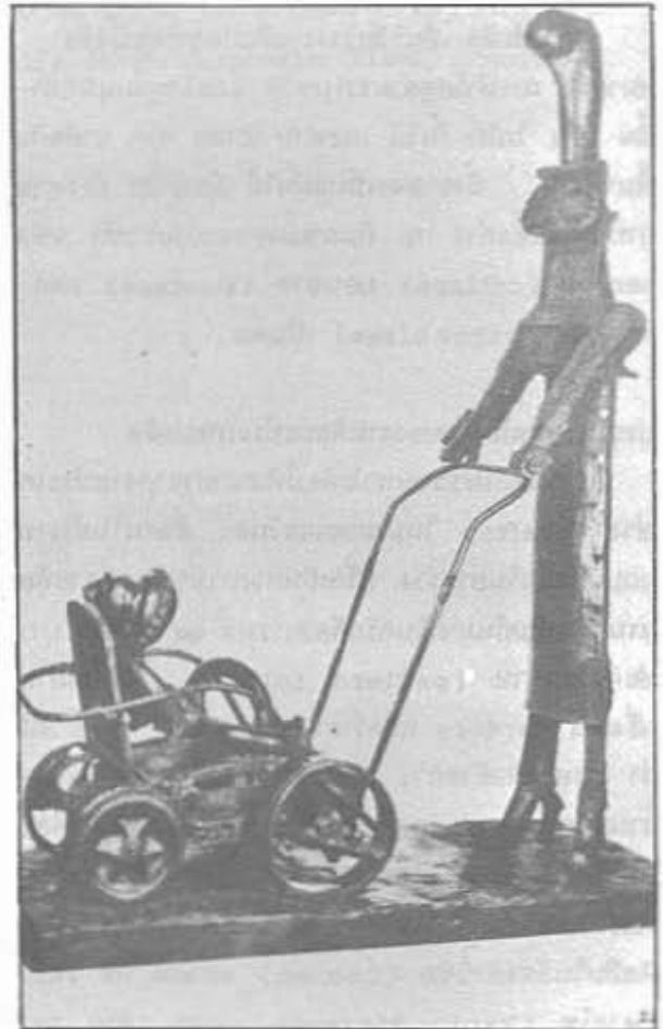
ตัวอย่างงานแอสเซมบลิจ ของพอล ปิกัสโซ ชื่อ "ผู้หญิงกับรถเข็นเด็ก" (Woman with a Pram) ๑๙๕๔-๑๙๖๐

ลักษณะเป็นทั้งจิตรกรรม (painting) และประติมากรรม (sculpture) หรือลักษณะผสมผสาน ระหว่างจิตรกรรม และประติมากรรมชนิดที่เรียกว่า จิตรกรรม ๓ มิติ (3-D painting)