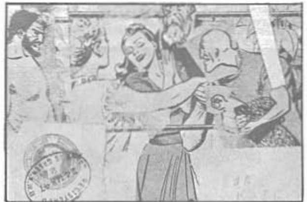
งานคอลลาจ ของเคอร์ท ชวิทเตอร์ส ชื่อ "เพื่อเคท" (For Kate) ๑๙๑๙

(Jean Arp) เคอร์ท ชวิทเตอร์ส (Kurt Schwitters) และ มาเซล ดูชองปี (Marcel Duchamp) เป็นต้น (ดูภาพประกอบ)