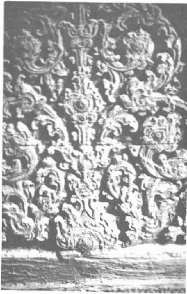
ลายจำหลักบานประตูหอไตร วัดระฆัง เป็นงานที่ได้รับความบันดาลใจมาจากธรรมชาติ ศิลปะสมัยรัชกาลที่ ๑ แห่งกรุงรัตนโกสินทร์

สะท้อนใจต่อพฤติกรรมอันเลวร้ายดังกล่าว ทำให้เกิดความบังคาลใจ ในการเขียนภาพพระพุทธรูปขึ้นมาดูขึ้น พระศอ มีโลหิตหลั่งไหลออกมาแดงฉาน ด้วยมีความมุ่งหมายเพื่อแสดงให้เห็นว่า พระพุทธรูปนั้นมีชีวิตและจิตวิญญาณเหมือนพระพุทธรองค์ แม้ว่าจะเป็นสิ่งสมมติ แทนองค์สมเด็จพระสัมมาสัมพุทธเจ้า จิตรกรรมดังกล่าว จึงเป็นงานที่สะท้อนสภาพสังคมและมีคุณค่าในการปฏิรูป