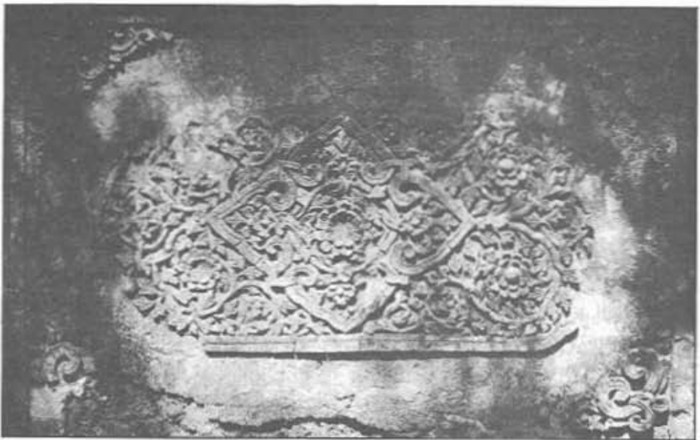
ลายปั้นปูนประดับผนังวิหาร วัดนางพญา เมืองศรีสัชชนาลัย เป็นลายที่ได้รับความนิยมมากที่สุดมาจากพระรณพฤษา ศิลปะแบบสุโขทัย