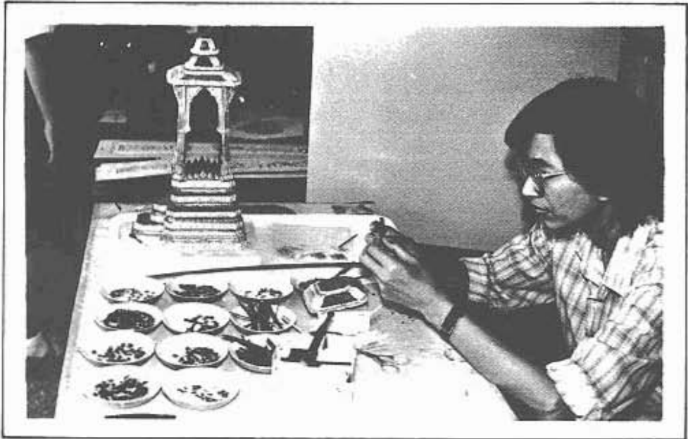
"งานช่างประดับกระจกสี"

(ภาพ: ช่างสิบหมู่ กองหัตถศิลป์ กรมศิลปากร)