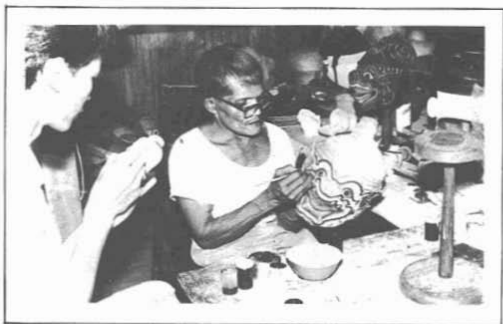
"ช่างทำหุ่นหัวโขน"

(ภาพ: ช่างสิบหมู่ กองหัตถศิลป์ กรมศิลปากร)