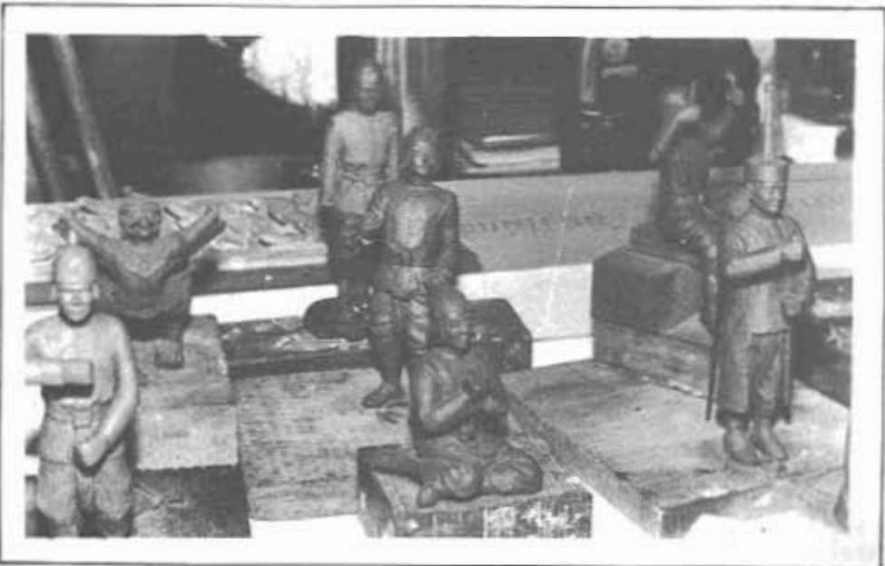
“งานช่างปั้นและช่างหล่อหุ่น”