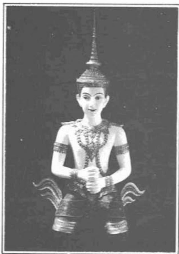
"งานช่างปั้นและช่างหล่อหุ่น"

(ภาพ: ช่างสิบหมู่ กองหัตถศิลป์ กรมศิลปากร)