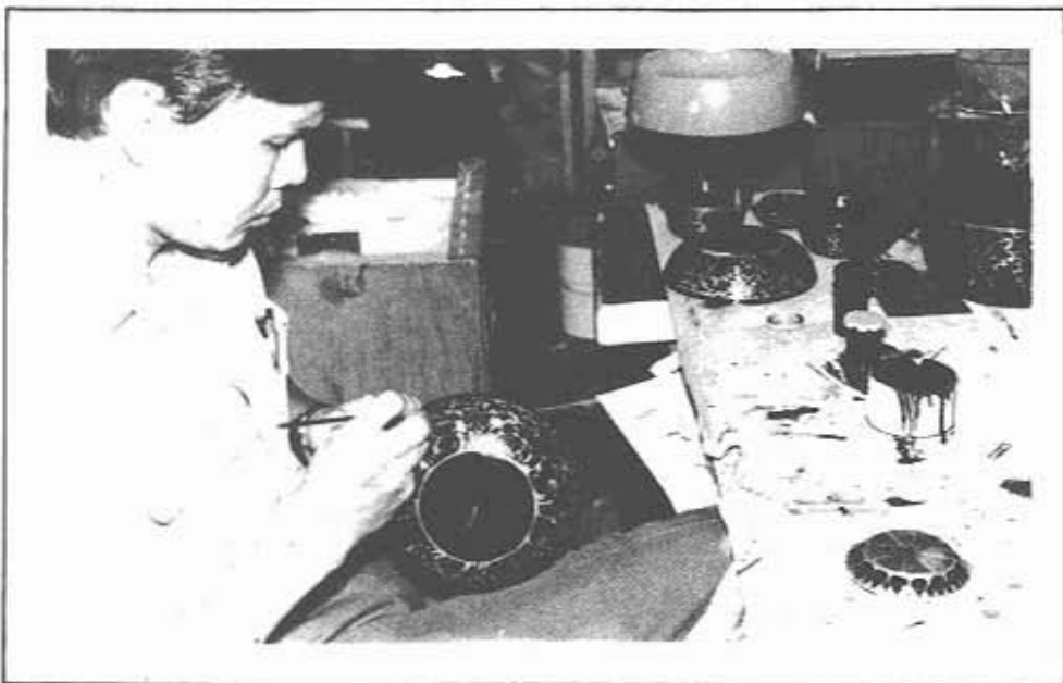
"งานช่างโลหะ"

(ภาพ: ช่างสิบหมู่ กองหัตถศิลป์ กรมศิลปากร)